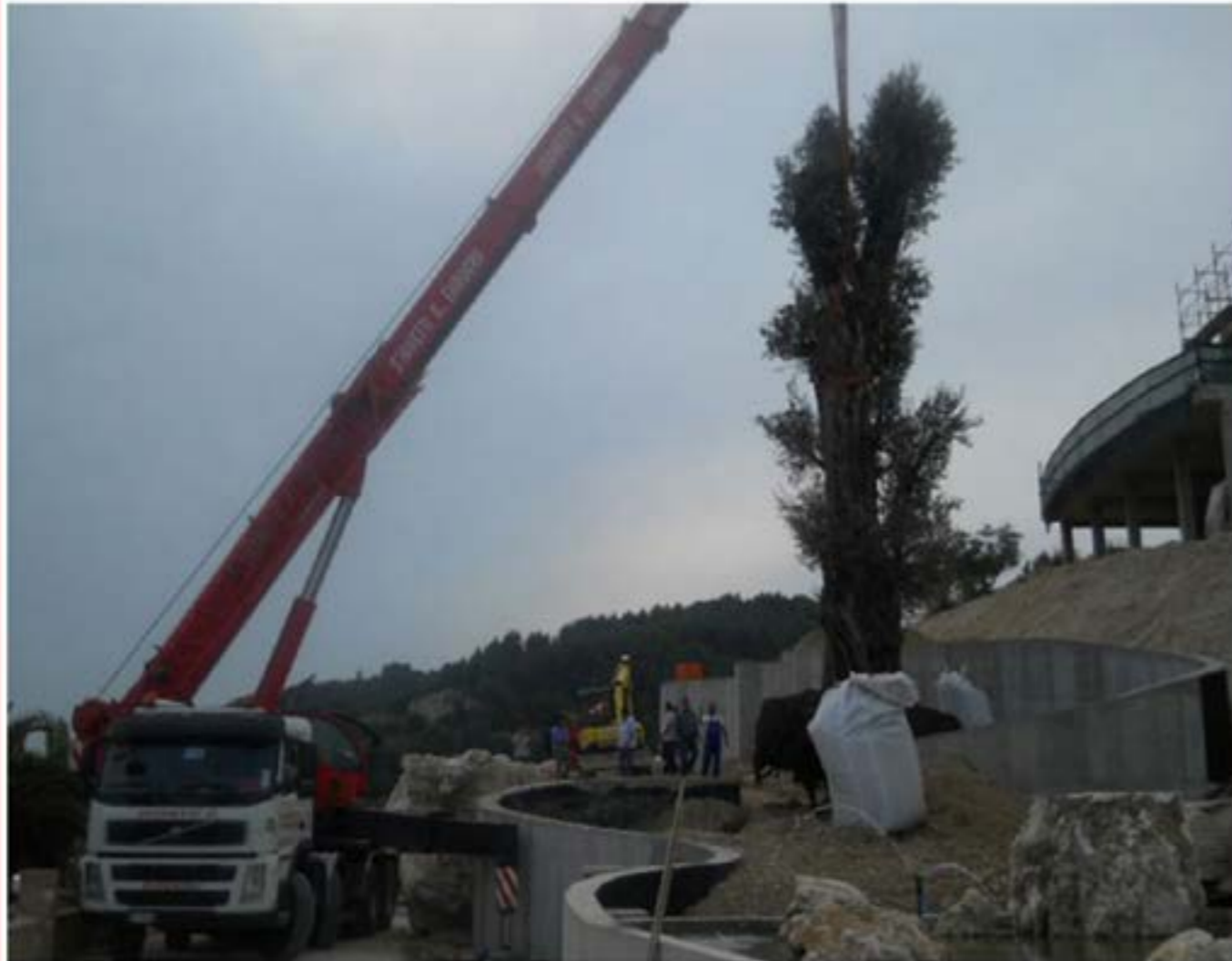
Montaggio carpenteria Autogru T120