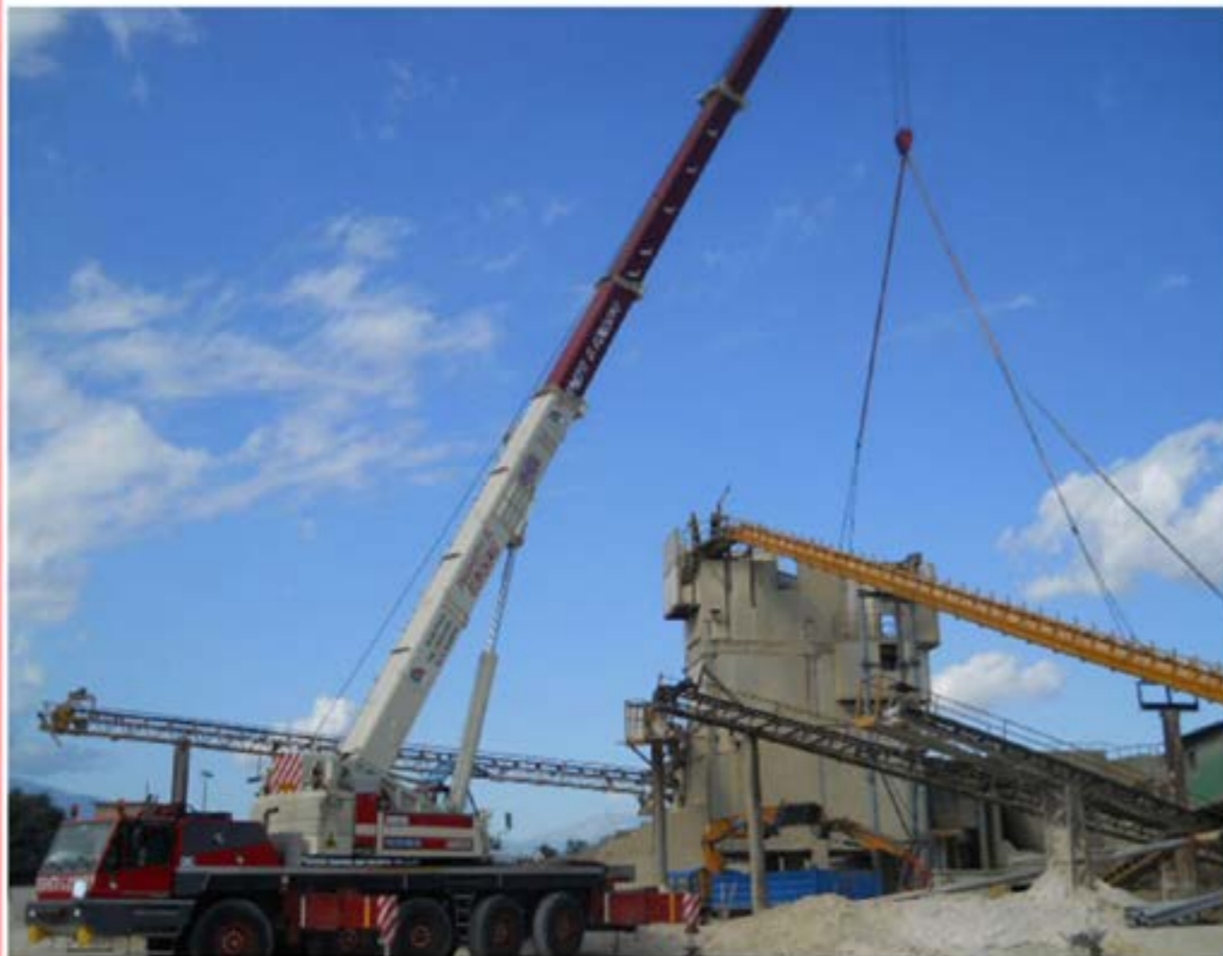
Montaggio impianto calcestruzzo Autogru T120