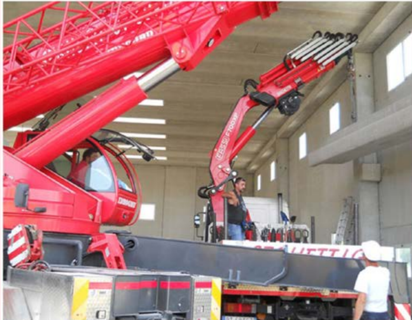
Montaggio prefabbricati - Autogru T150 e Man con Gru