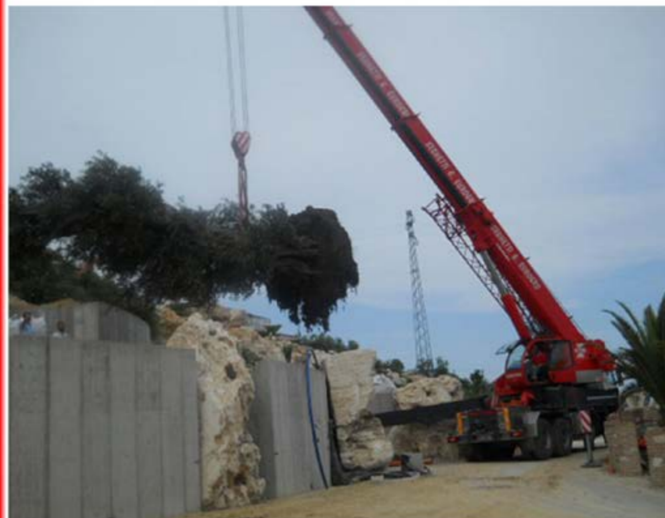
Montaggio carpenteria Autogru T120