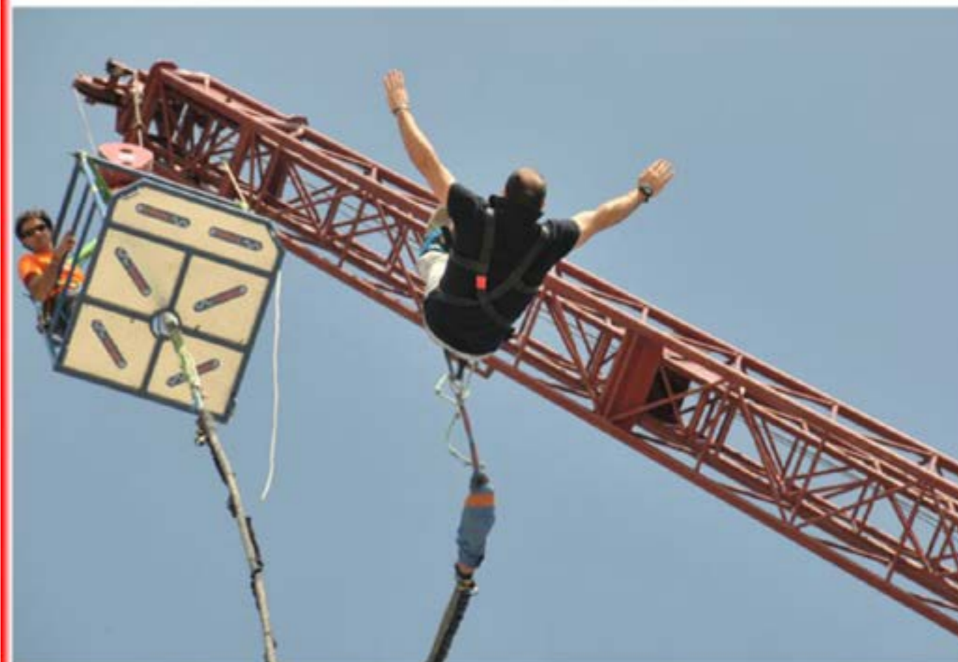
Bungee jumping - Autogru T120