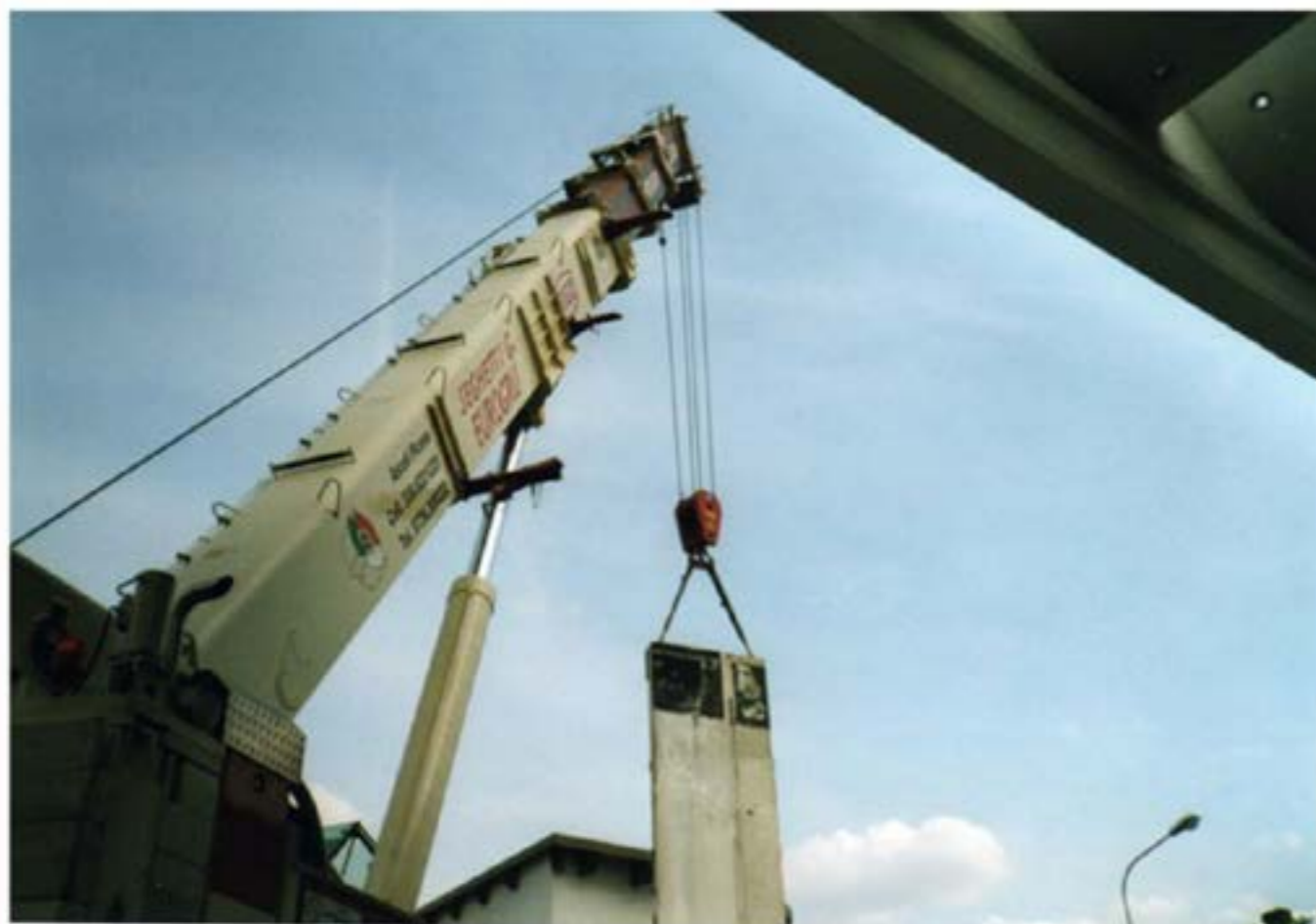
Smontaggio Prefabbricati Autogru T120