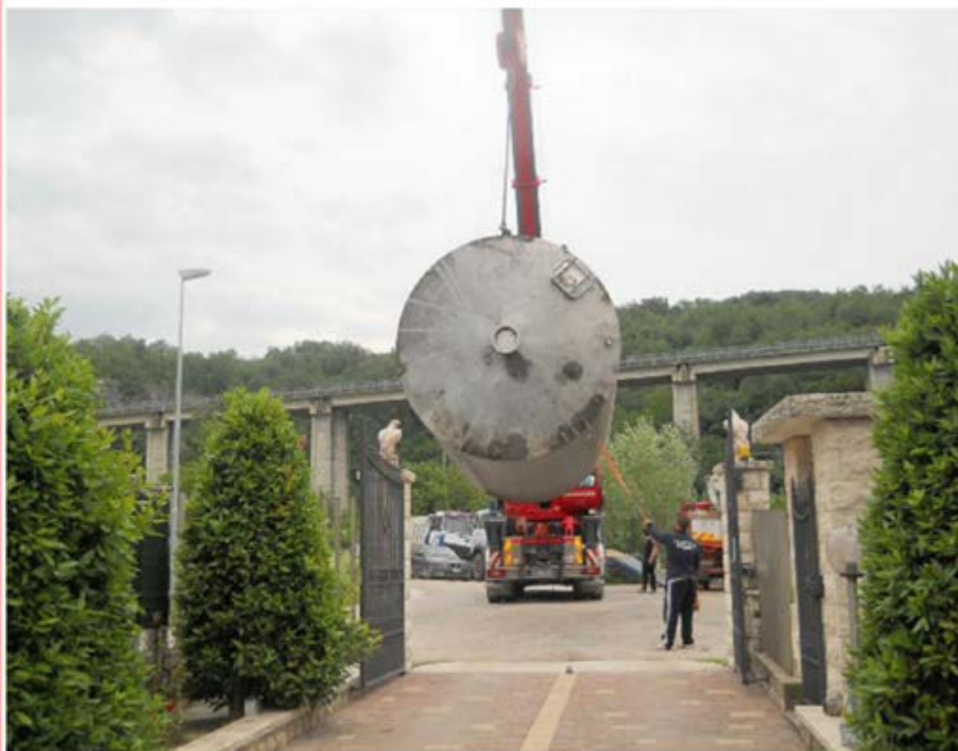
Posizionamento Cisterna - Autogru T150