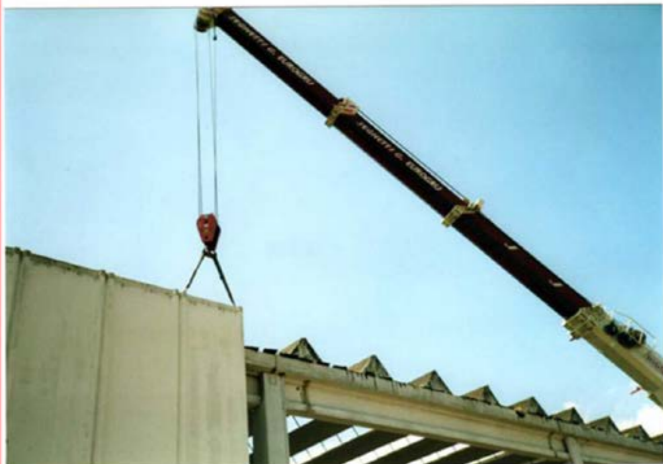
Smontaggio Prefabbricati Autogru T120