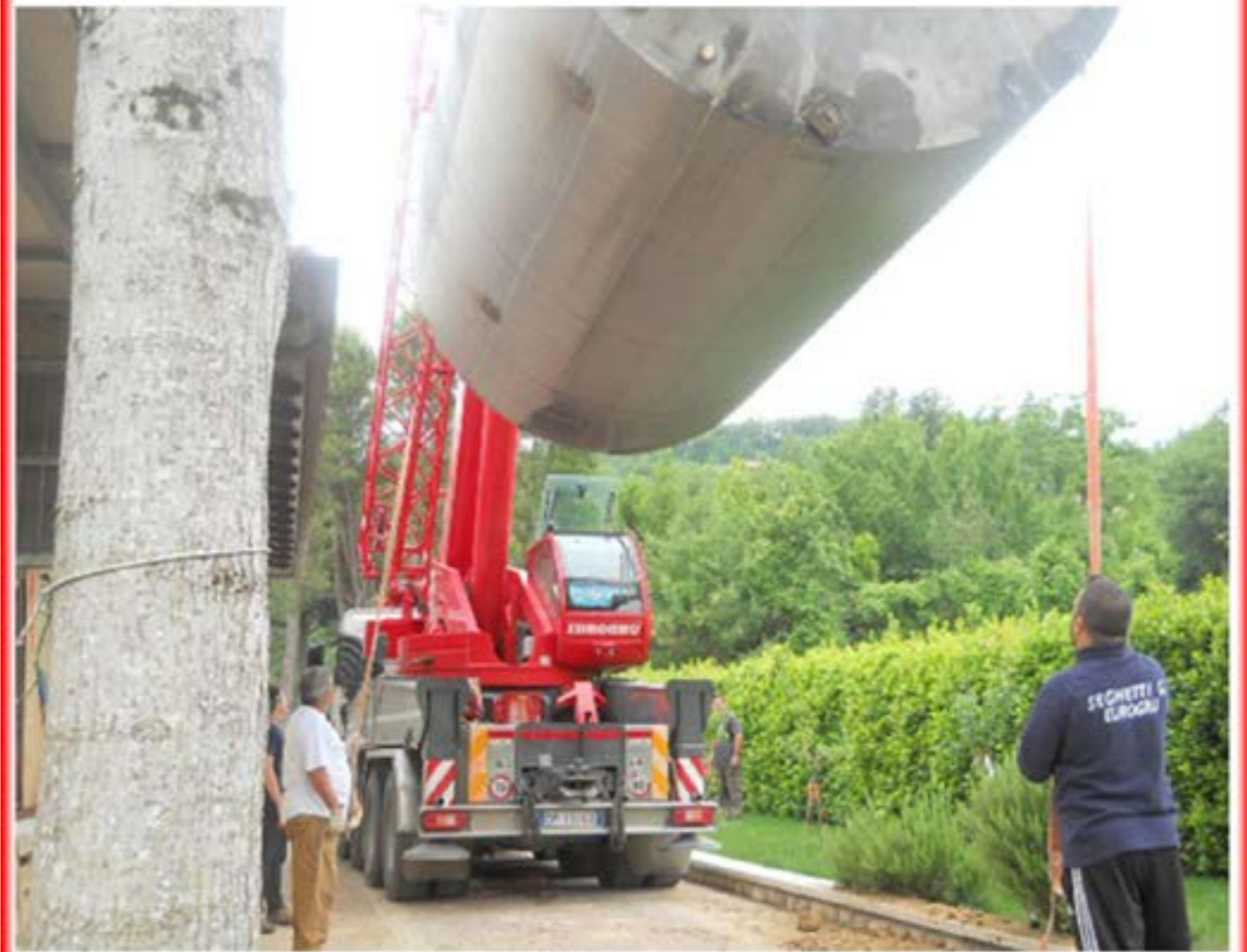
Posizionamento Cisterna - Autogru T150