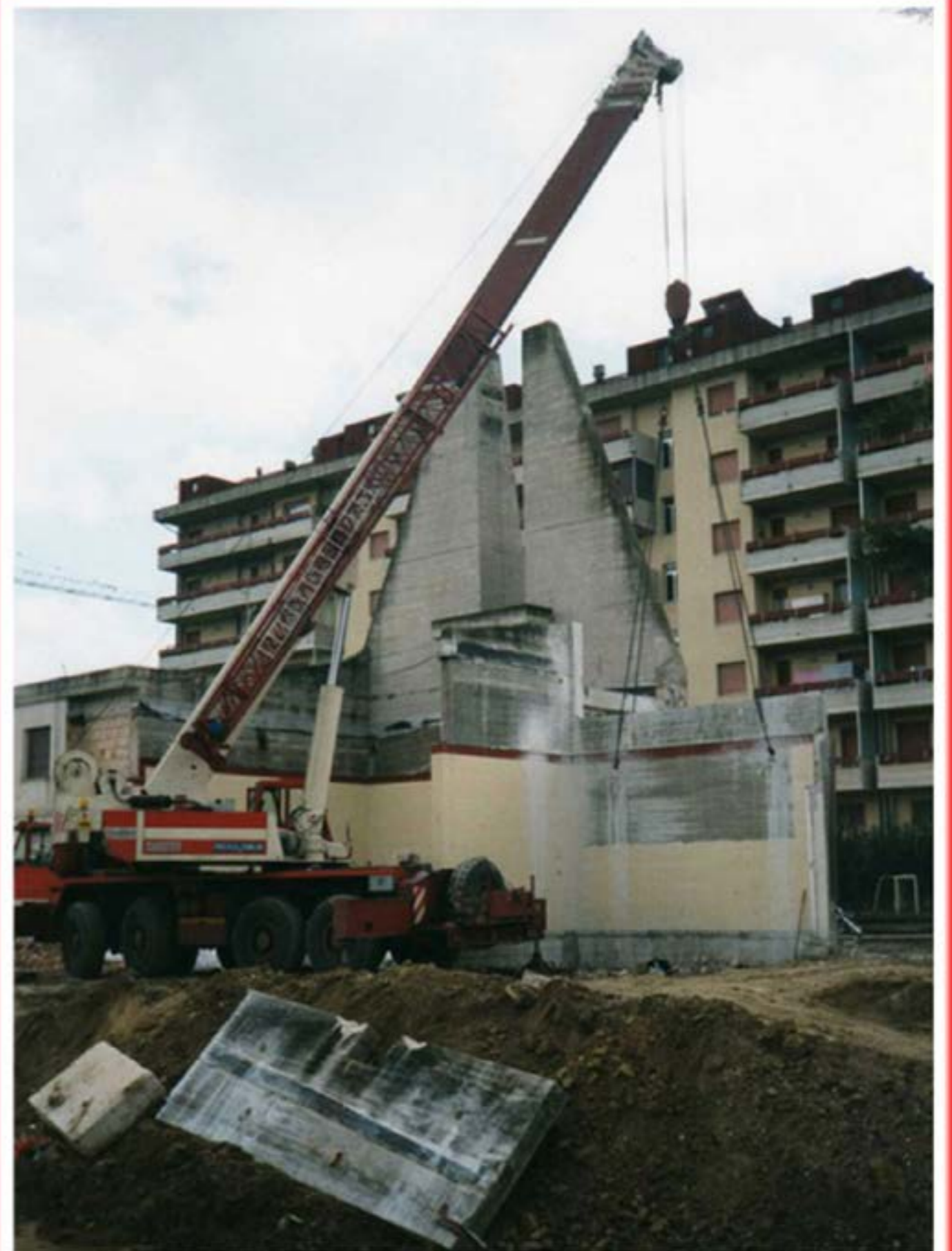
Demolizione chiesa Autogru T80