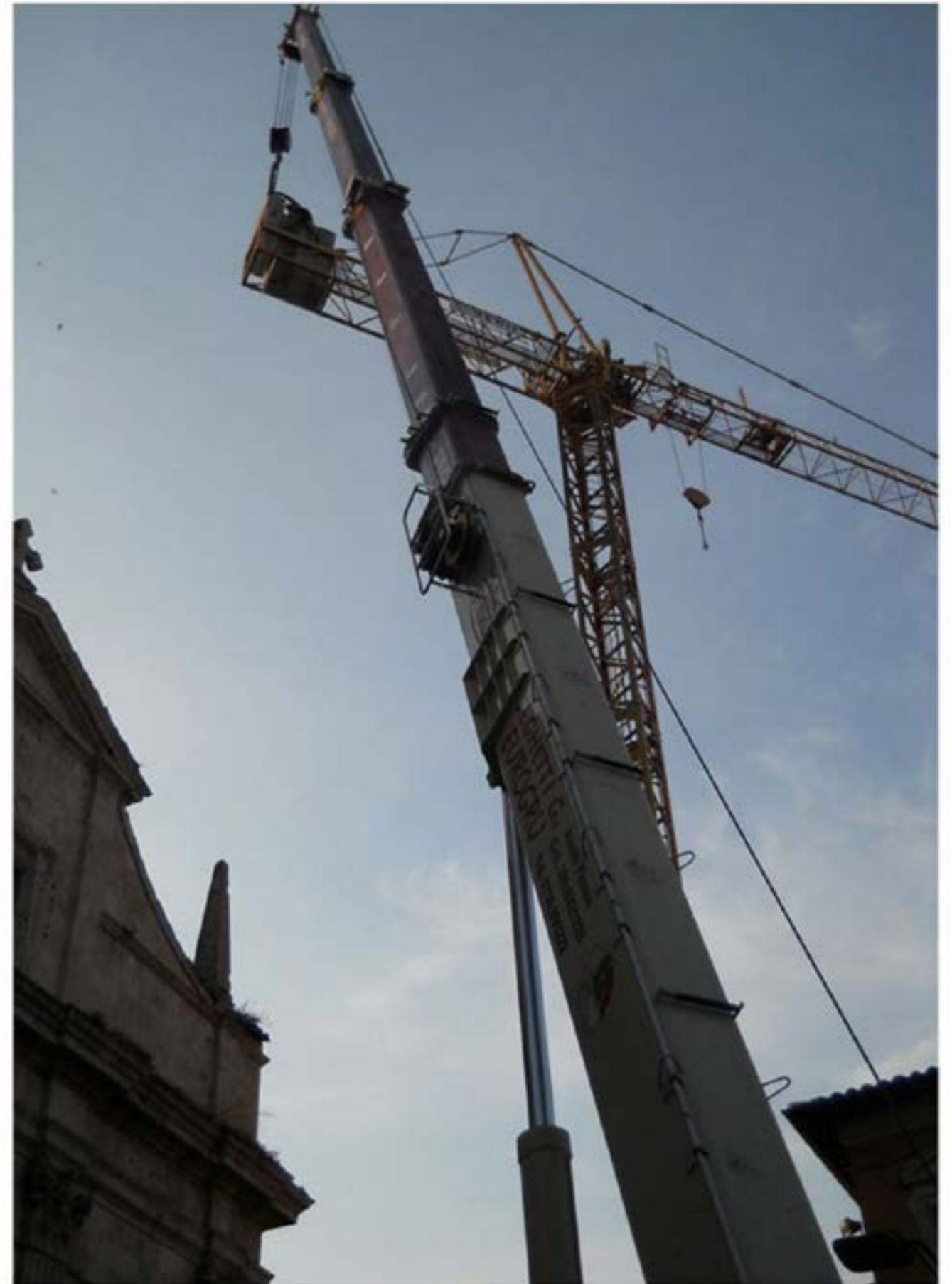
Montaggio gru Edile - autogru T120