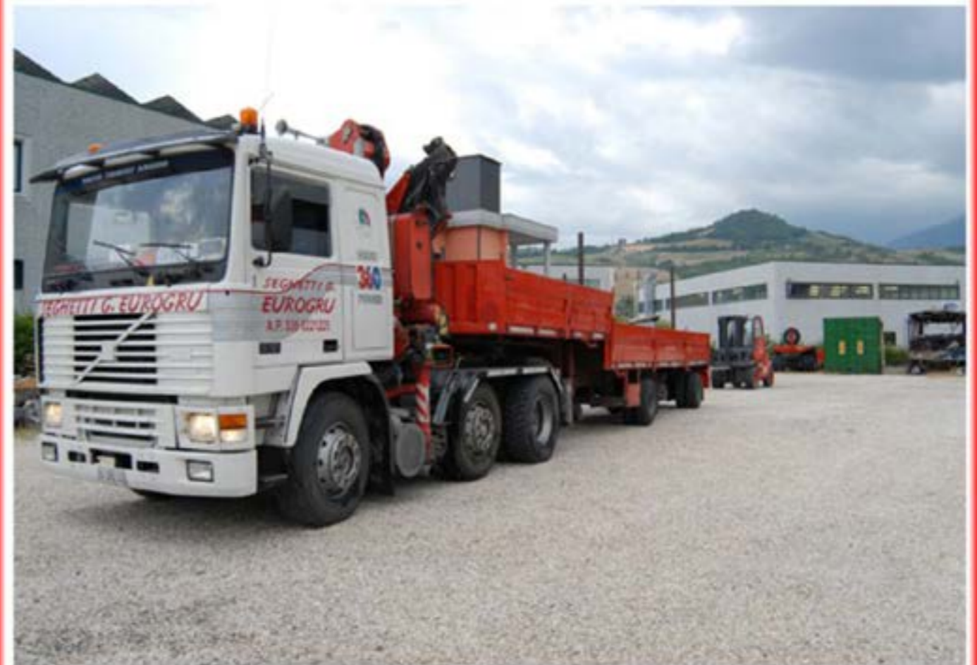
Volvo f12 con Geru - Trasporto Condizionatori