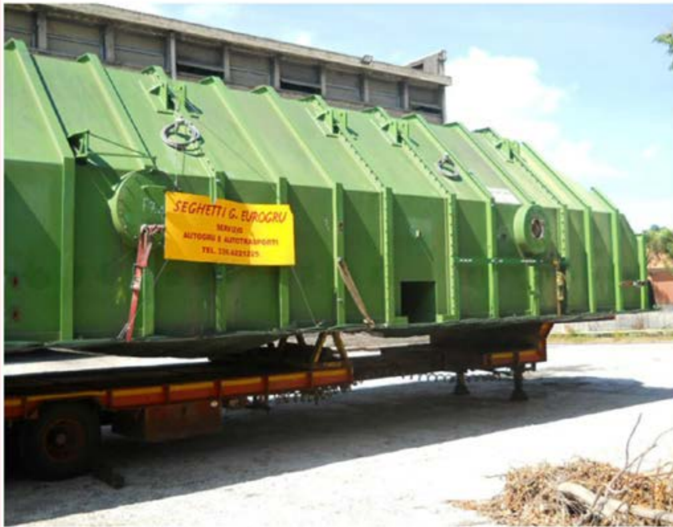
Man con Carrellone - Trasporto Forni