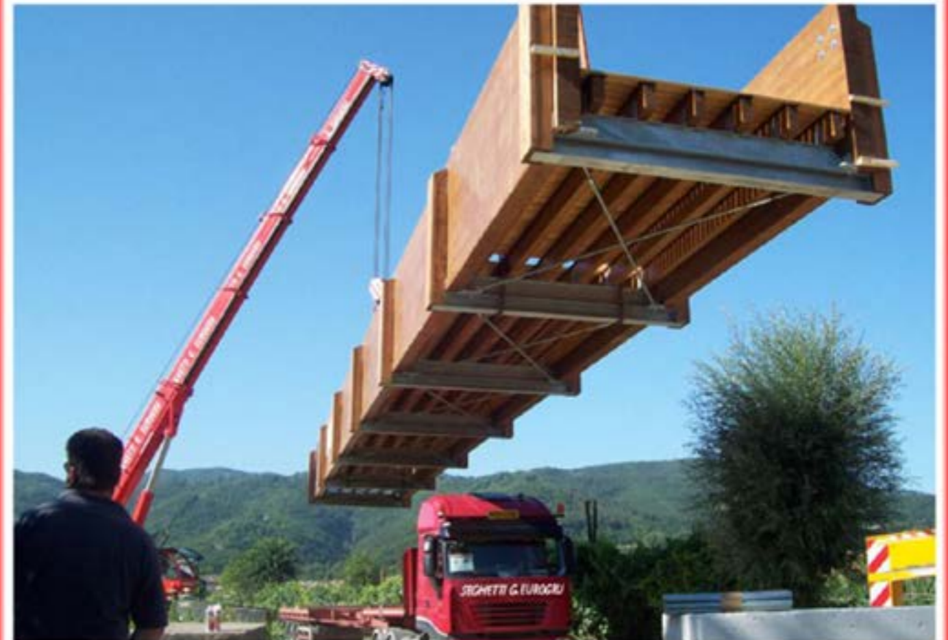
Montaggio e Trasporto Ponte Pista Ciclabile - Autogru T150

UNI EN ISO 9001:2008 Cert. N. 820711-07 UNI EN ISO 14001:2004 Cert. N. 820711-07