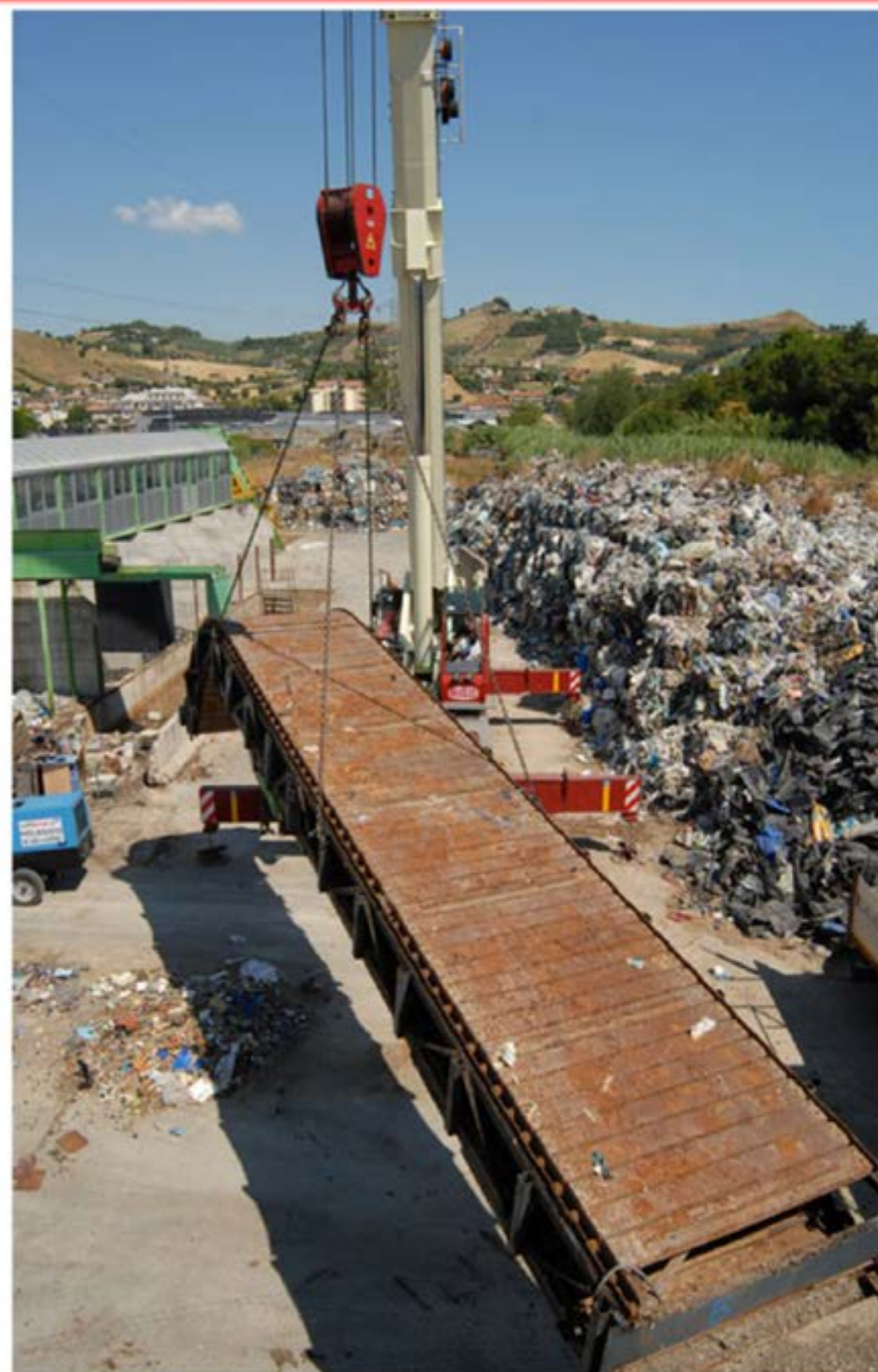
Smontaggio Piattaforma Ecologica - Autogru T120