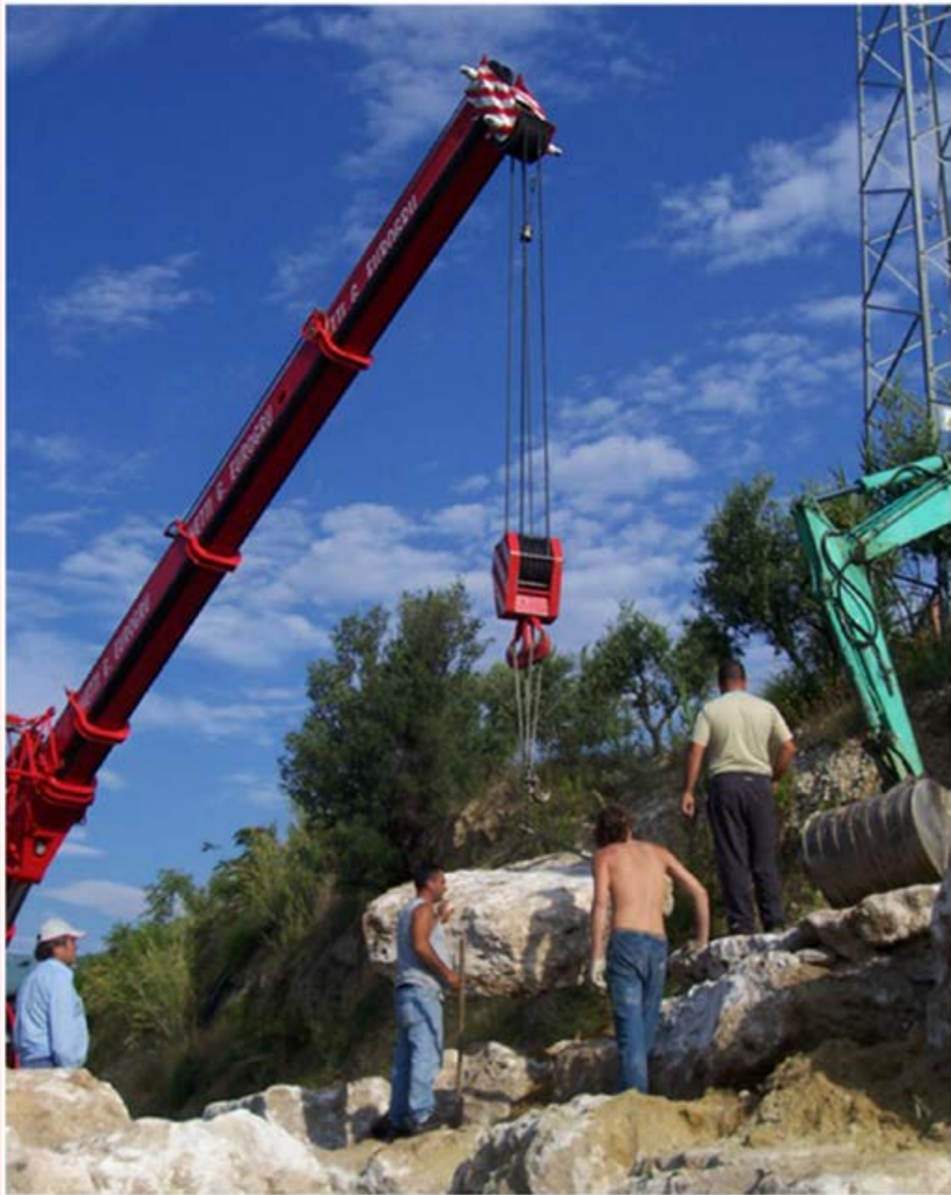
Costruzione muro in pietre Autogru T150