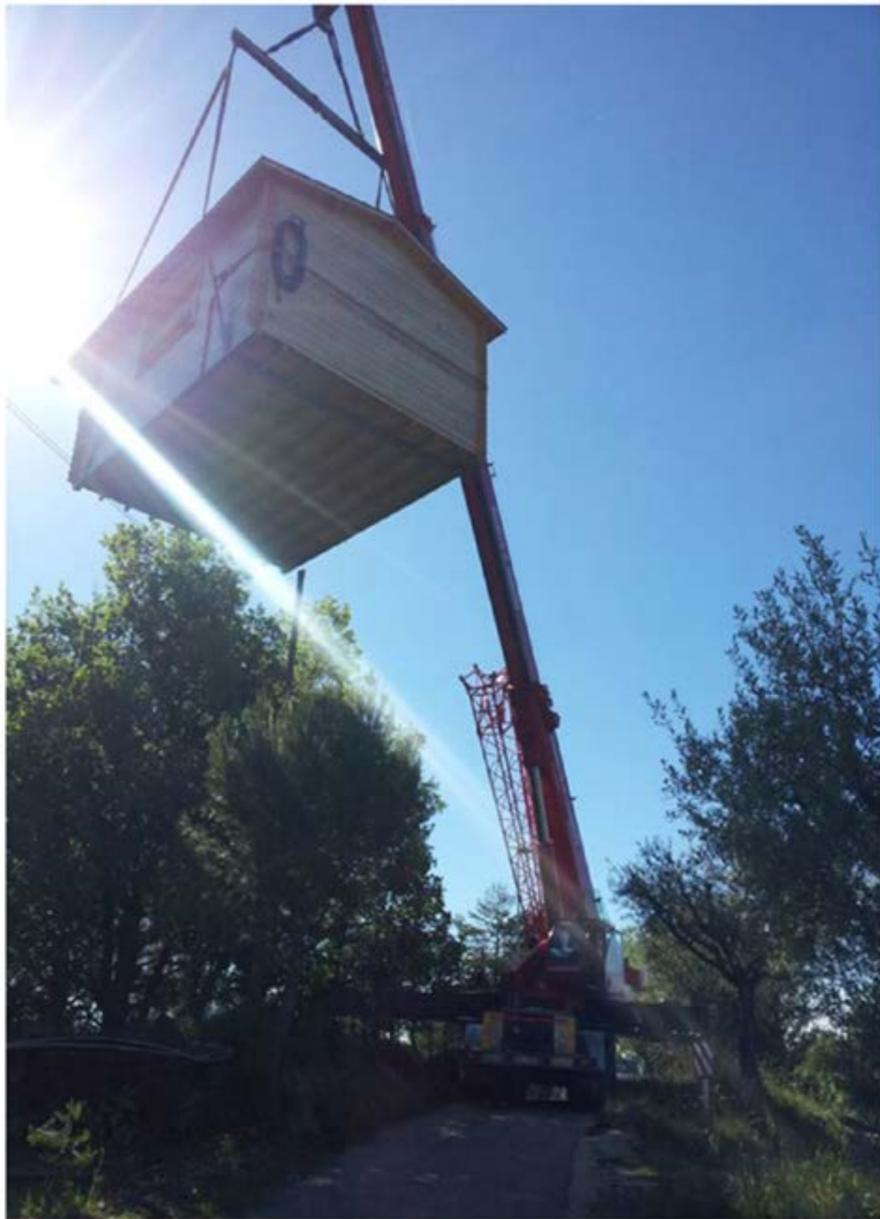
Idrogru T.150 - Spostamento Casetta Prefabbricata