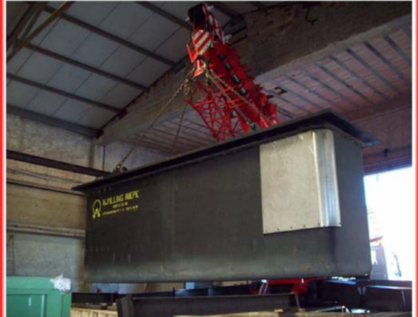
Posizionamento vasca Autogru T150