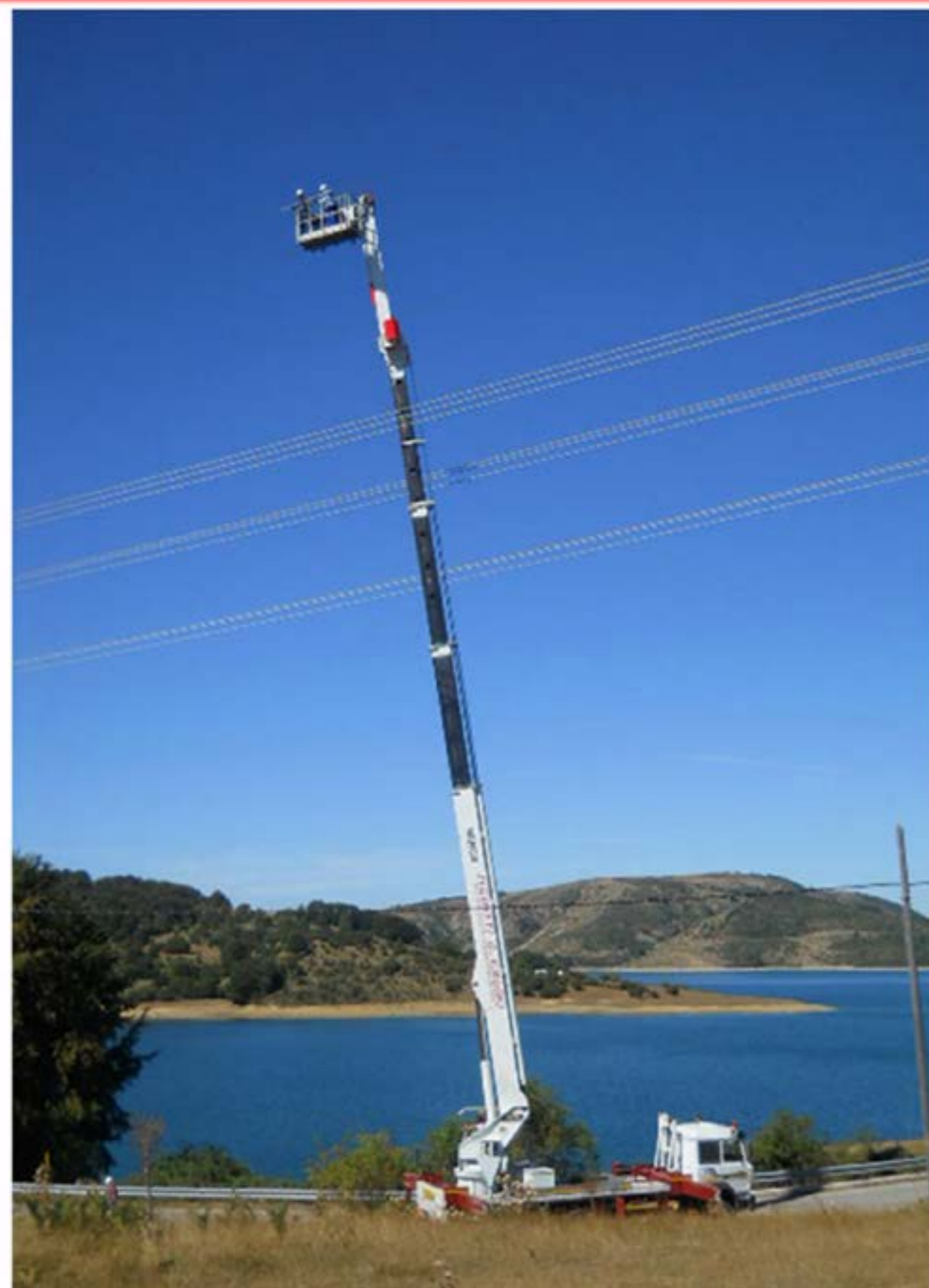
Riparazione Cavo alta Tensione Piattaforma MT46