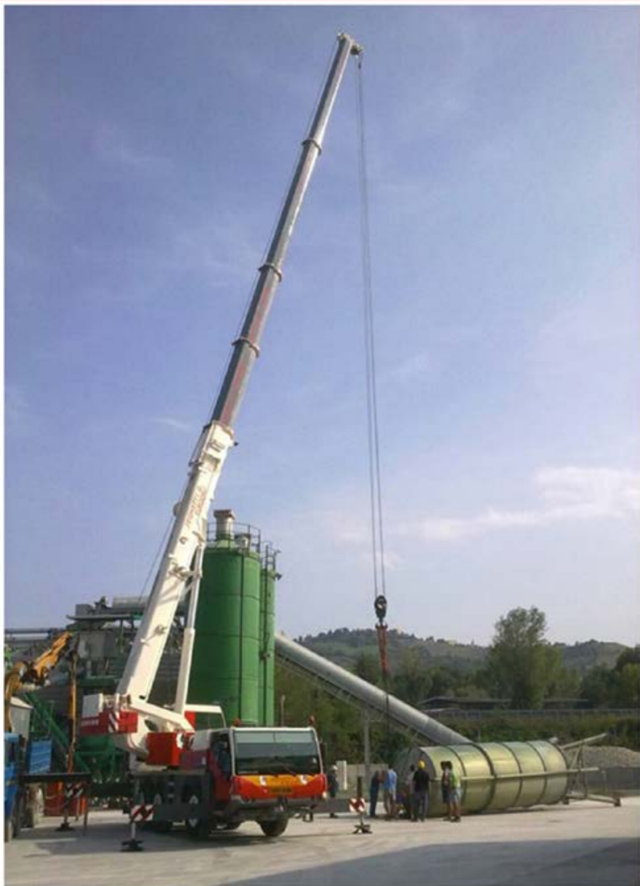
Autogru T.55 - Sollevamento Silos Impianto Calcestruzzi