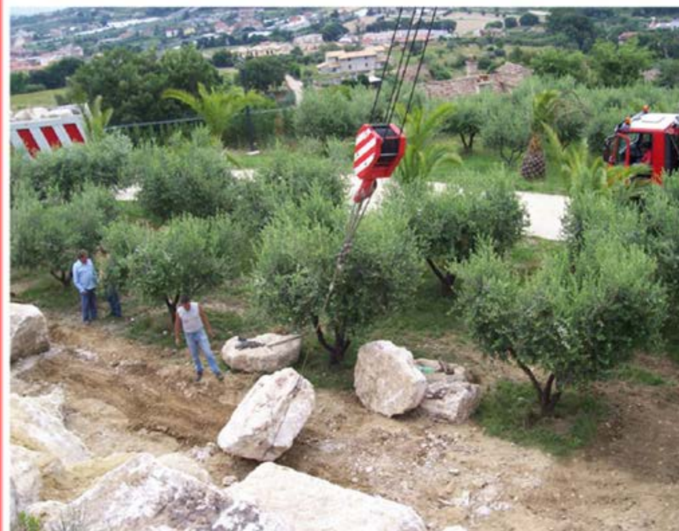
Costruzione muro in pietre Autogru T150