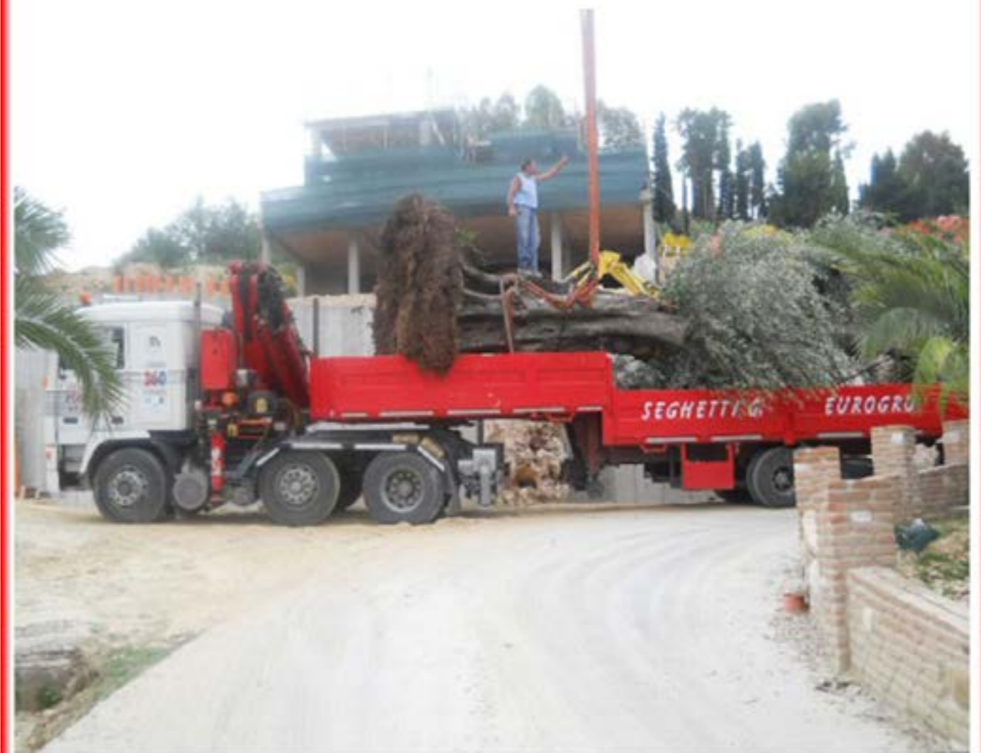
Volvo F12 con gru + carrellone - trasporto piante ulivo