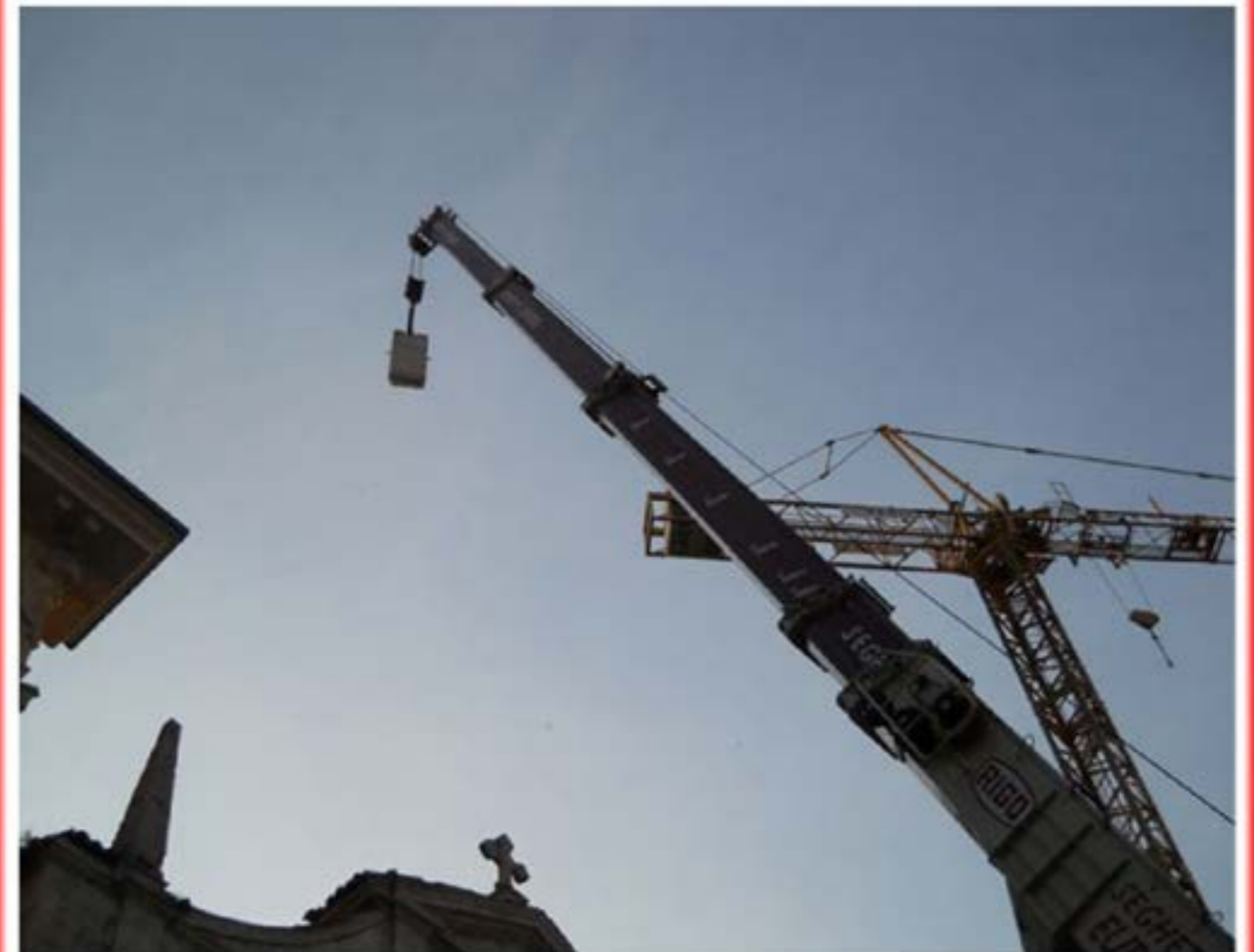
Montaggio gru Edile - autogru T120

UNI EN ISO 9001:2008 Cert. N. 810711.07 UNI EN ISO 14001:2004 Cert. N. 810711.07