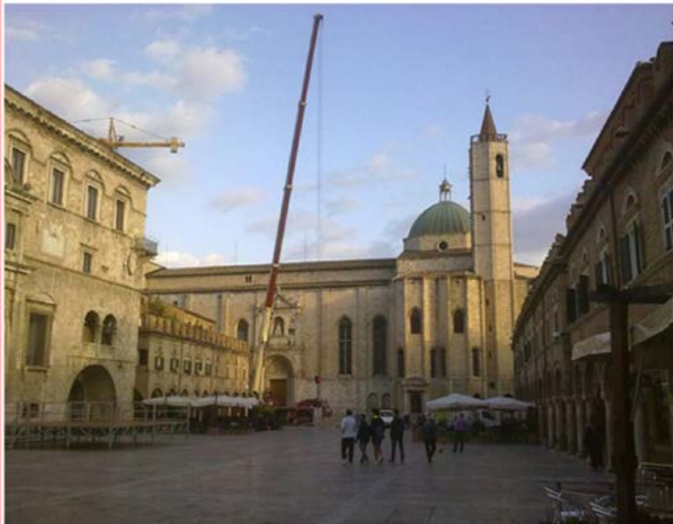
Autogru T.120 - Montaggio Gru Edile - Piazza del Popolo AP