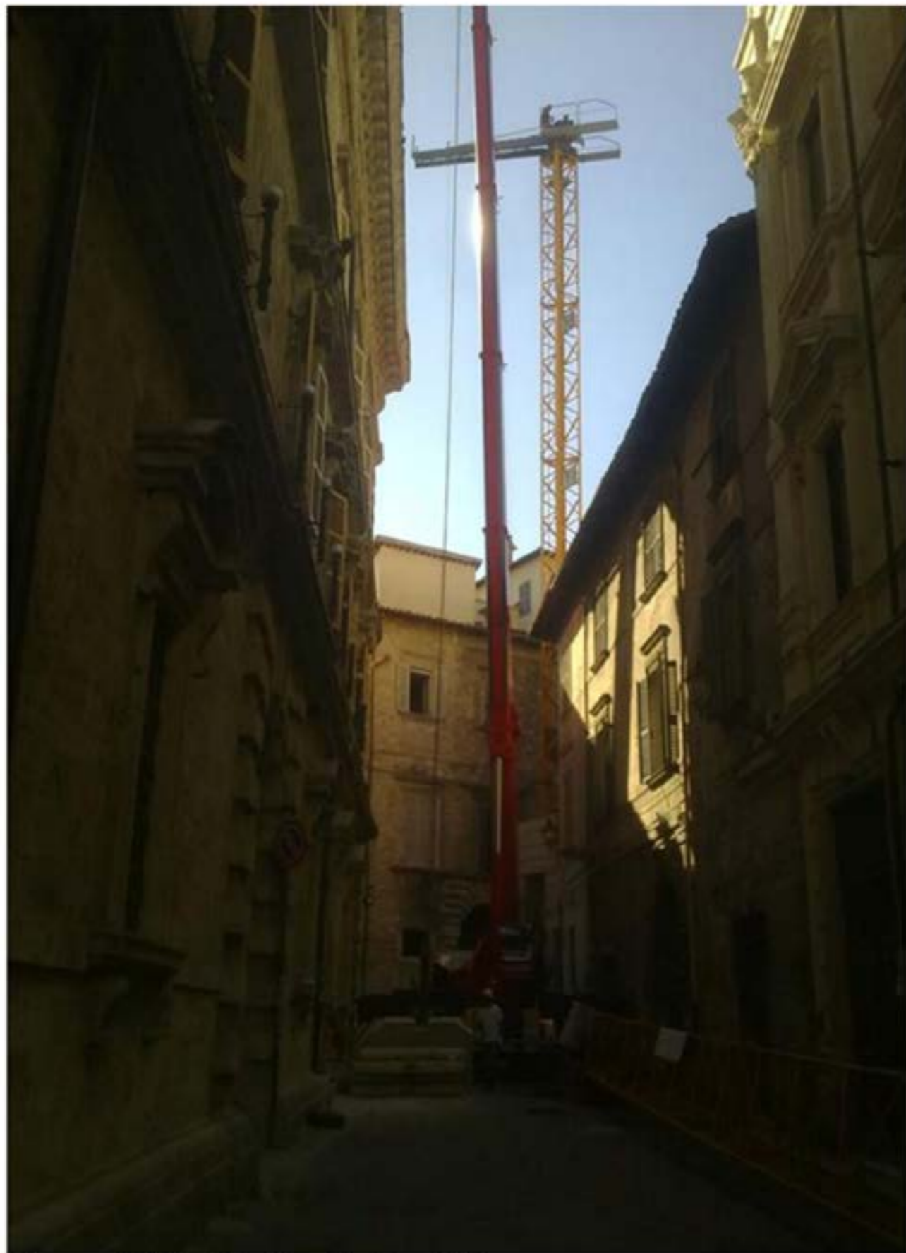
Idrogru T.150 - Montaggio Gru Edile