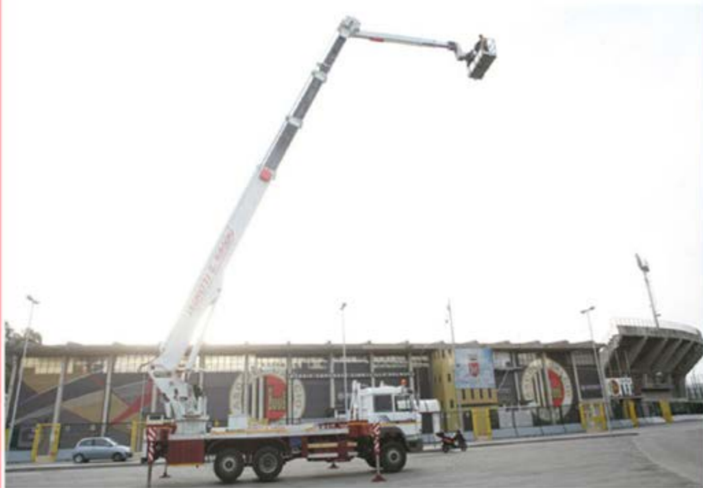
Reportage Fotografico Stadio - Piattaforma MT46