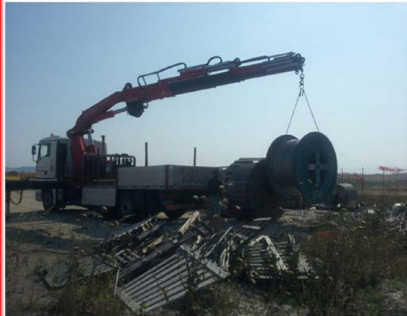
Man con Gru - Scarico Bobine