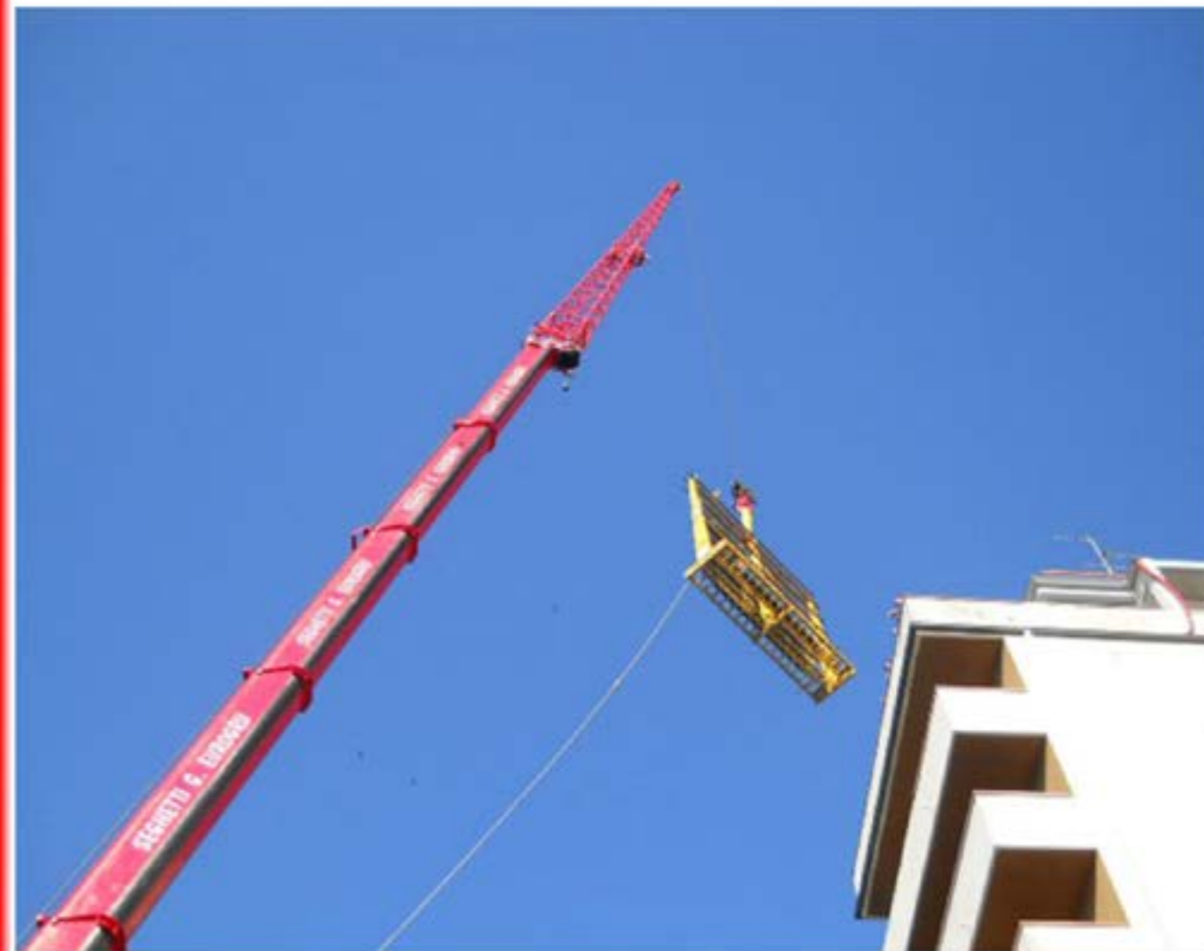
Sollevamento Materiali edili Autogru T150