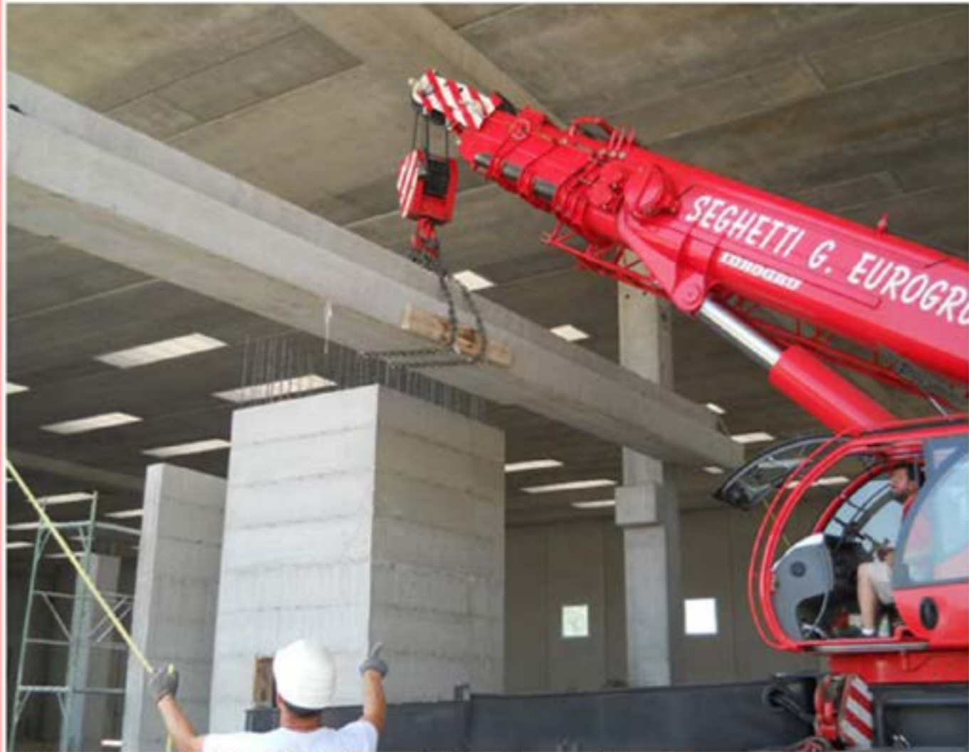
Montaggio prefabbricati - Autogru T150 e Man con Gru