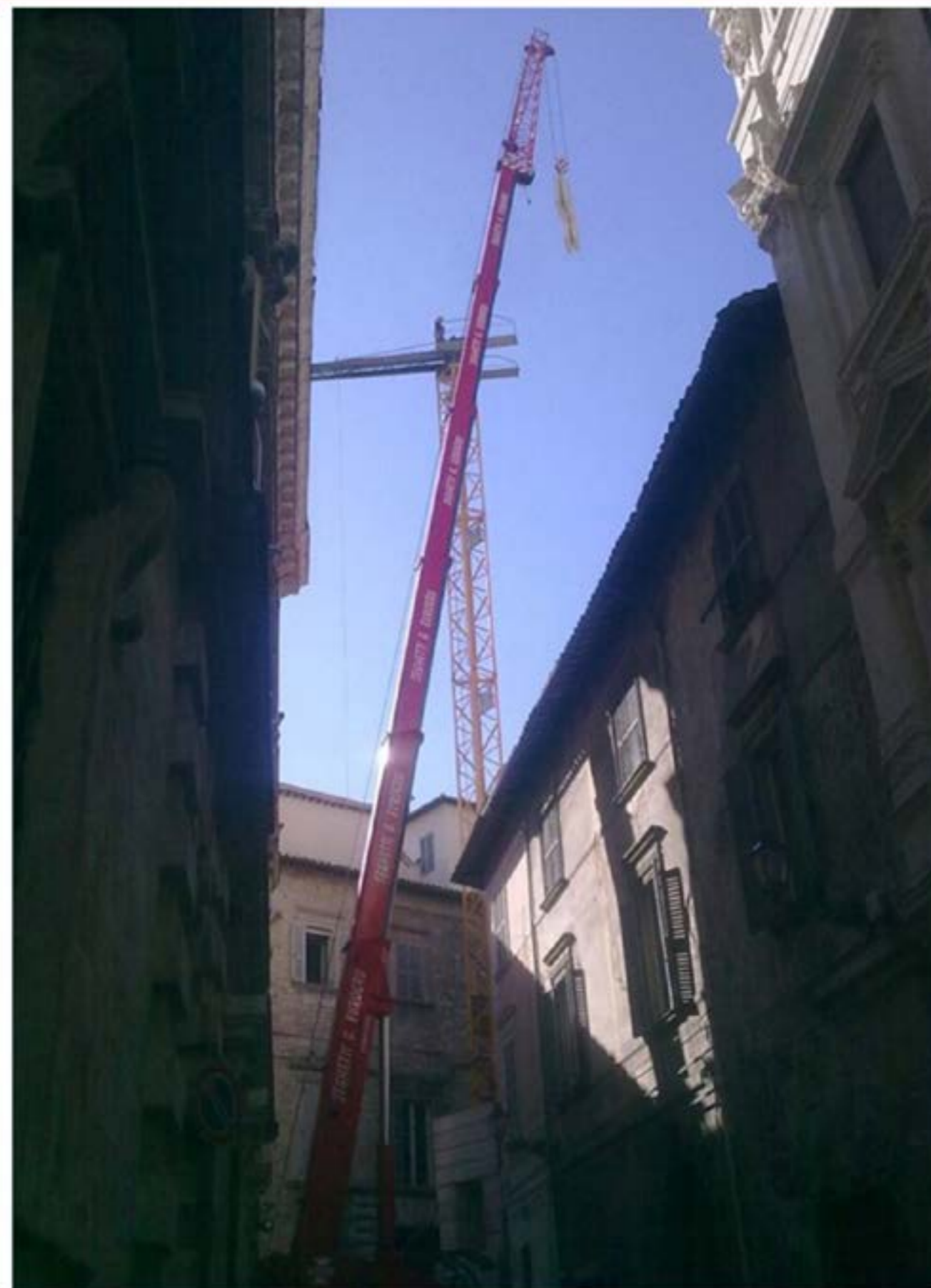
Idrogru T.150 - Montaggio Gru Edile

UNI EN ISO 9001:2008 Cert. N. 810711.07 UNI EN ISO 14001:2004 Cert. N. 810711.07