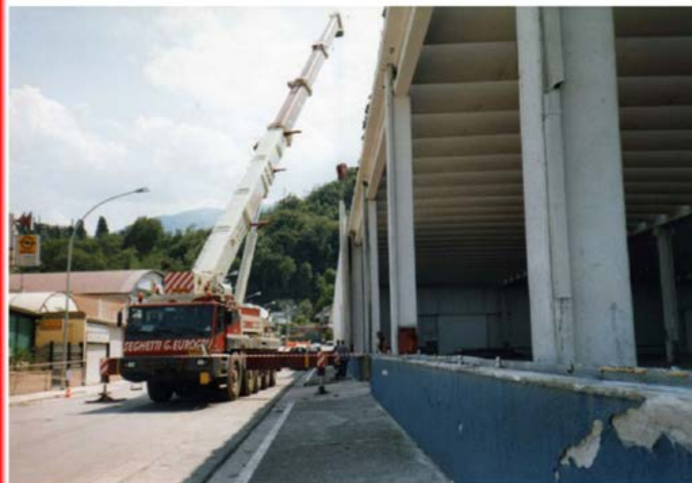
Smontaggio Prefabbricati Autogru T120