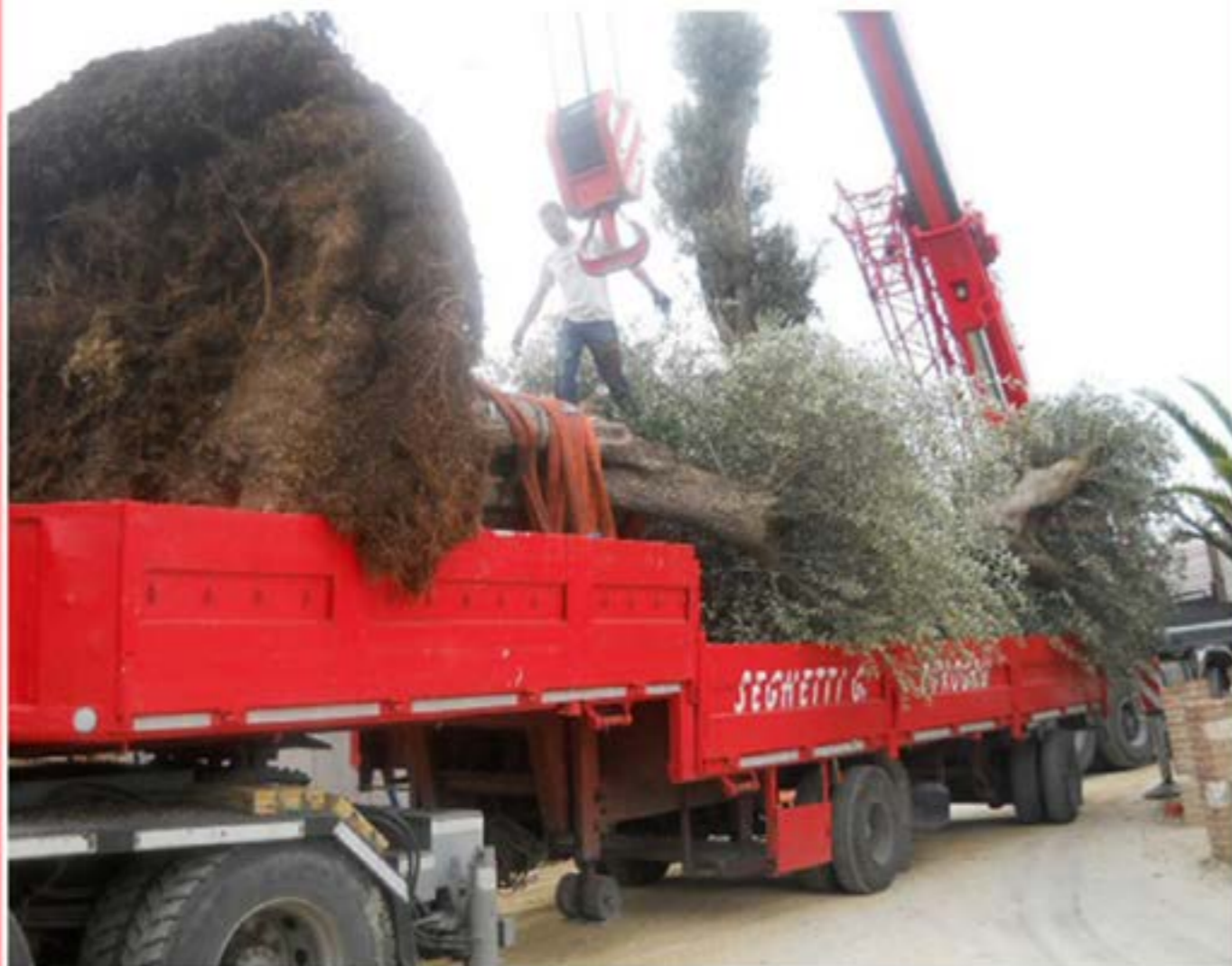
Volvo F12 con gru per carrellone - trasporto piante ulivo