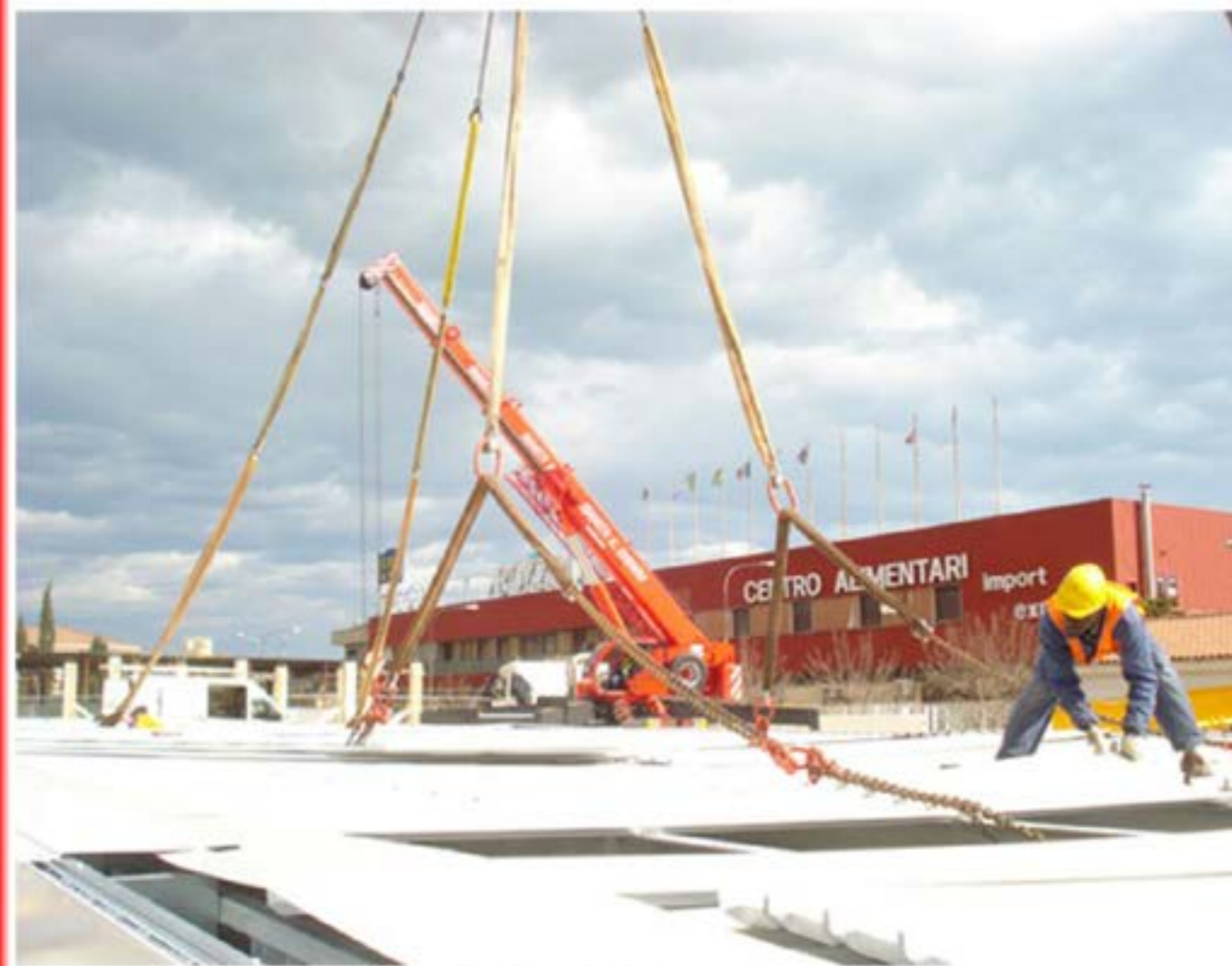
Montaggio Area di Servizio - Autogru T150