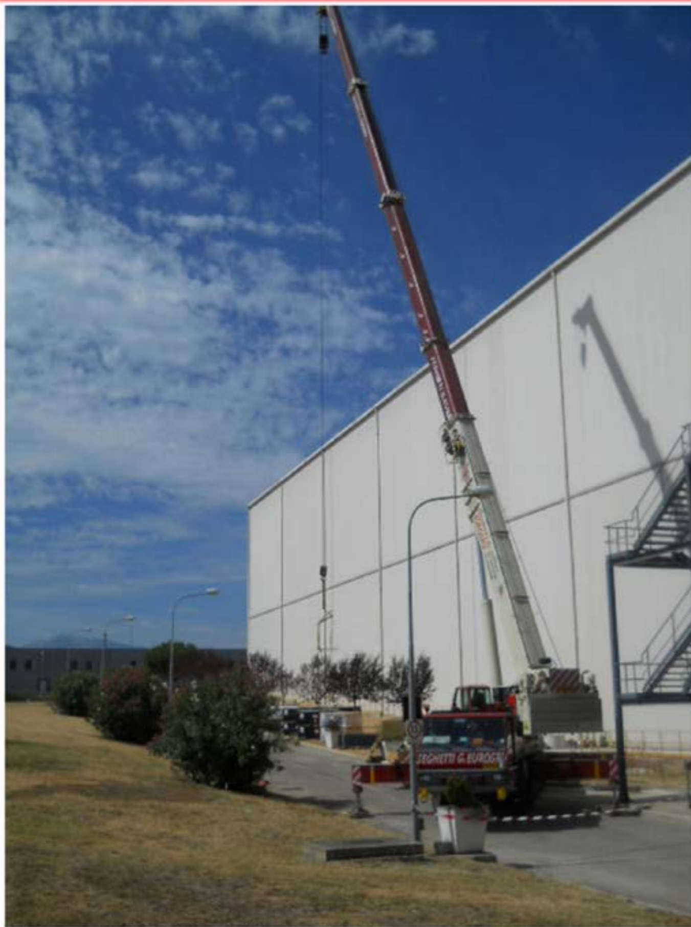
Sollevamento Pannelli solari Autogru T120