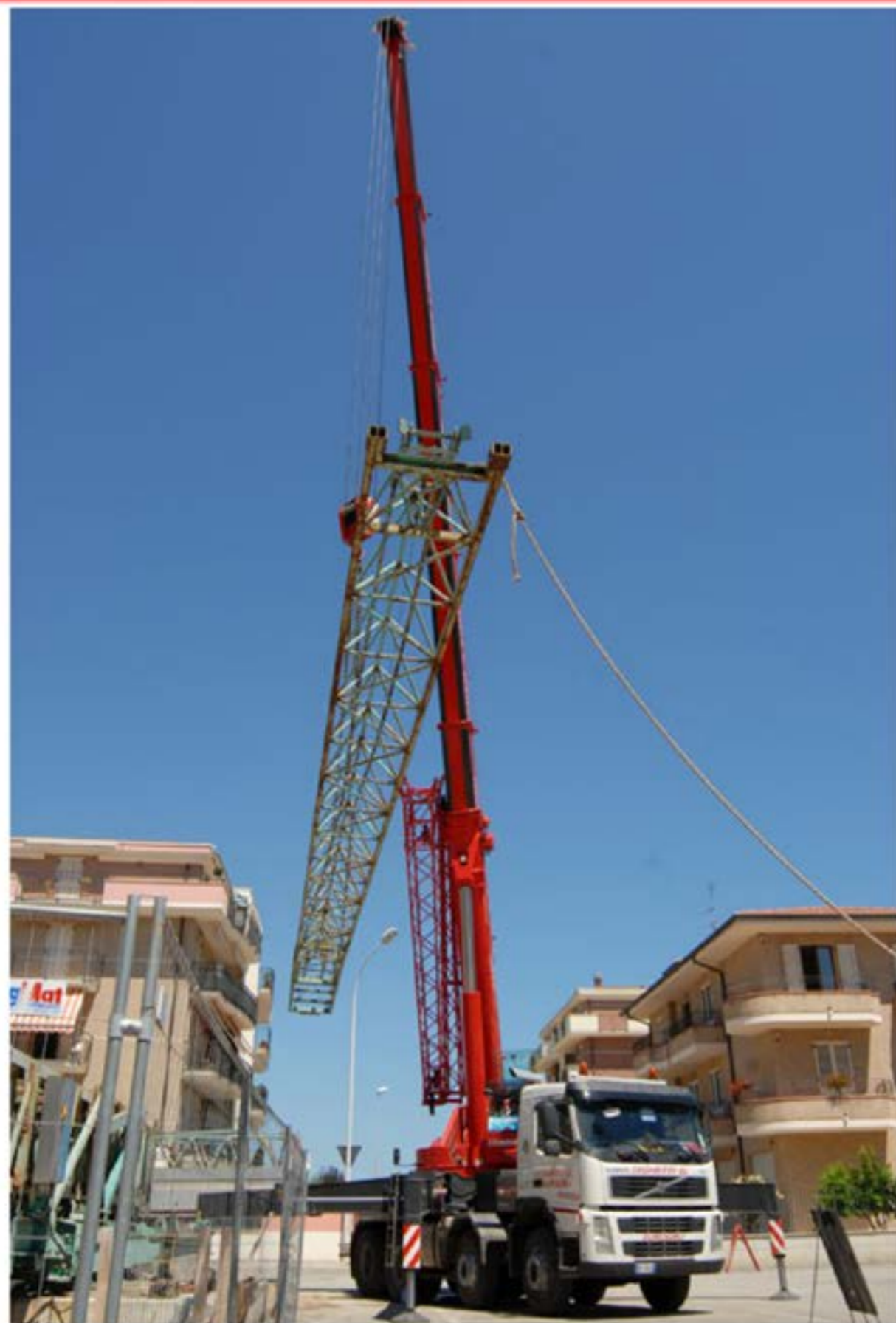
Smontaggio Gru Edile Autogru T150