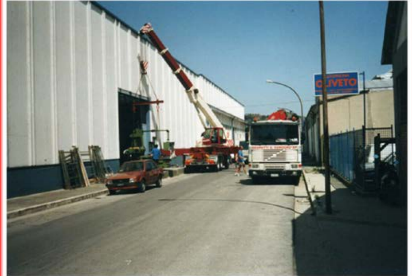
Scarico Macchinari Autogru T60