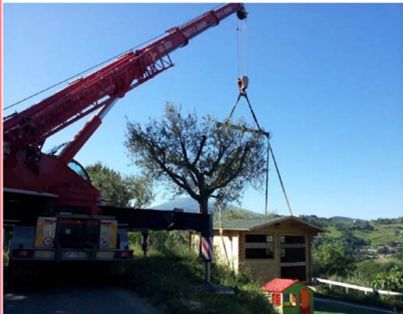
Idrogru T.150 - Posizionamento Casetta Prefabbricata