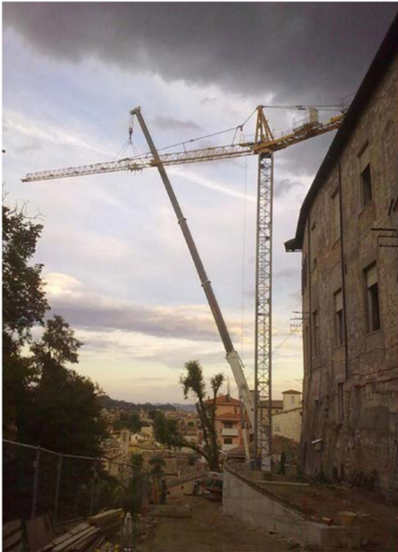
Autogru T.55 - Montaggio Gru Edile