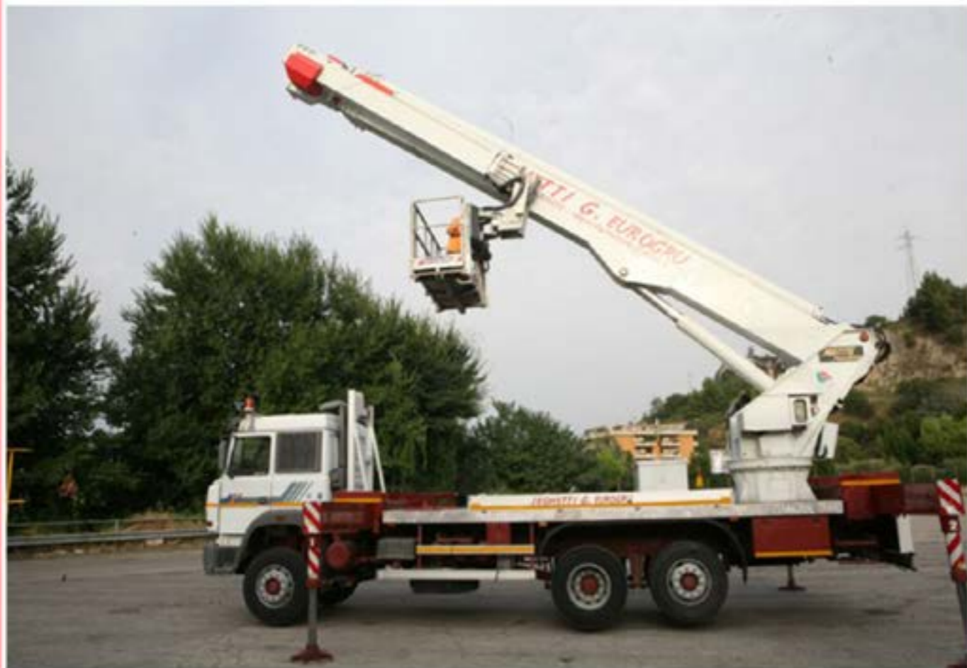
Reportage Fotografico Stadio - Piattaforma MT46