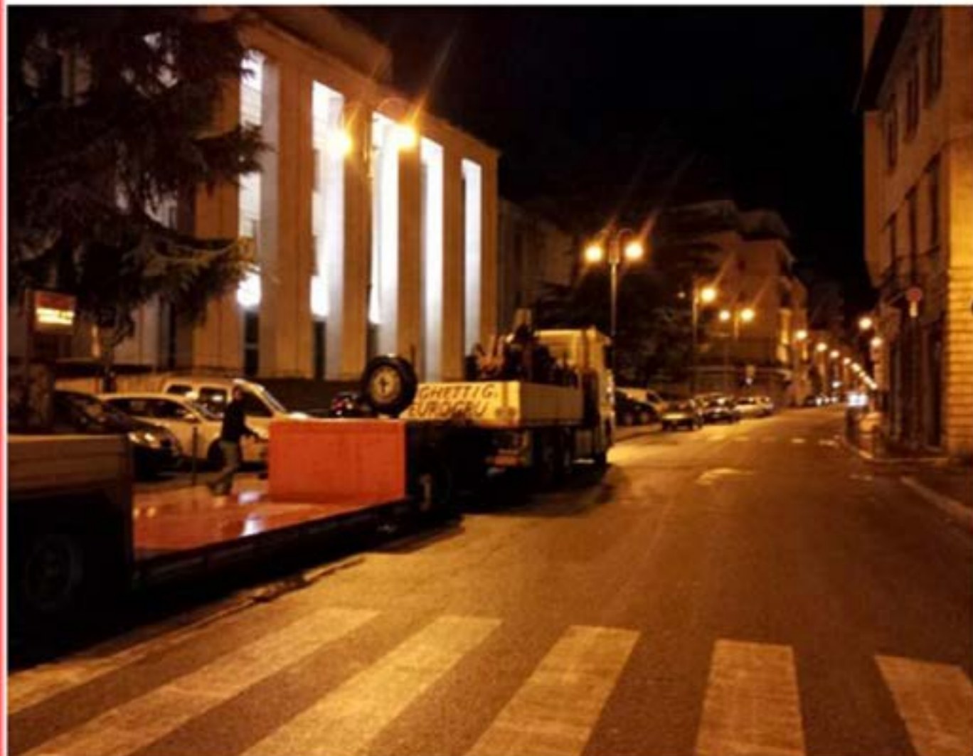
Man con Gru + Carrellone Ribassato