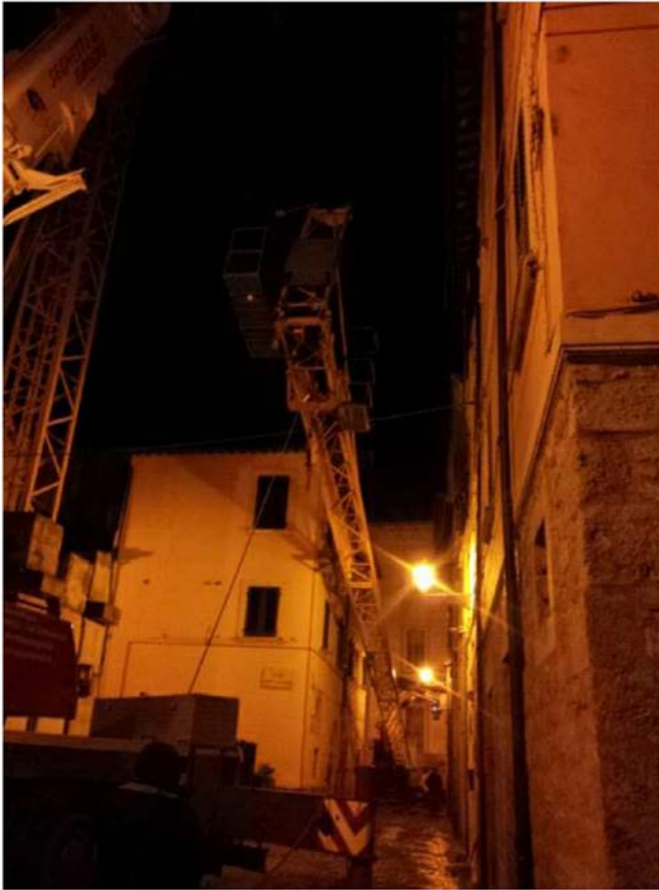
Autogru T.55 - Montaggio Gru Edile