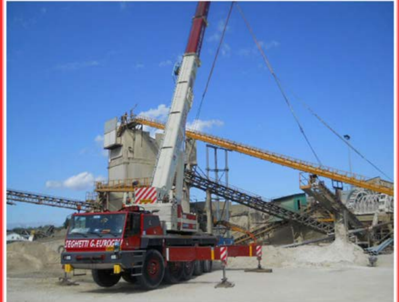
Montaggio impianto calcestruzzo Autogru T120