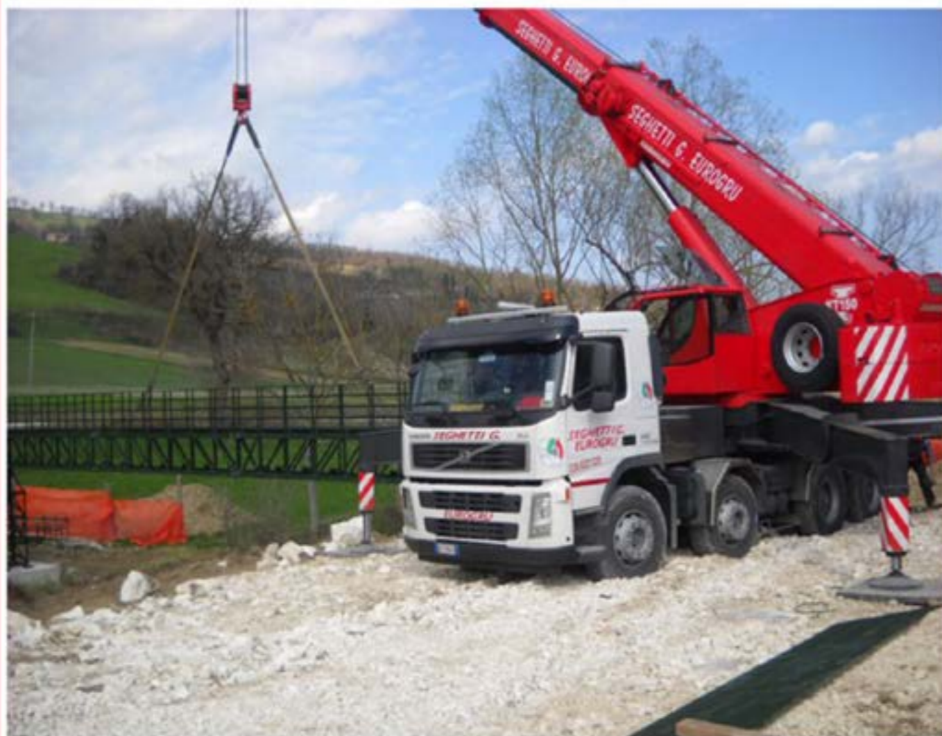
Posizionamento ponte Autogru T150