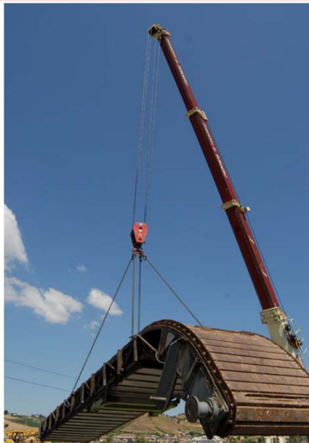
Smontaggio Piattaforma Ecologica - Autogru T120

UNI EN ISO 9001:2008 Cert. N. 820711-07 UNI EN ISO 14001:2004 Cert. N. 820711-07