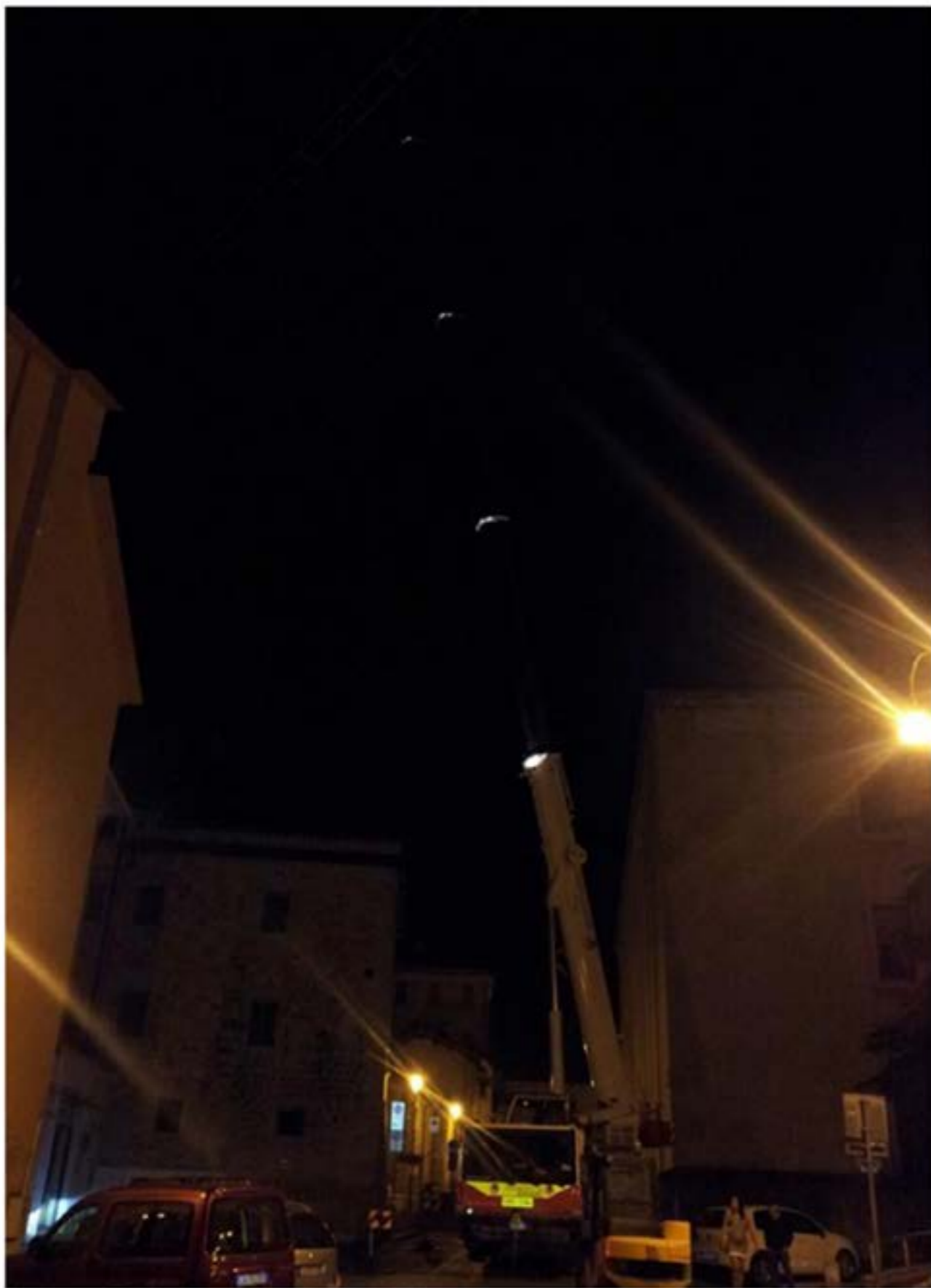
Autogru T.55 - Smontaggio Gru Edile