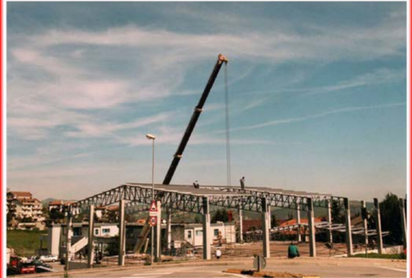
Montaggio palazzetto dello sport Autogru T120