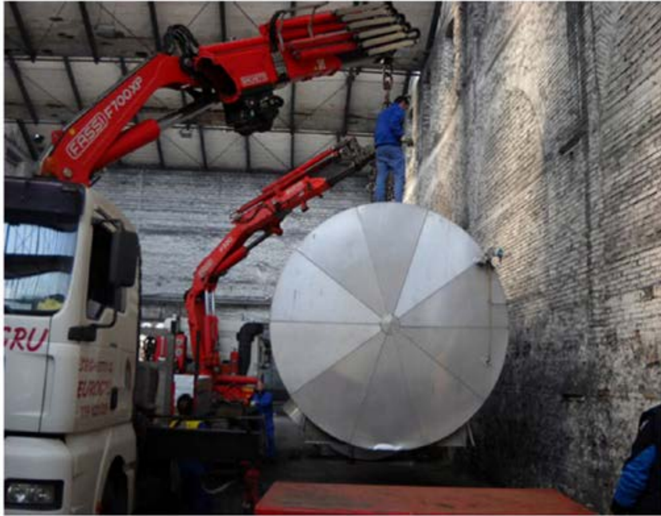
Scarico caldaia Man con gru e volvo con gru