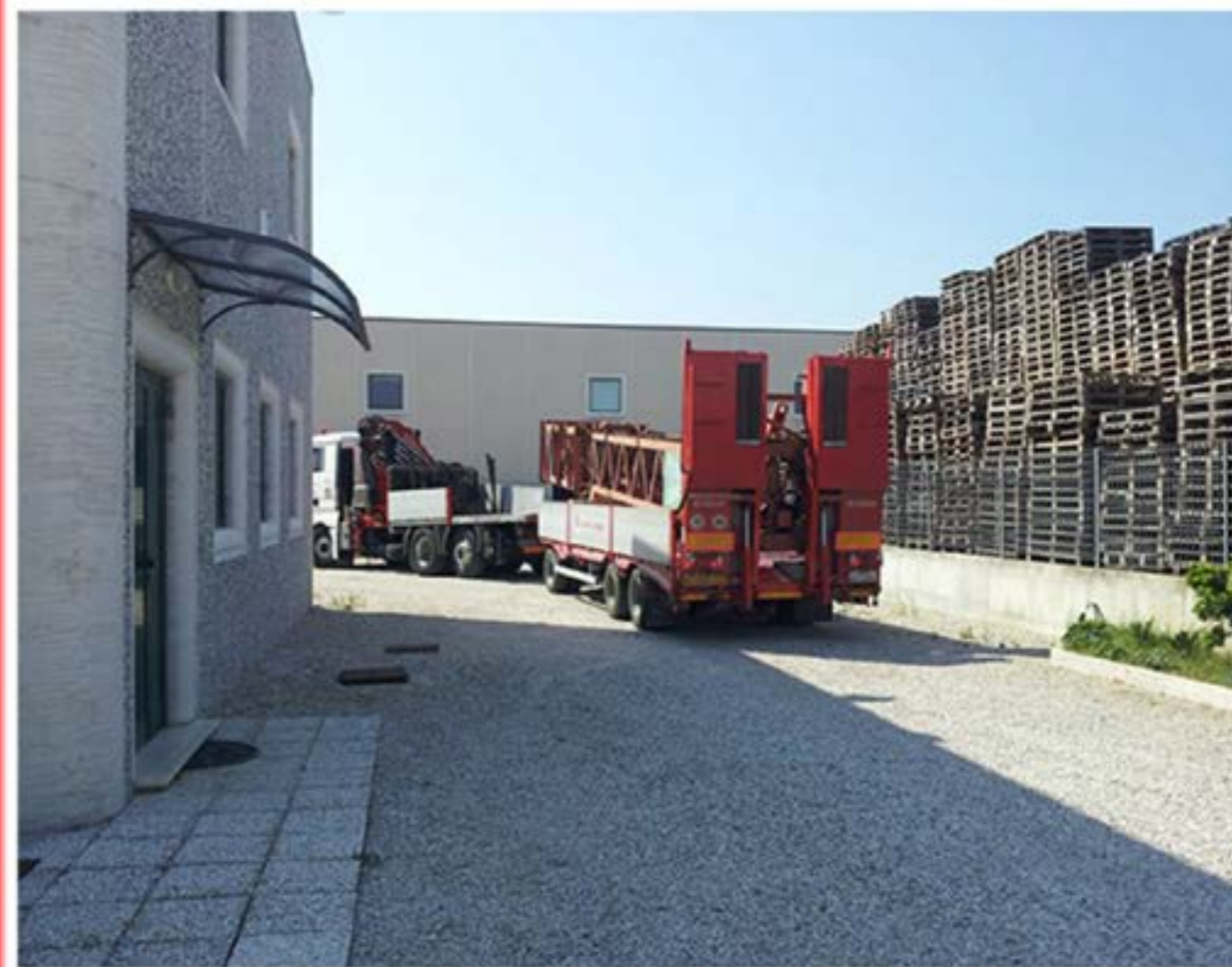
Man con Gru - Trasporto Gru Edile