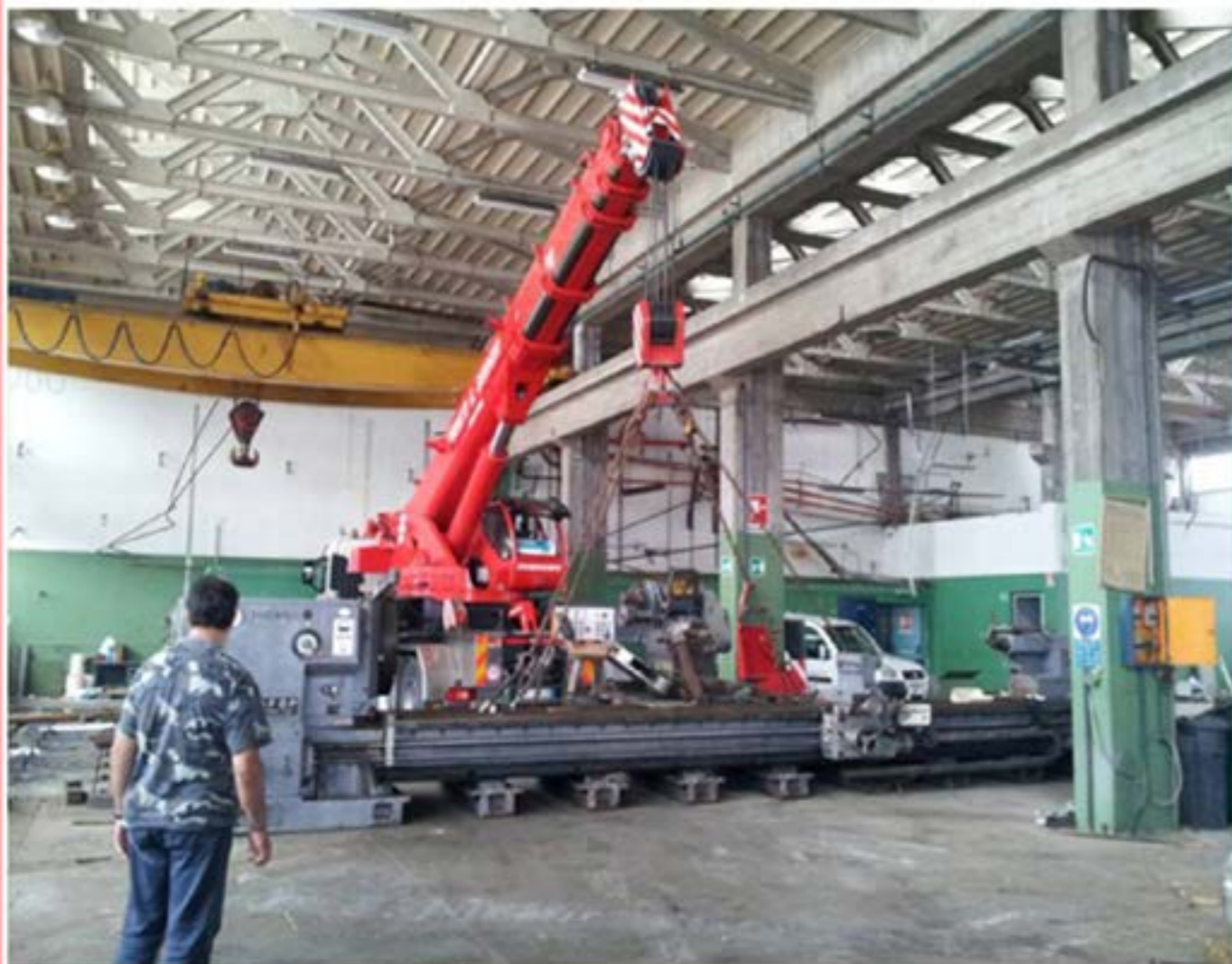
Idrogru T.55 -Spostamento Macchinari