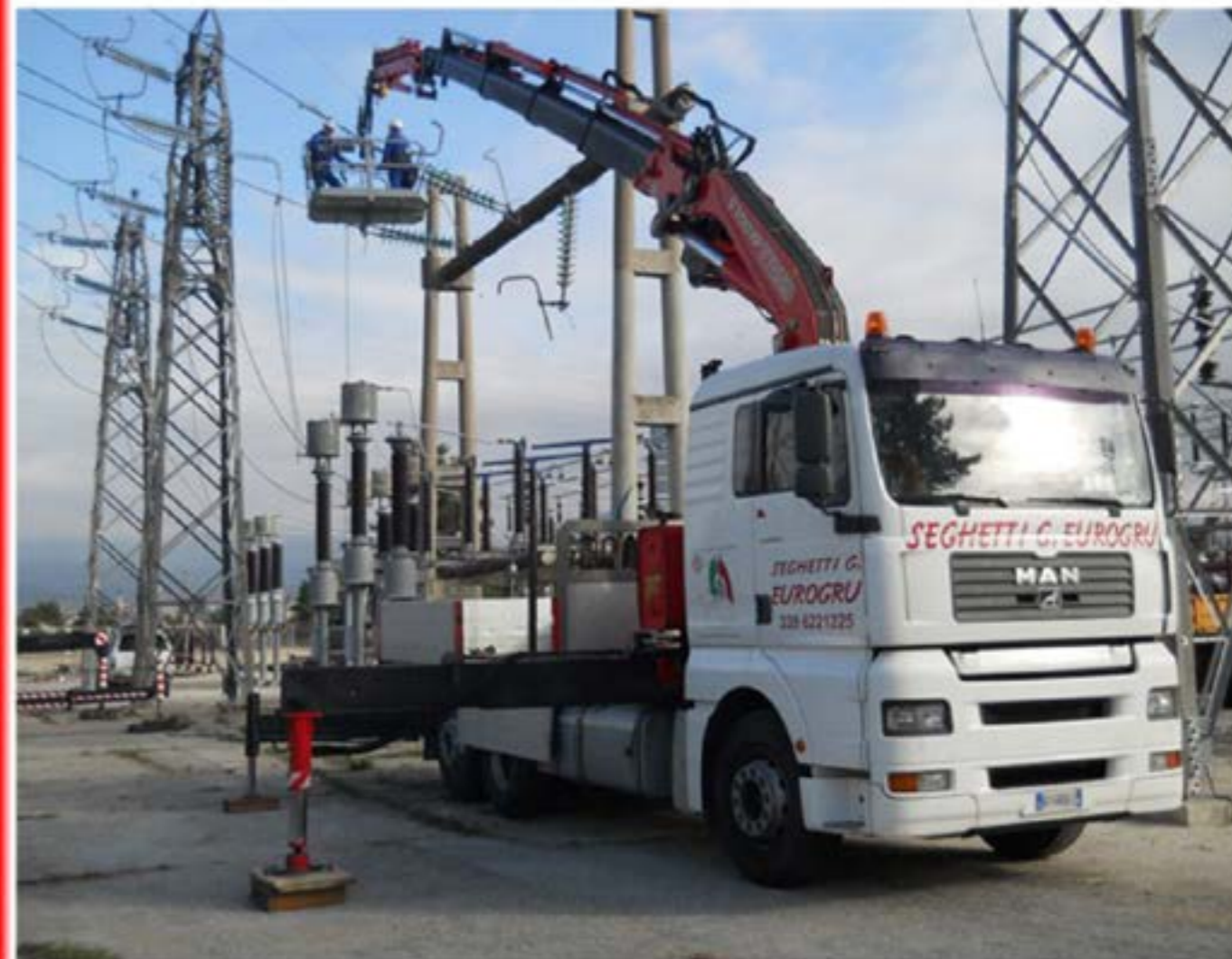
Man con piattaforma Sistemazione S.E.