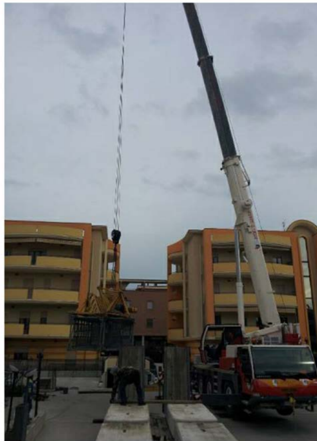
Autogru T.55 - Carico Gru Edile