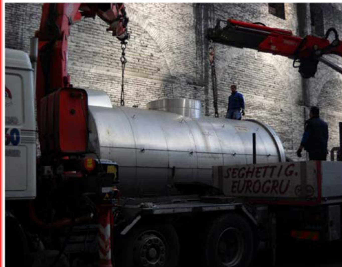
Trasporto Caldaie man con gru e carrellone