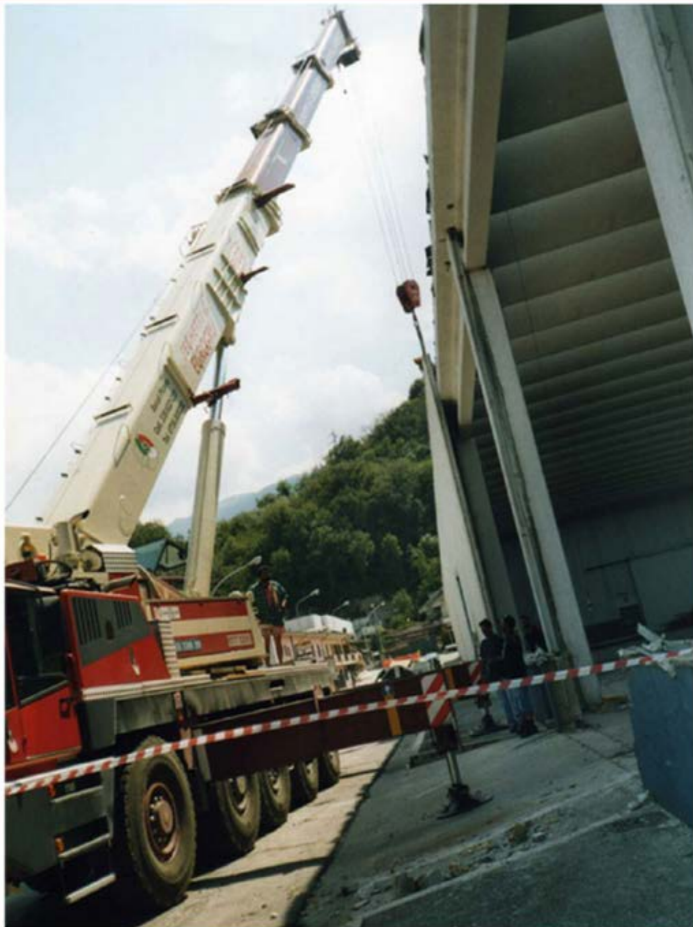
Smontaggio Prefabbricati Autogru T120