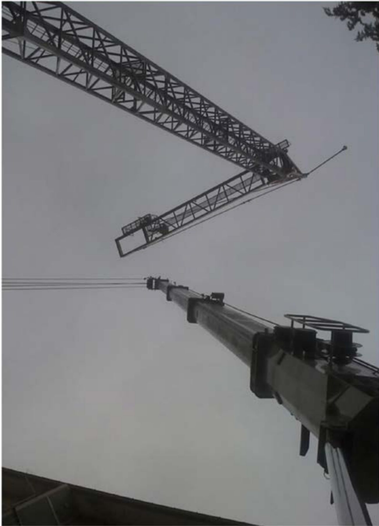
Montaggio gru Edile - autogru T120