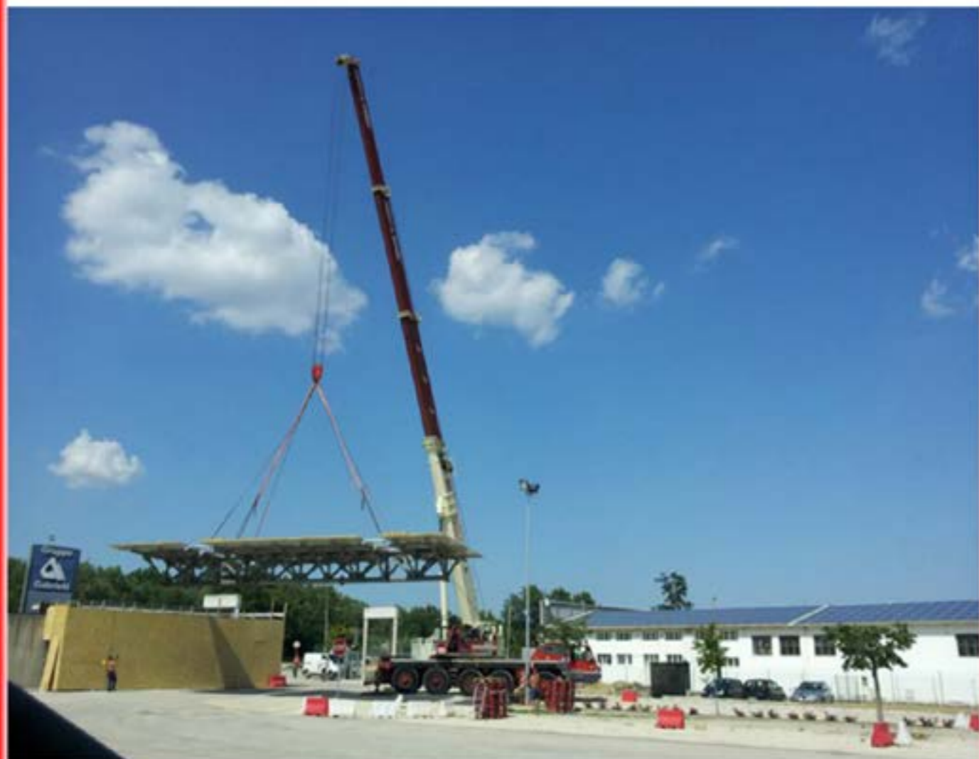
Autogru T.120 - Montaggio Pensilina