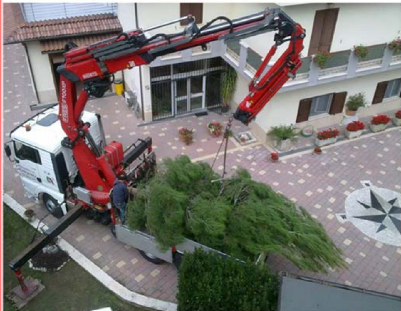
Man con Gru - Carico Piante