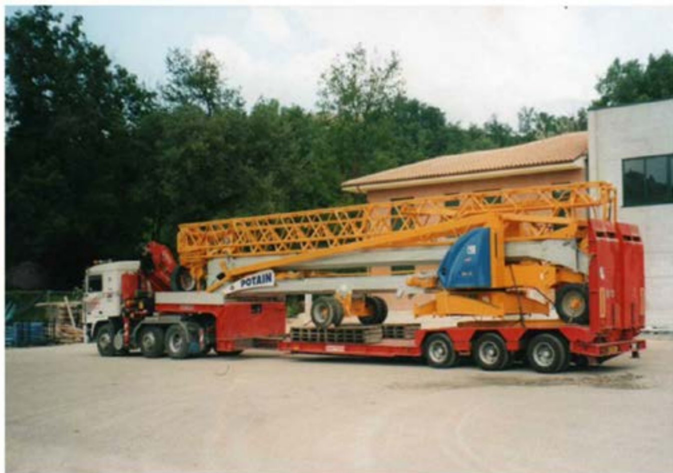
Volvo F12 con gru + carrellone Trasporto gru Edile