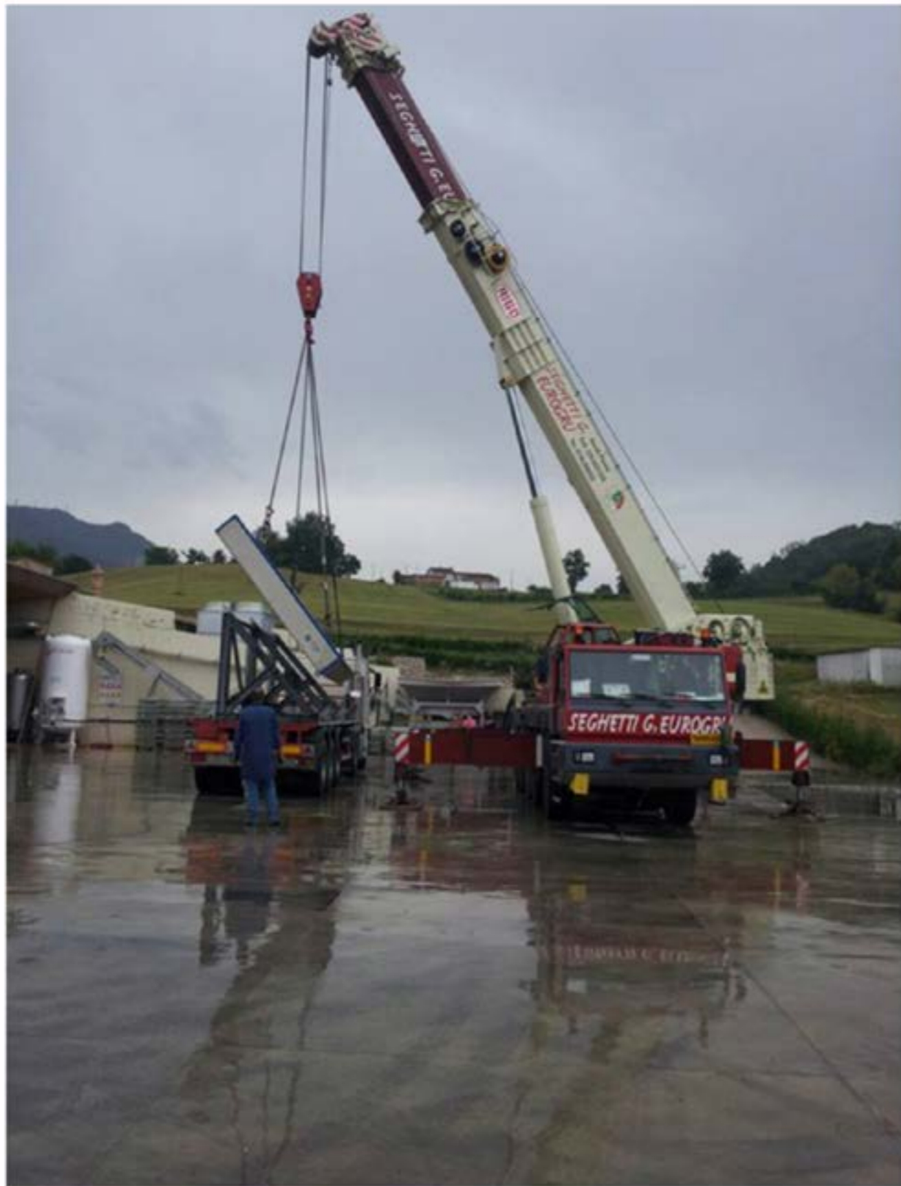
Autogru T.120 - Scarico Macchinario