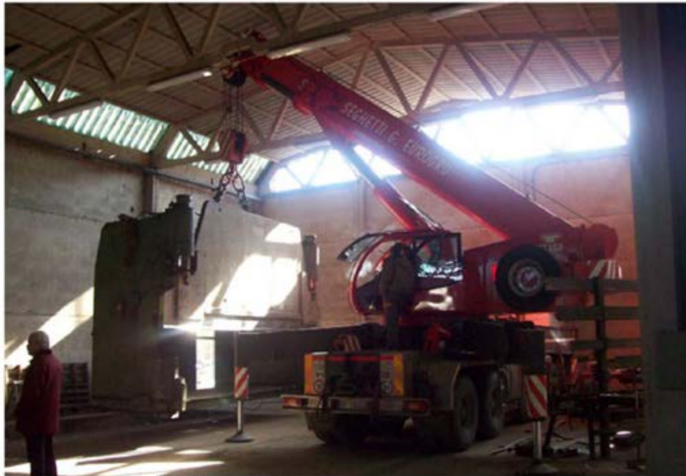
Carico Macchinari - Autogru T150