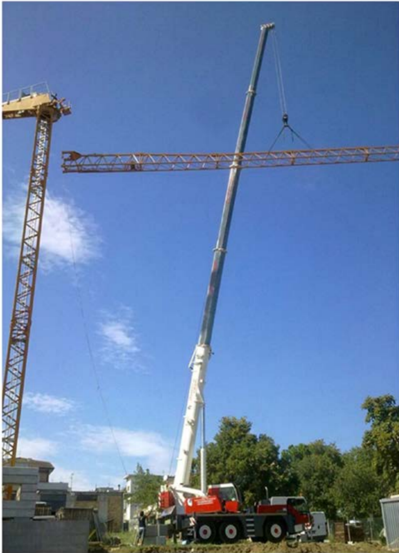
Autogru T.55 - Montaggio Gru Edile