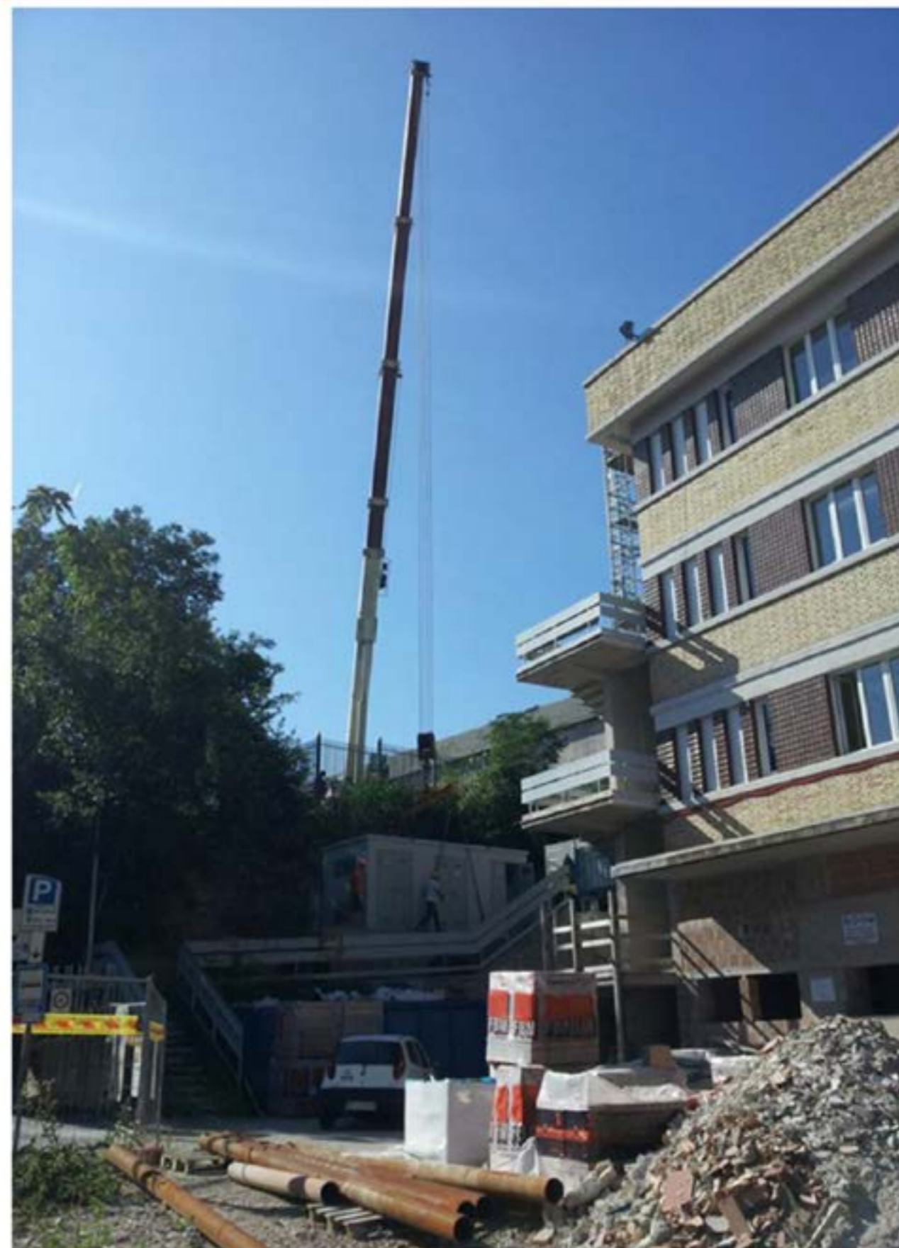
Autogru T.120 - Posizionamento Cabina Elettrica