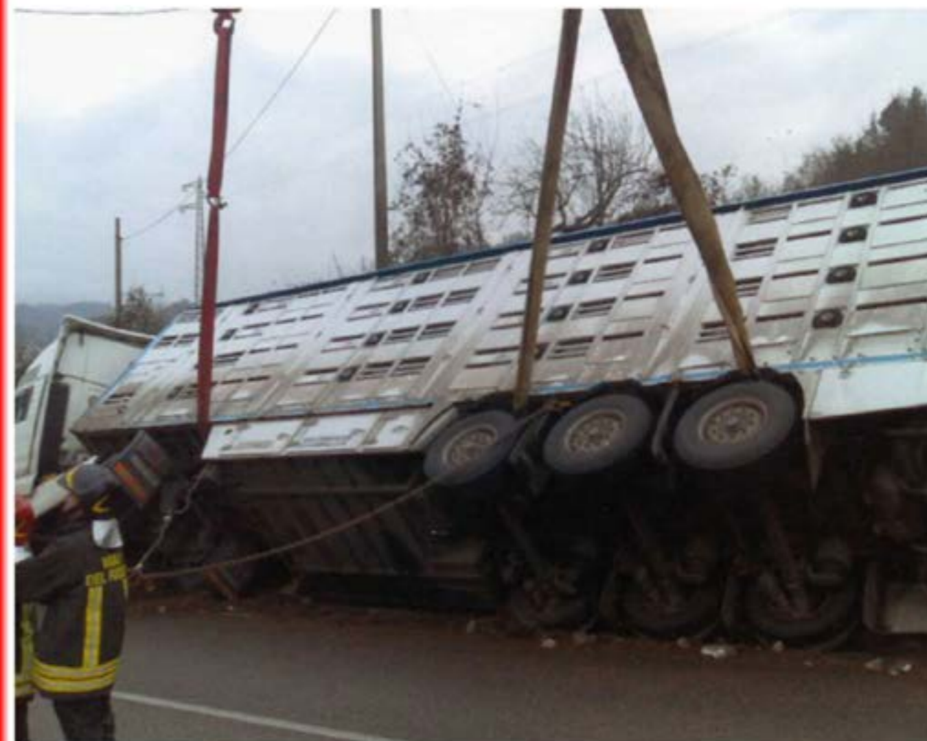
Recupero Autocarro Autogru T150