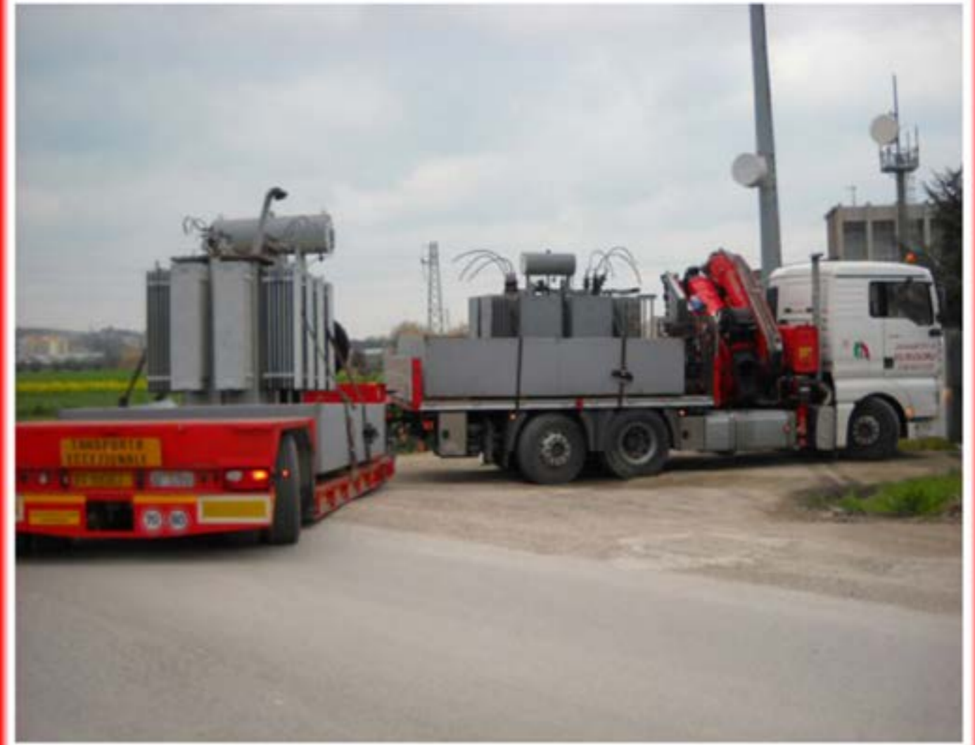
Trasporto Trasformatori Man con gru + carrellone