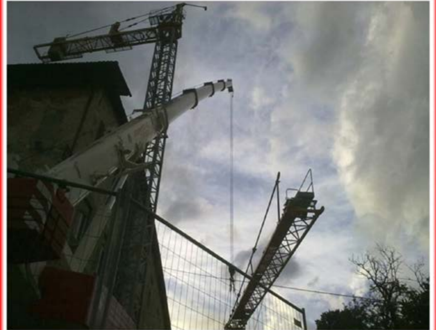
Autogru T.55 - Montaggio Gru Edile