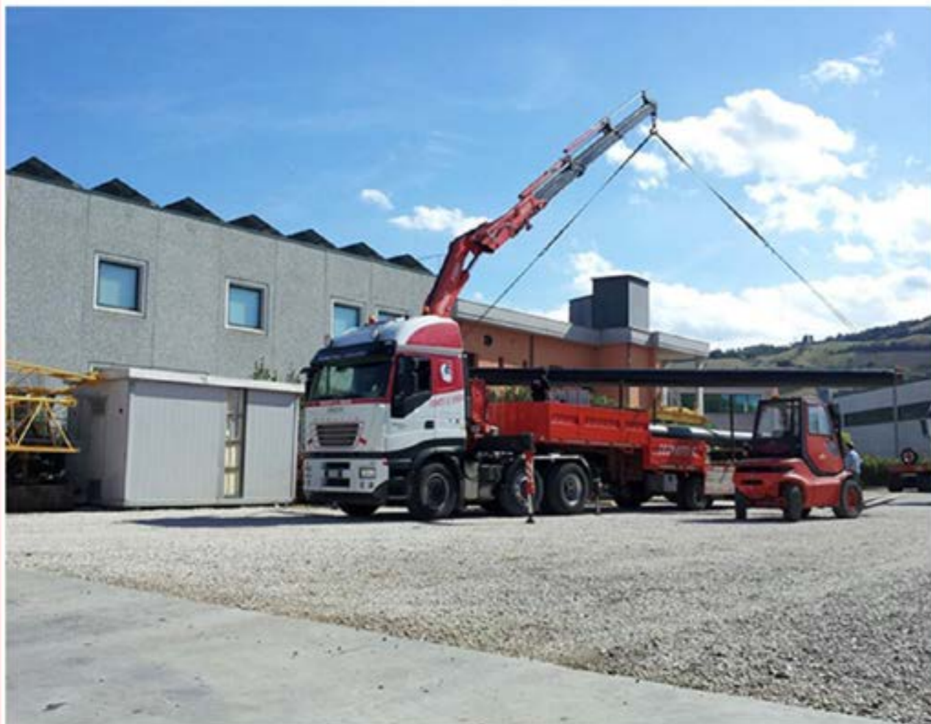
Iveco Stralis con Gru - Scarico Tubi