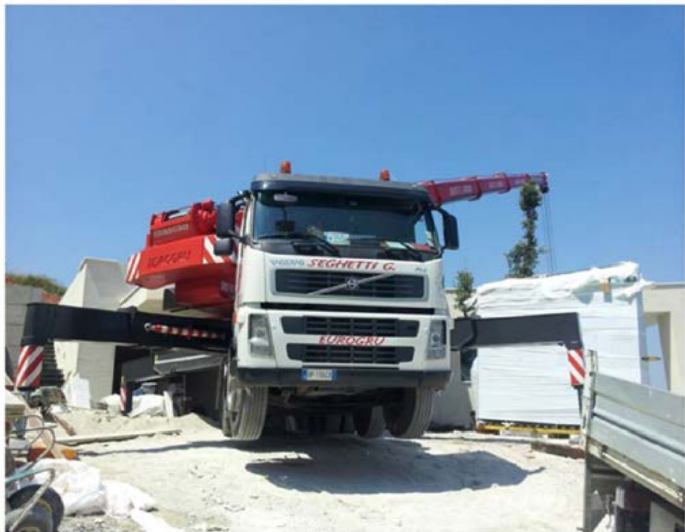
Idrogru T.150 - Montaggio Vetrate