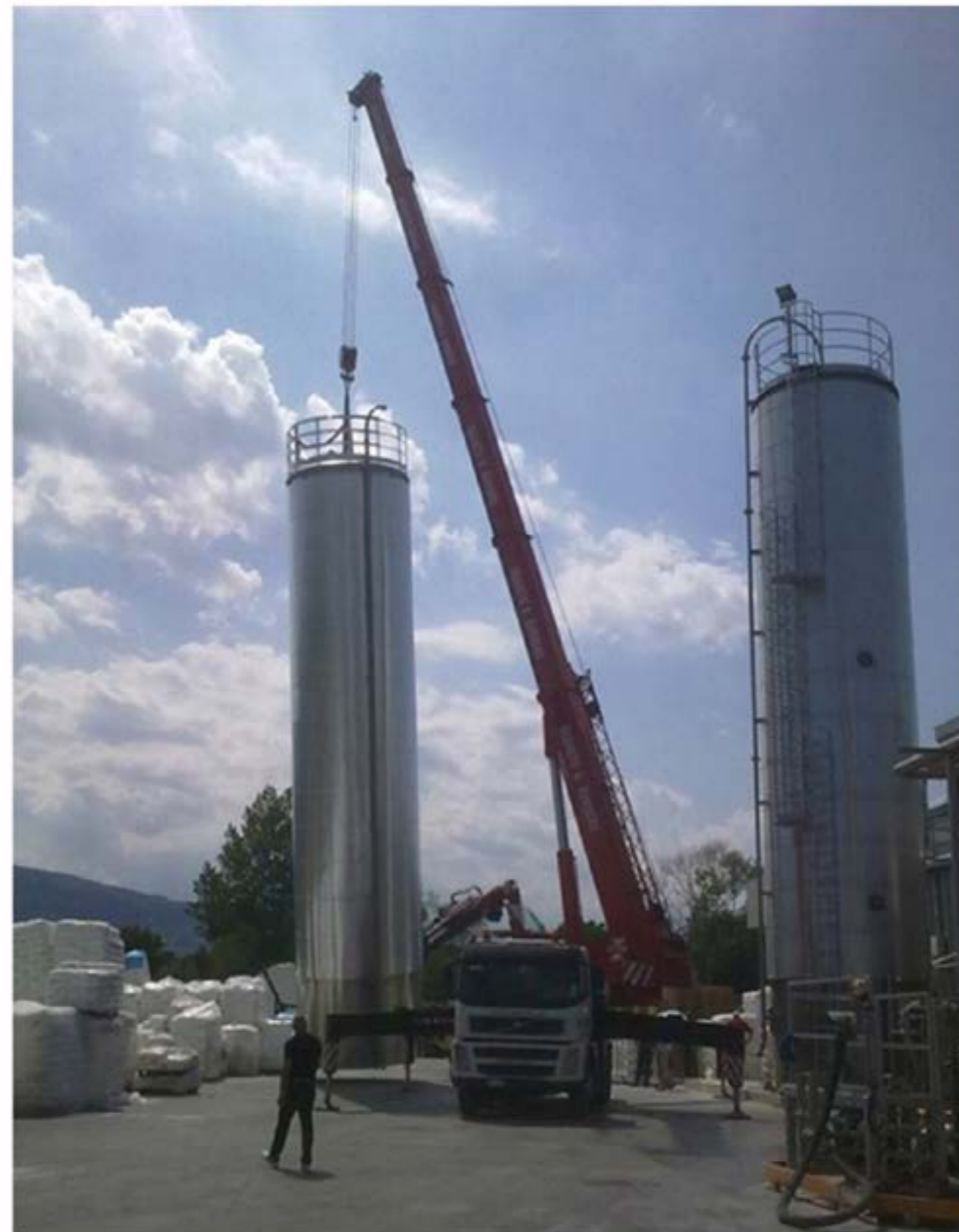
Idrogru T.150 - Posizionamento Silos