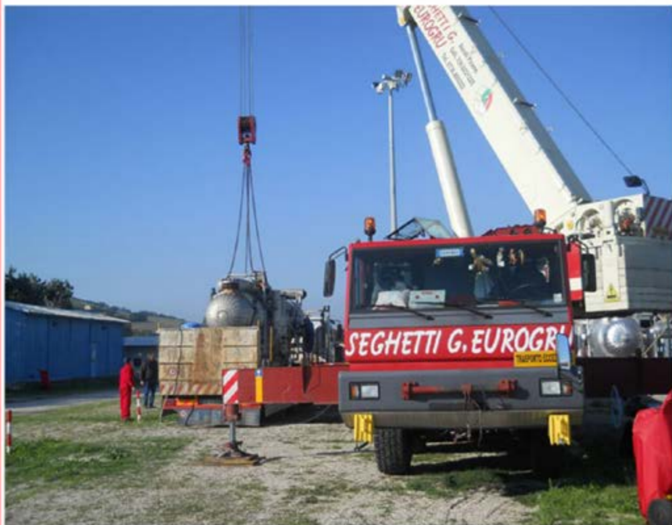
Man con piattaforma Sistemazione S.E.