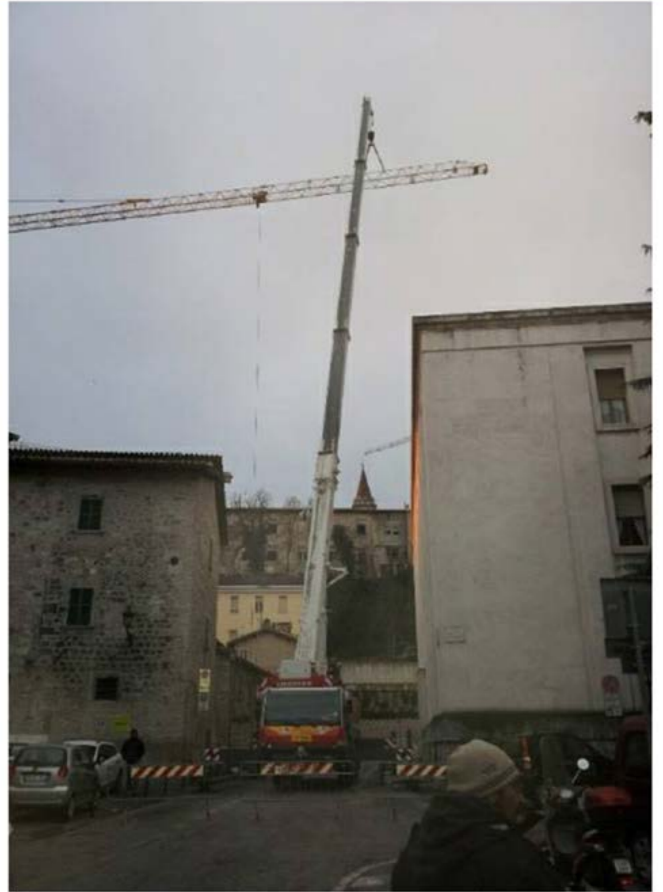
Autogru T.55 - Montaggio Gru Edile