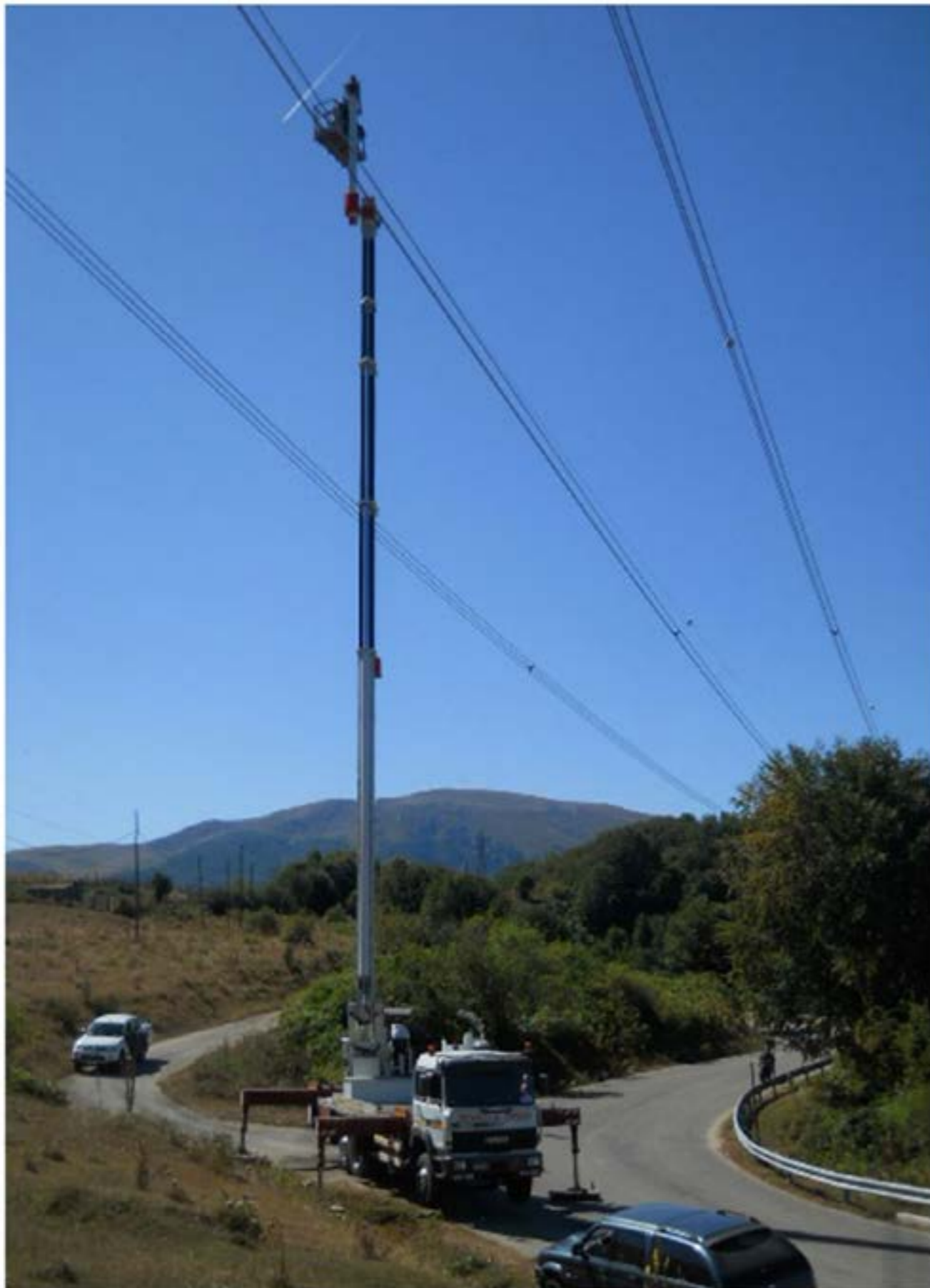
Riparazione Cavo alta Tensione Piattaforma MT46