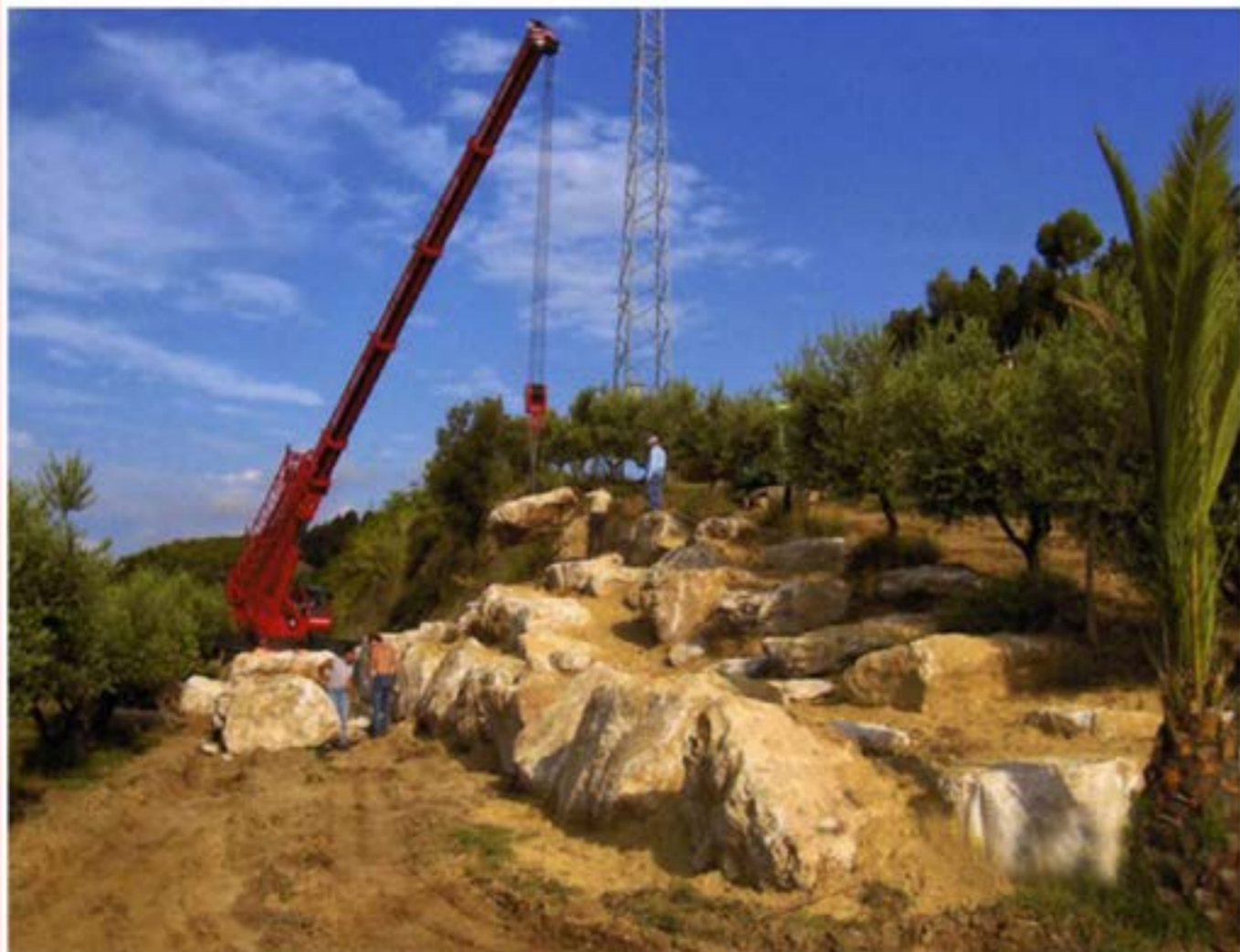
Costruzione muro in pietre Autogru T150