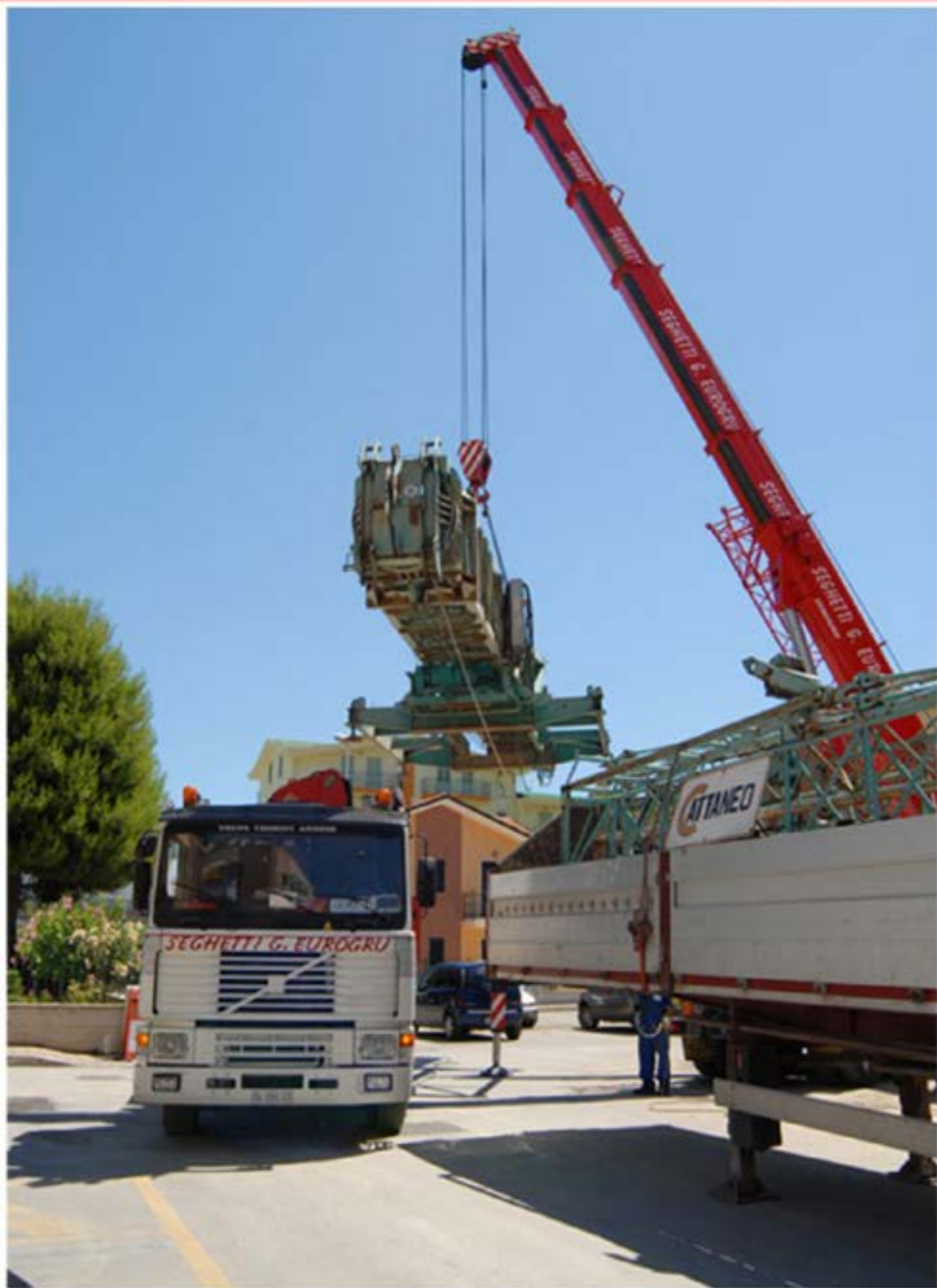
Smontaggio Gru Edile Autogru T150