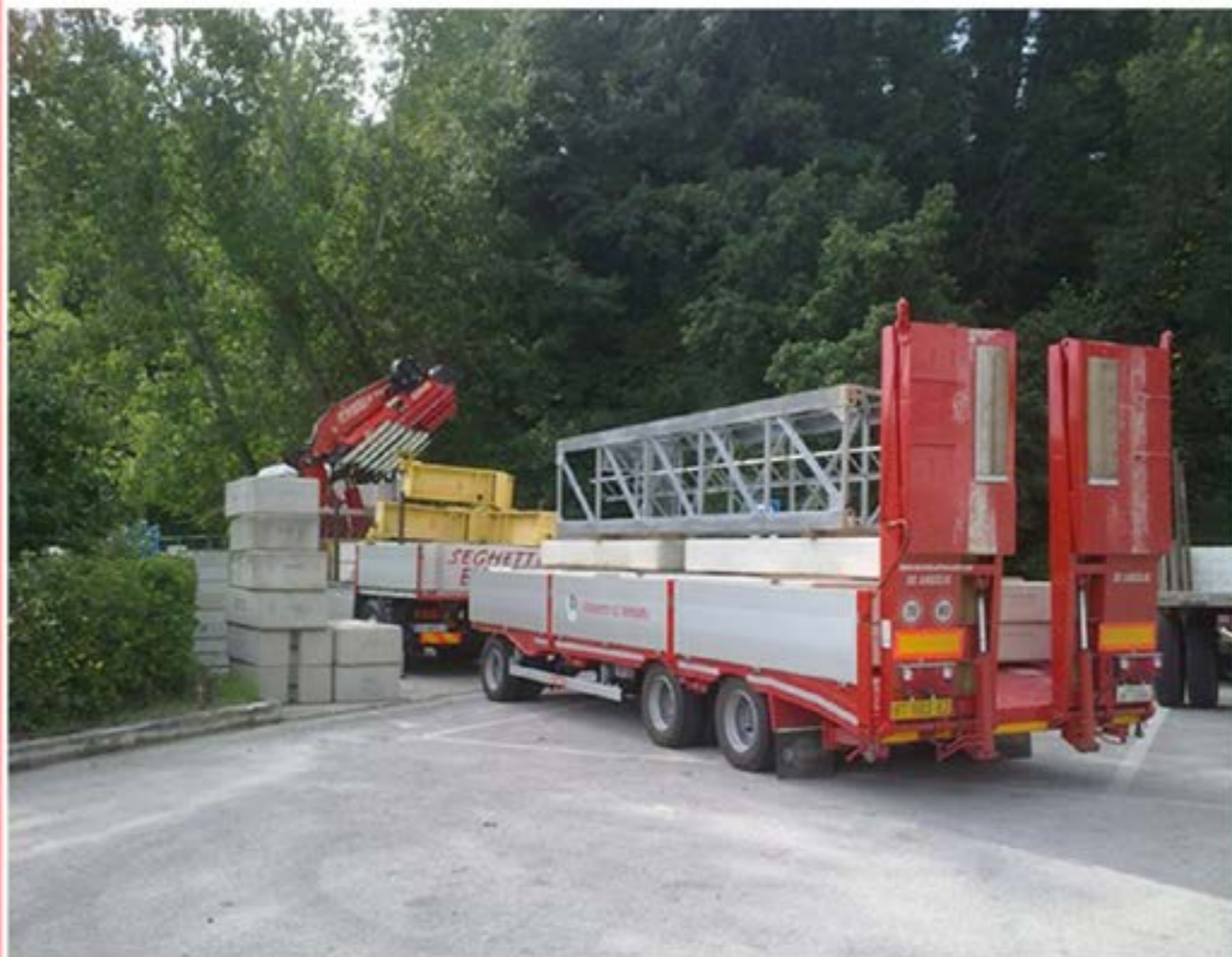
Trasporto Materiali Edili