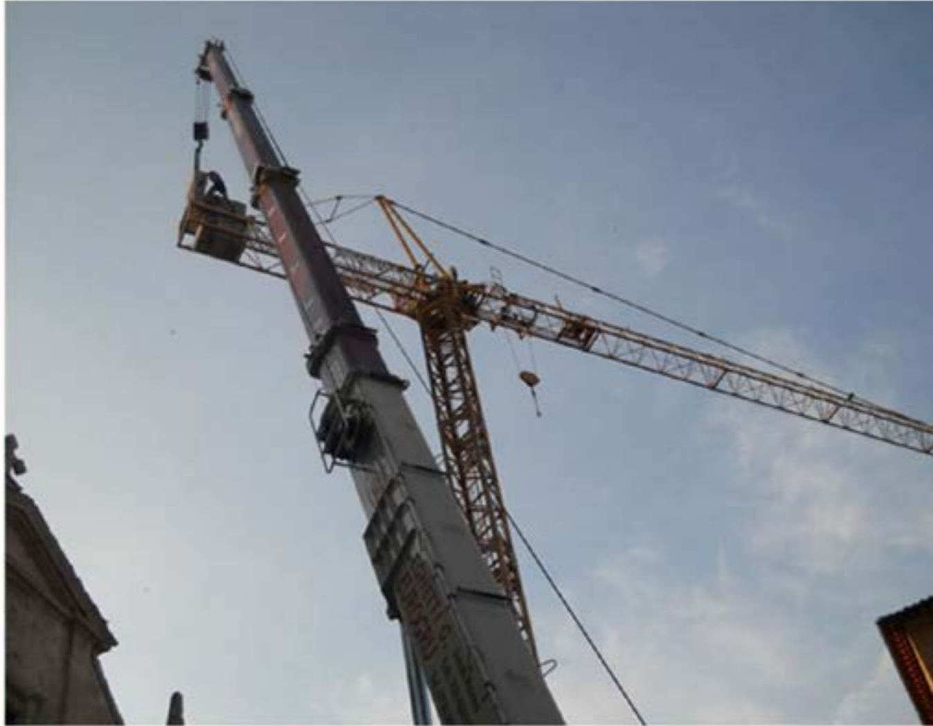
Montaggio gru Edile - autogru T120