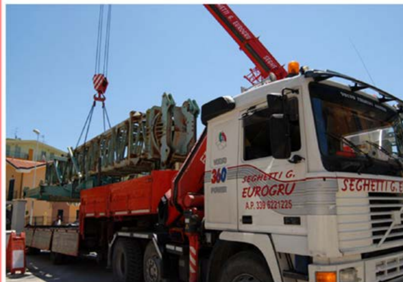
Volvo f12 con Gru per trasporto Gru Edile