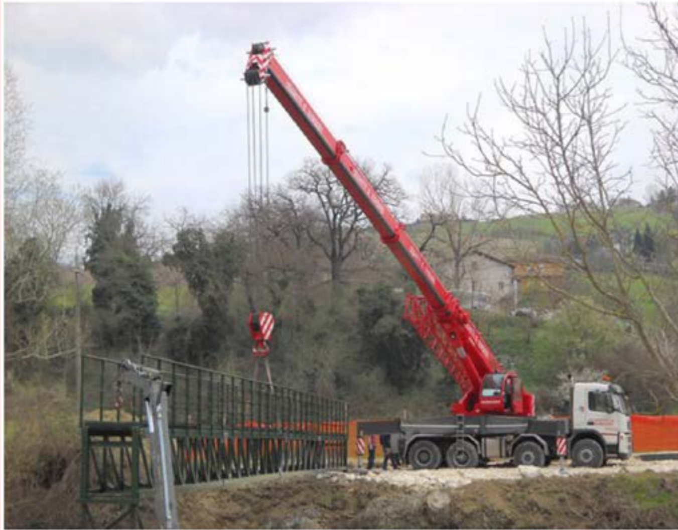
Posizionamento ponte Autogru T150