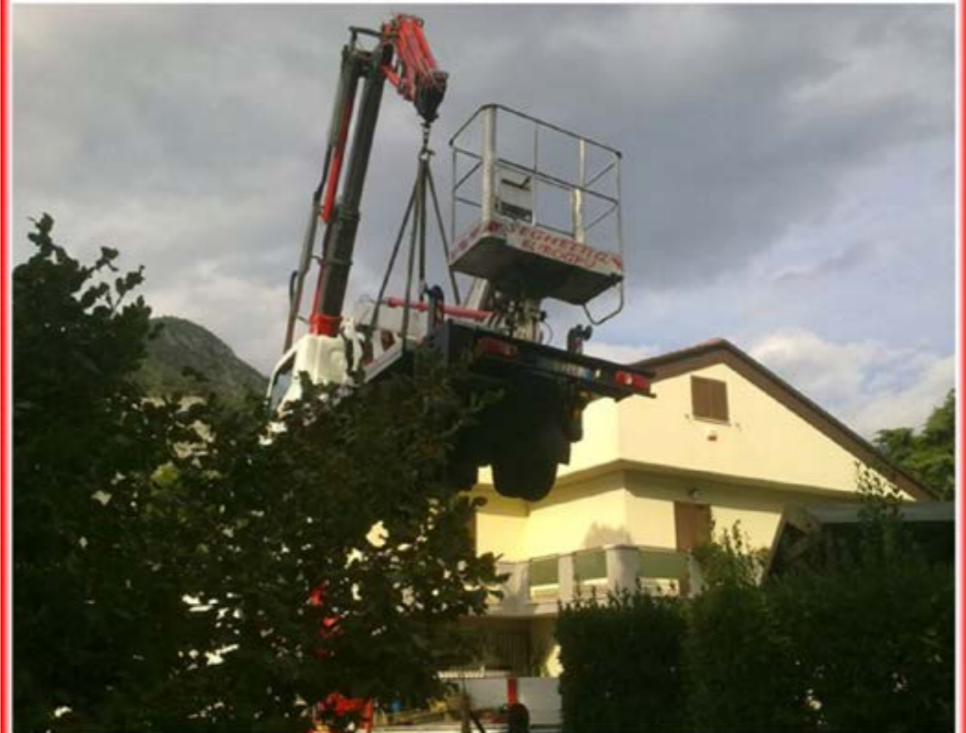
Man con Gru - Posizionamento Piattaforma mt.20

UNI EN ISO 9001:2008 Cert. N. 820711-07 UNI EN ISO 14001:2004 Cert. N. 820711-07