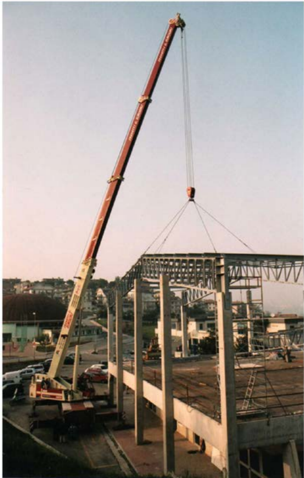
Montaggio palazzetto dello sport Autogru T120