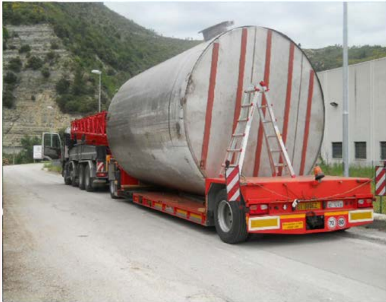
Trasporto cisterna con carrellone