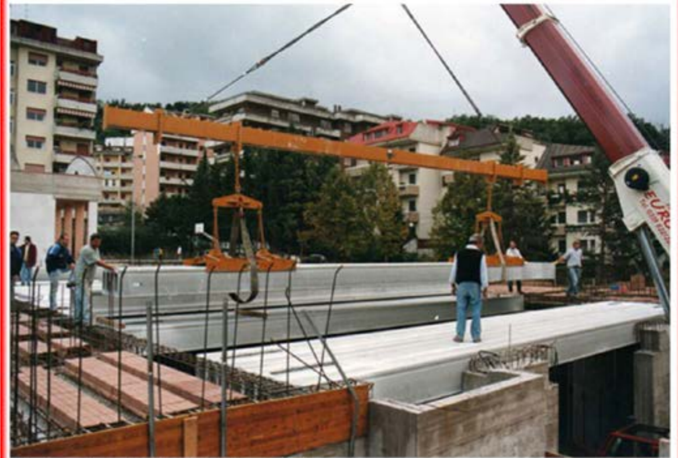
Montaggio prefabbricati Autogru T60