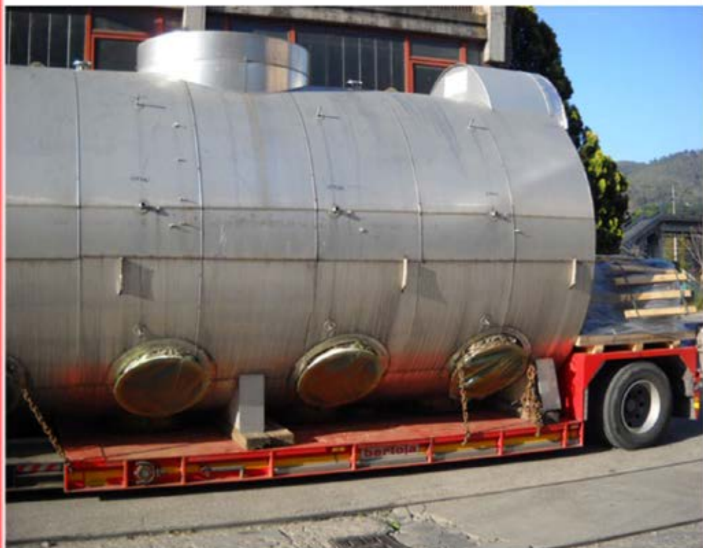
Trasporto Caldaie man con gru e carrellone