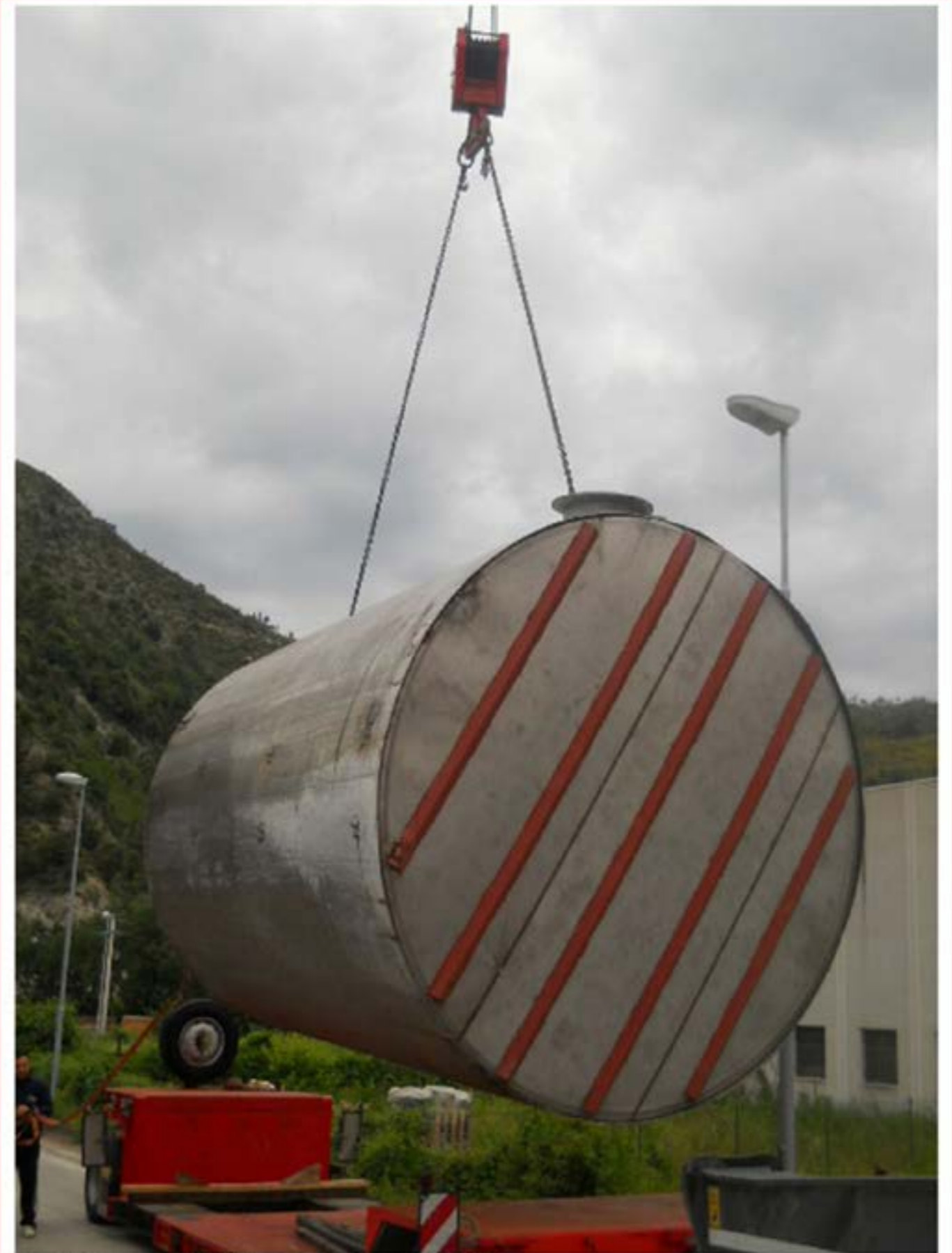
Posizionamento Cisterna - Autogru T150