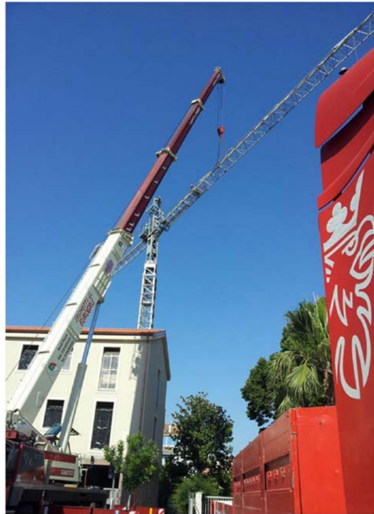
Autogru T.120 - Smontaggio Gru Edile