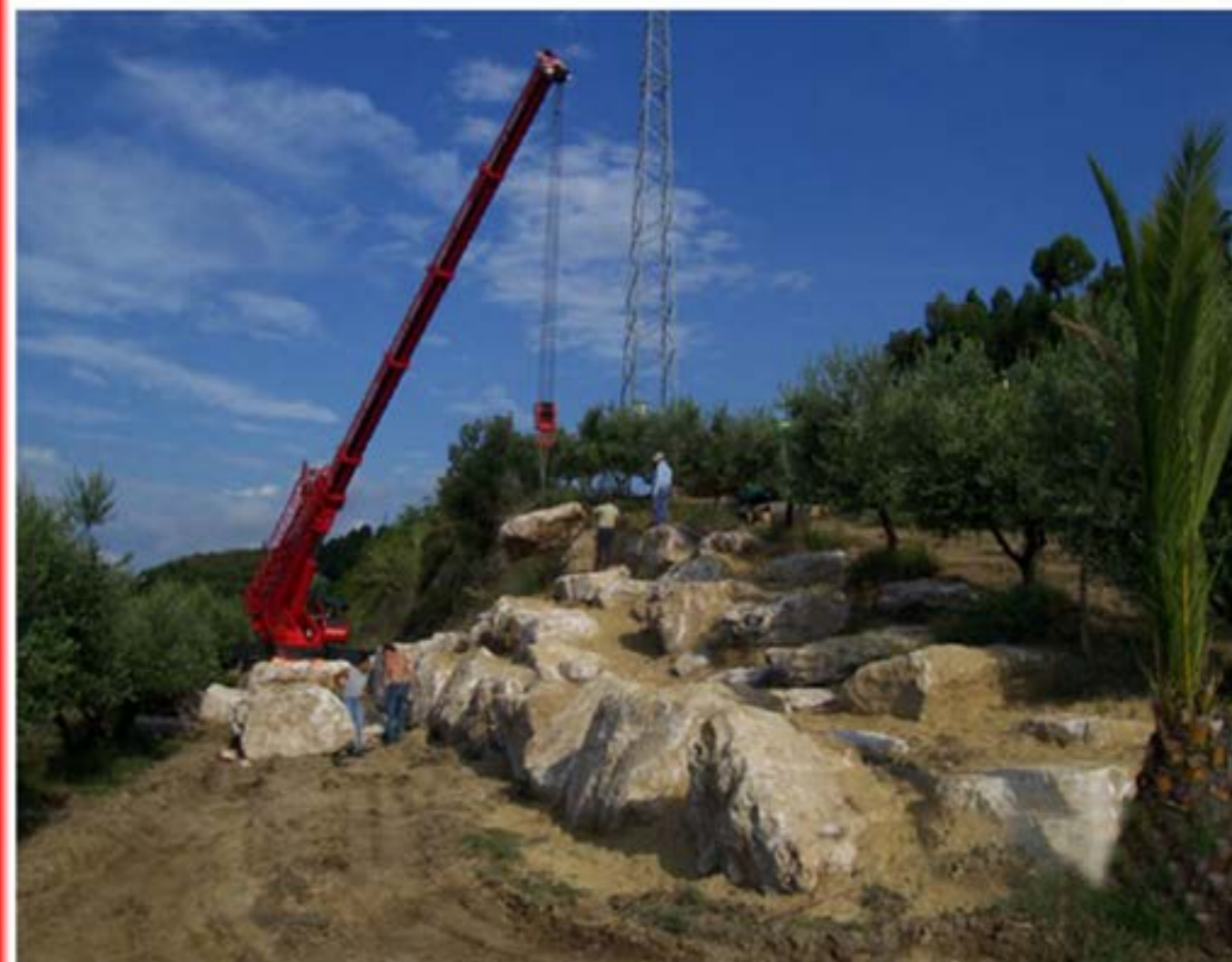
Costruzione muro in pietre Autogru T150