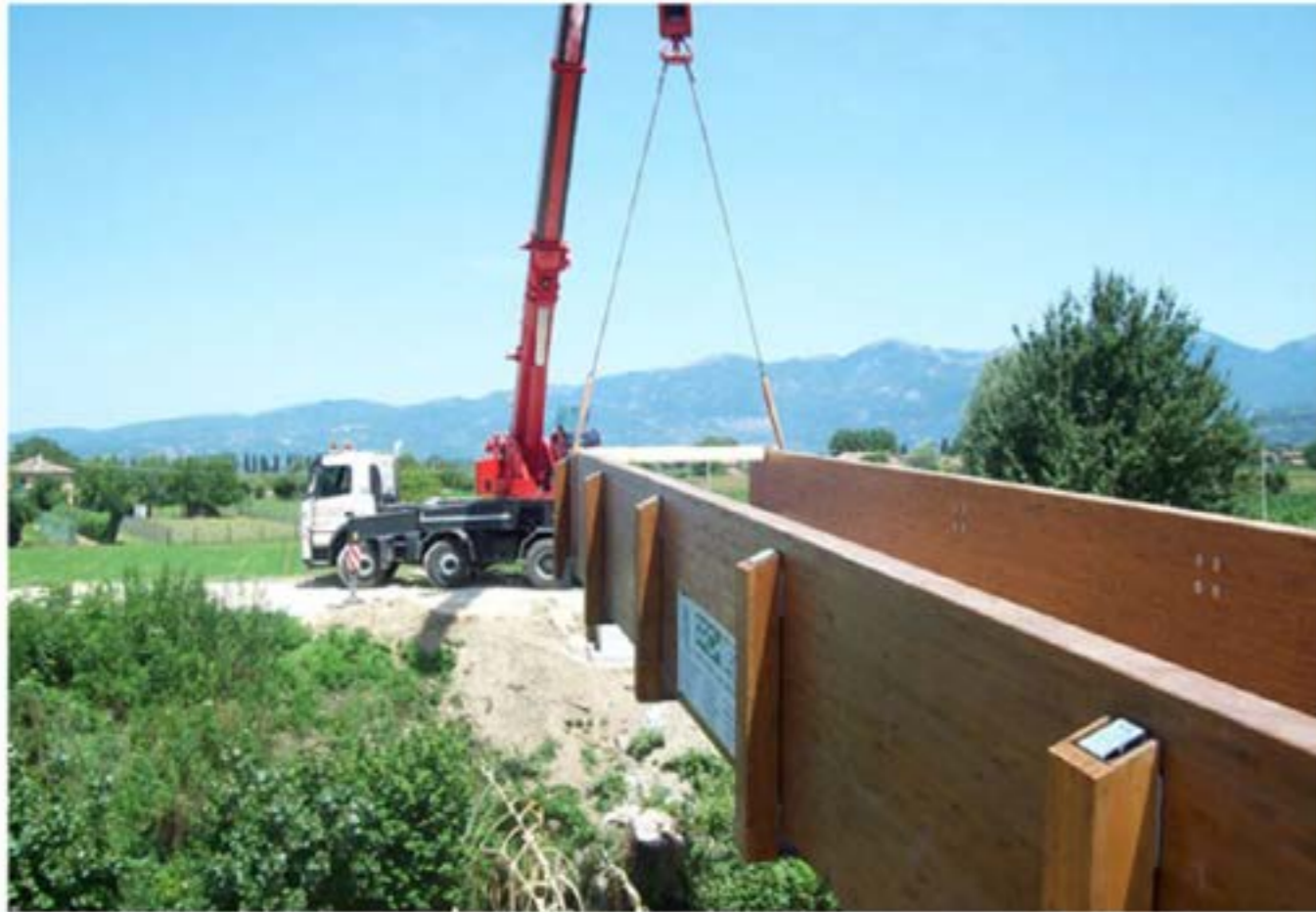
Montaggio e Trasporto Ponte Pista Ciclabile - Autogru T150