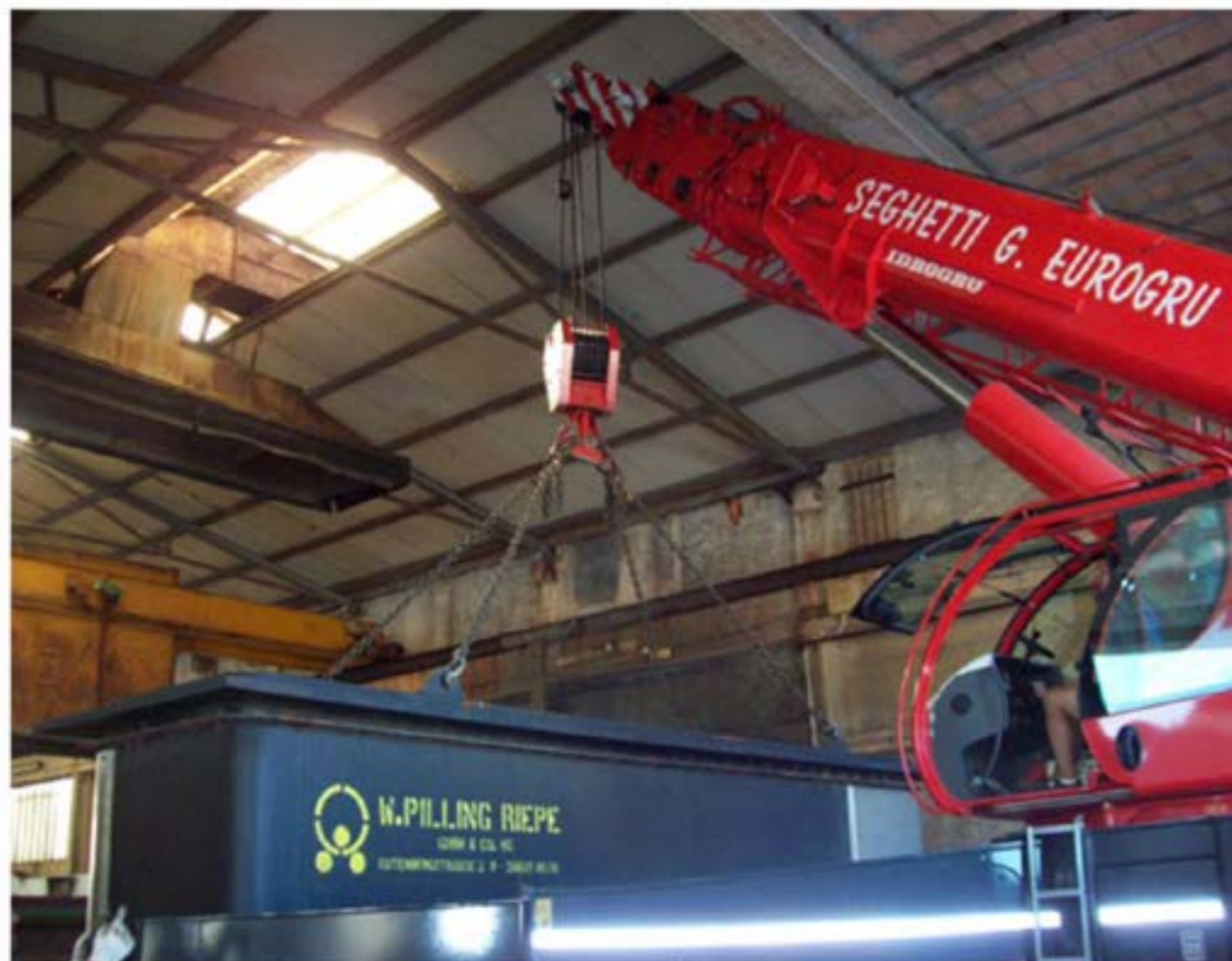
Posizionamento vasca Autogru T150