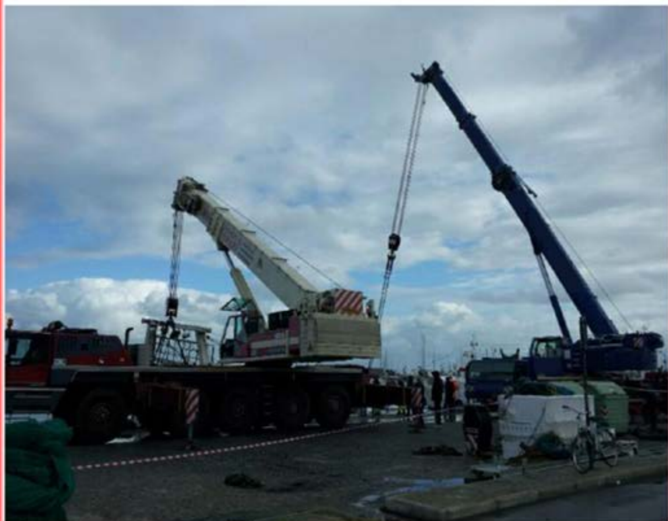
Autogru T.120 - Recupero Peschereggio