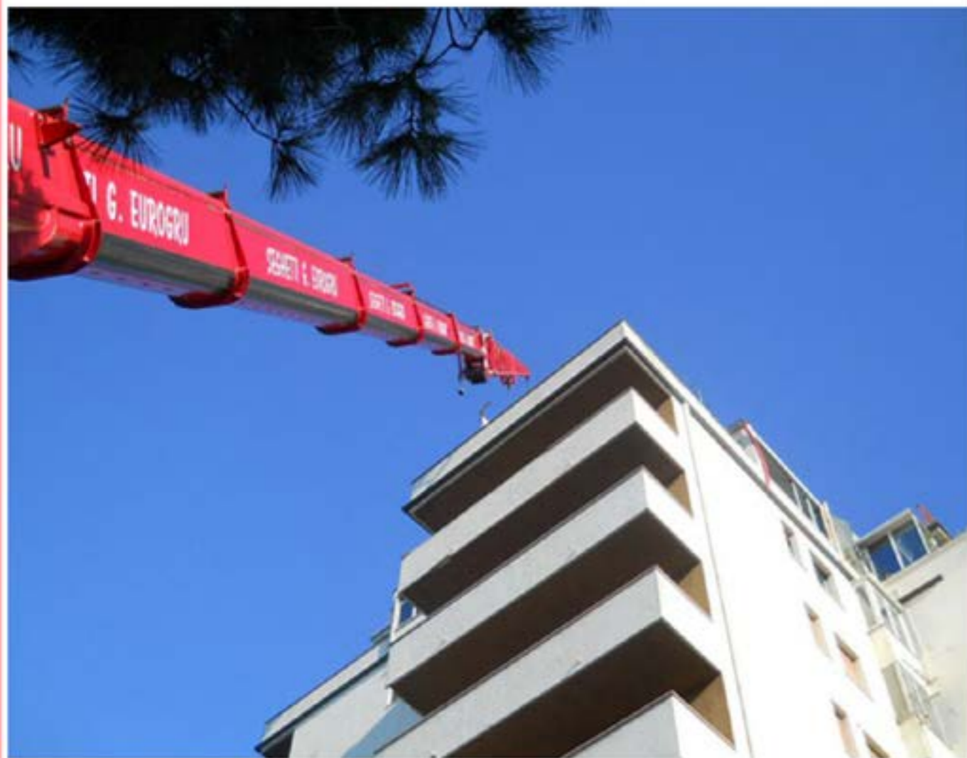
Sollevamento Materiali edili Autogru T150