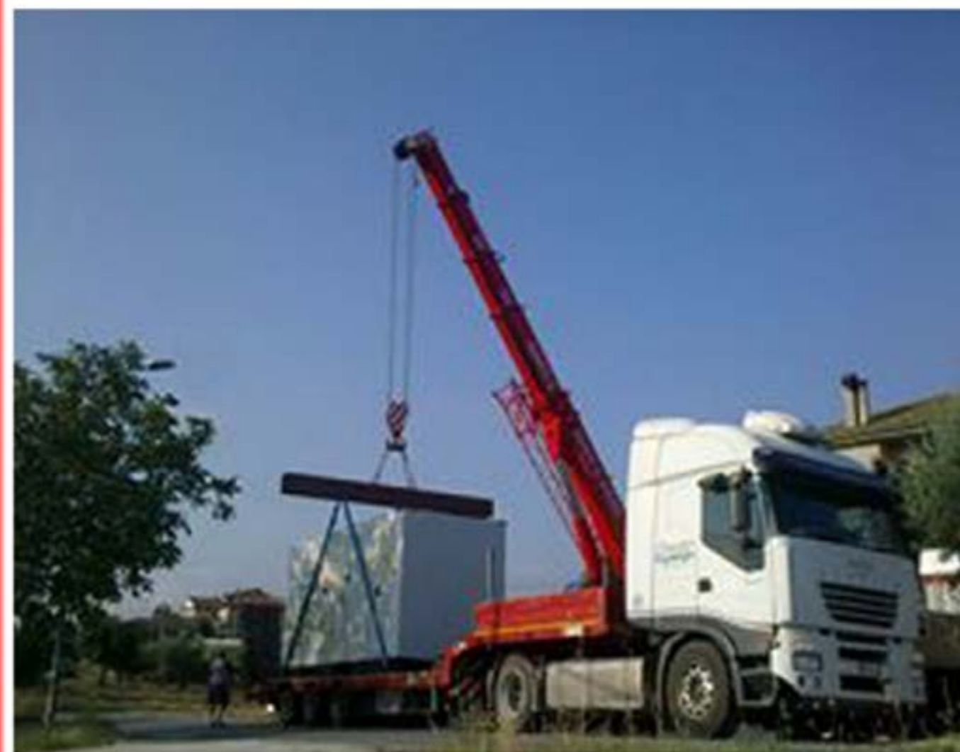
Idrogru T.150 - Sollevamento Cabina Elettrica