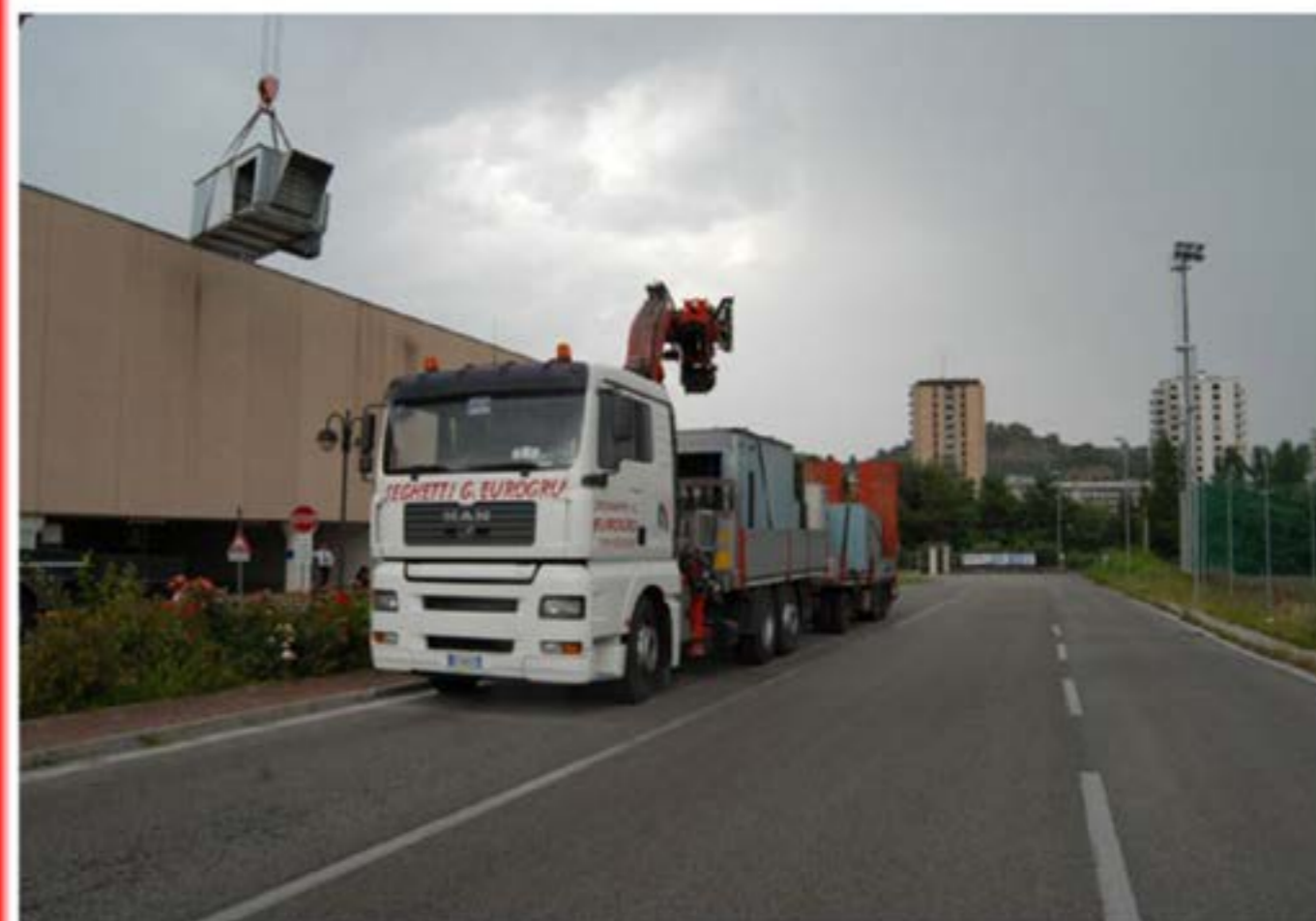
Man con Gru F700 - Trasporto Condizionatori