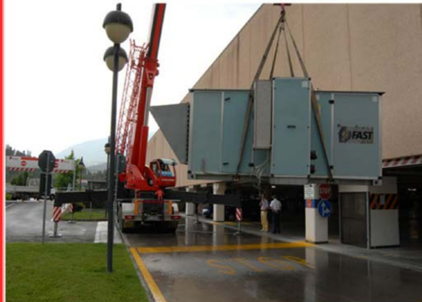
Sollevamento condizionatori - Autogru T150