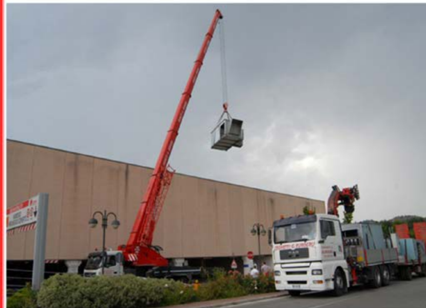
Sollevamento condizionatori - Autogru T150