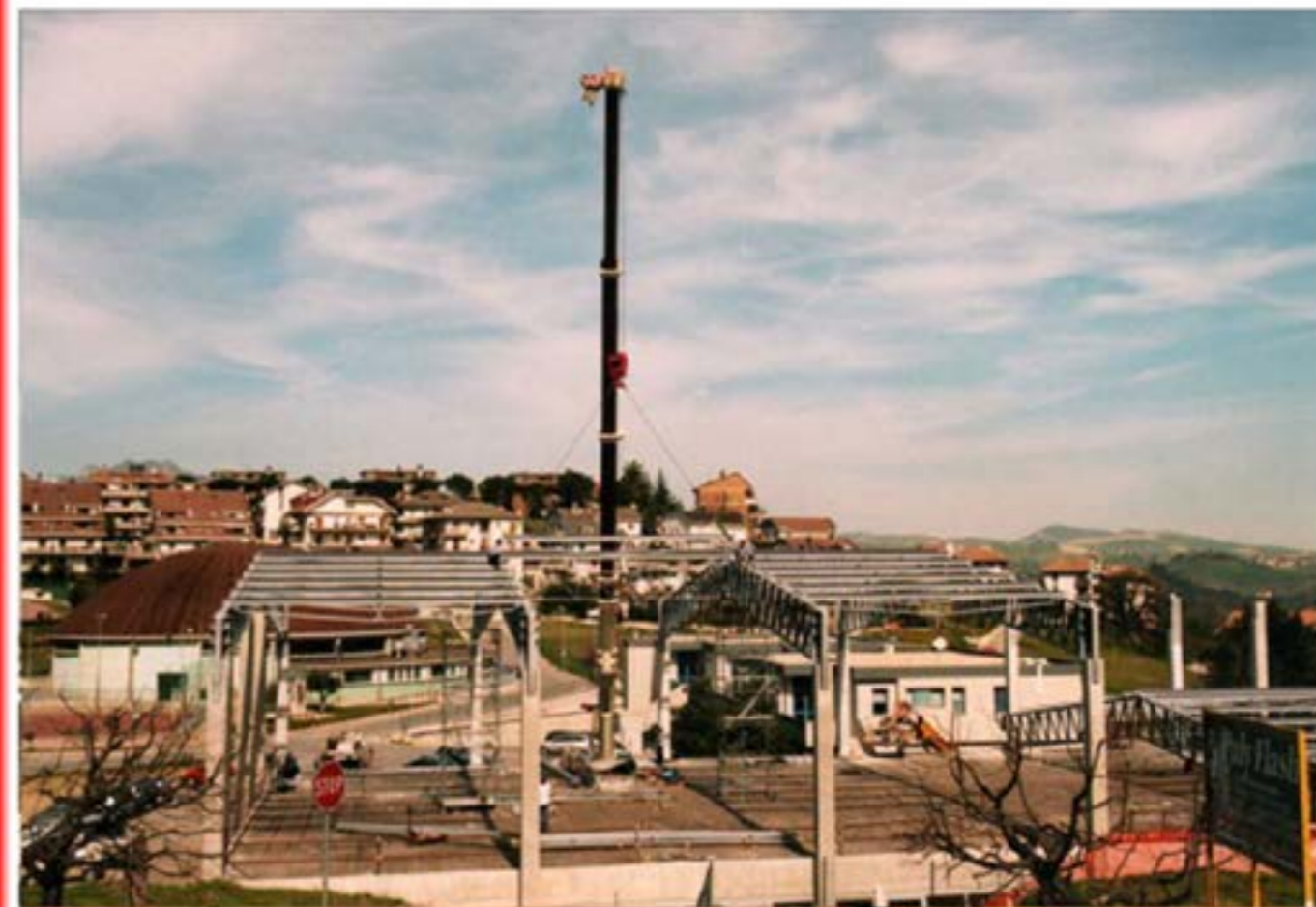
Montaggio palazzetto dello sport Autogru T120