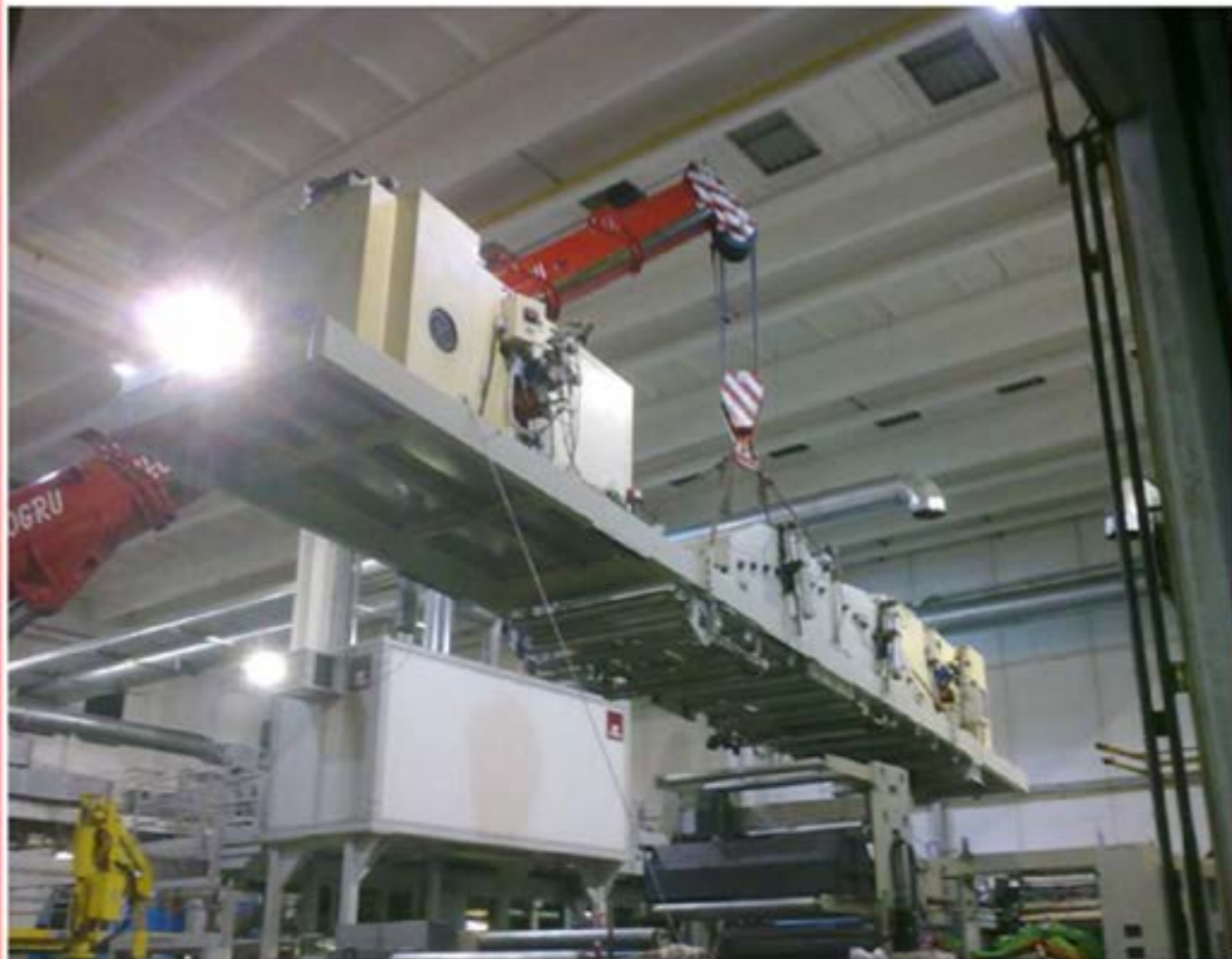
Idrogru T.150 - Posizionamento Macchinari