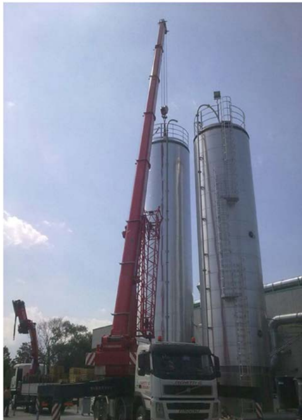
Idrogru T.150 - Più Man per Sollevamento Silos