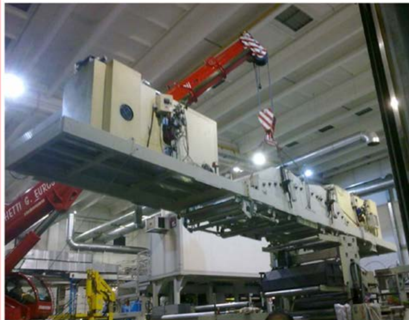
Idrogru T.150 - Montaggio Macchinari

UNI EN ISO 9001:2008 Cert. N. 810711.07 UNI EN ISO 14001:2004 Cert. N. 810711.07