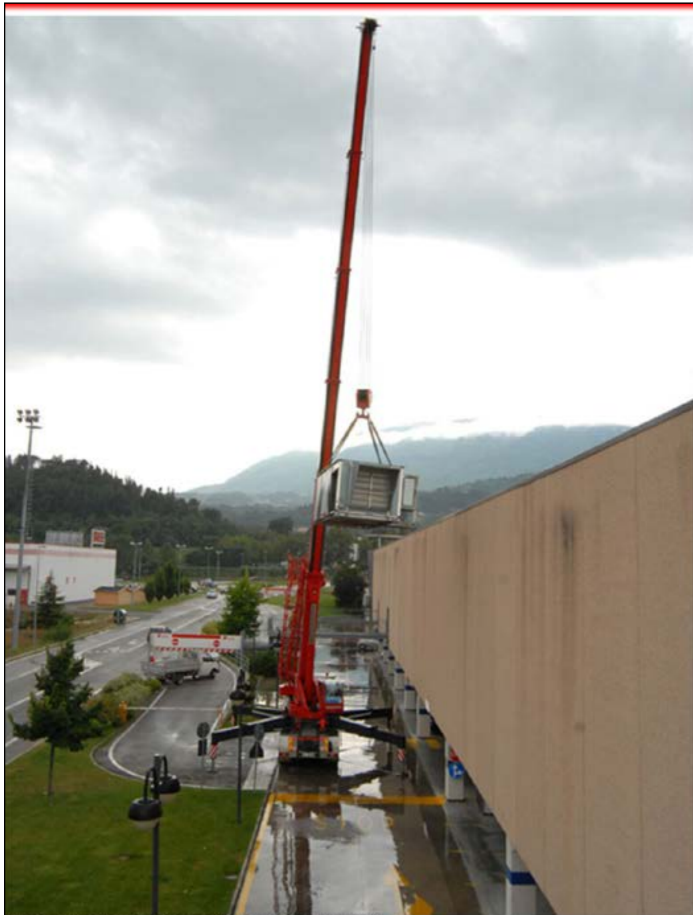
Sollevamento condizionatori - Autogru T150