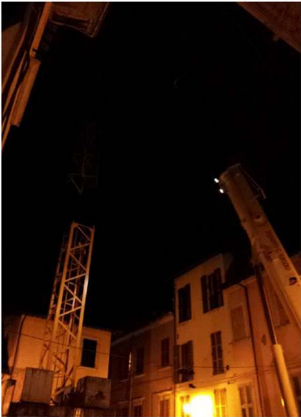
Autogru T.55 - Montaggio Gru Edil