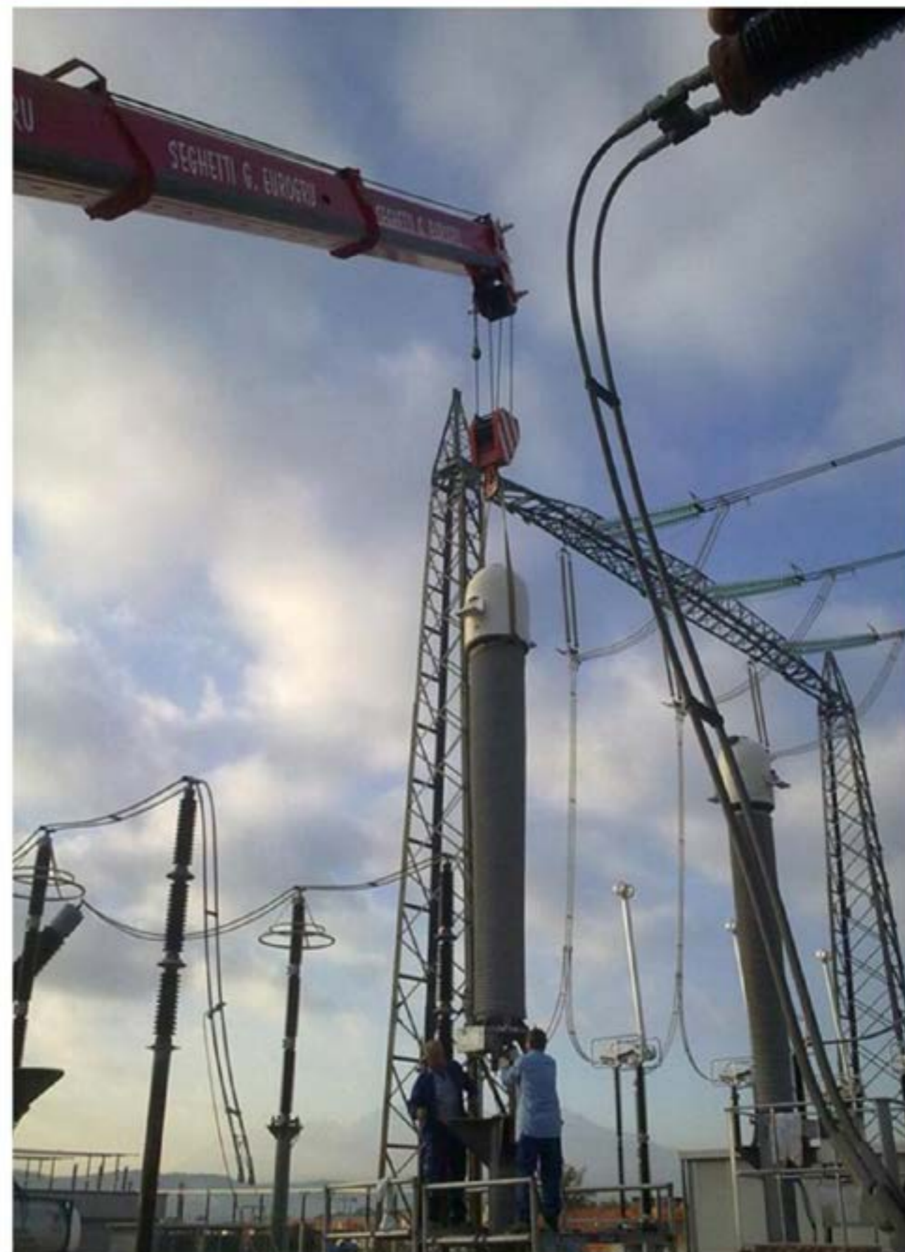
Idrogru T.150 - Posizionamento Isolatori