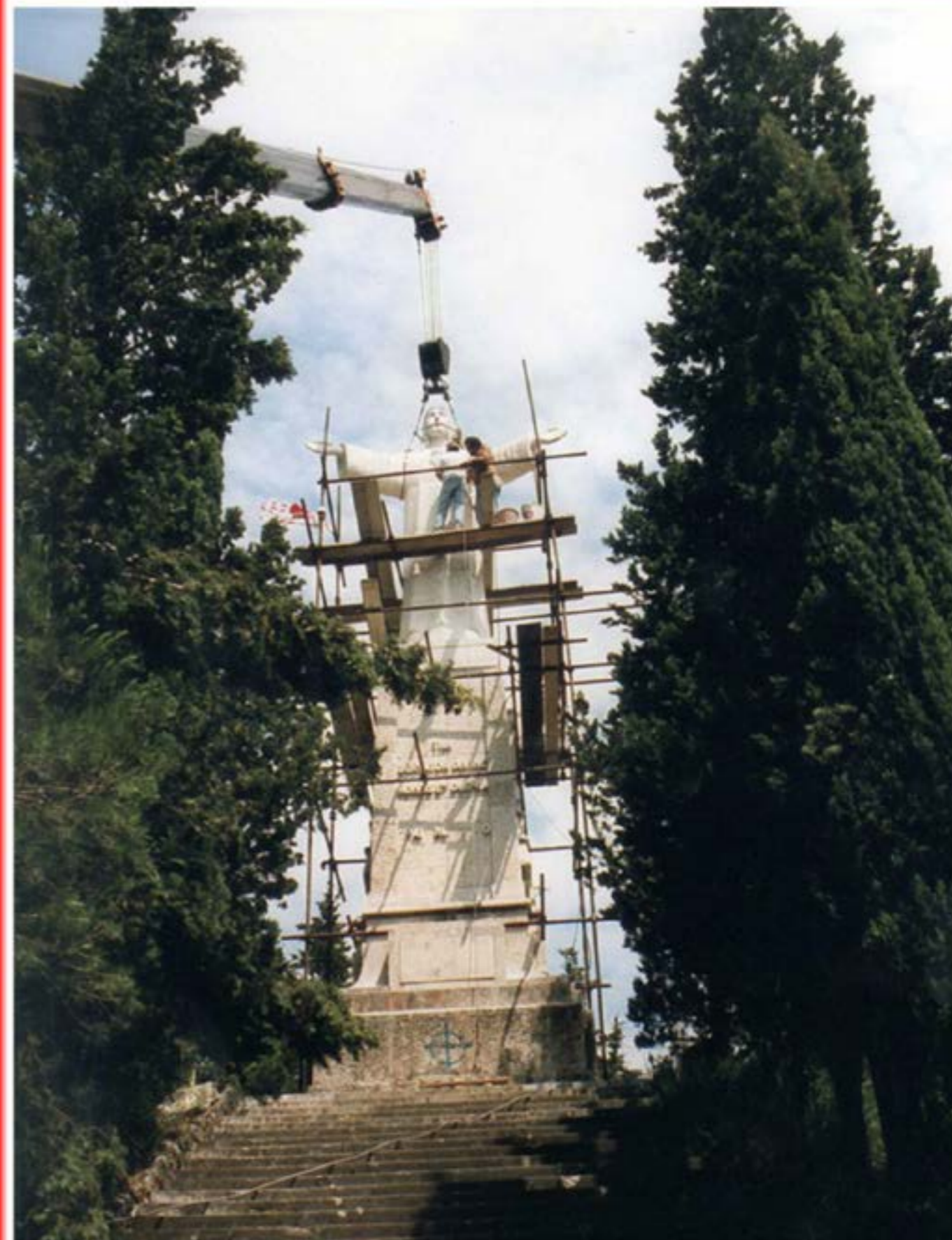
Posizionamento statua Autogru T32