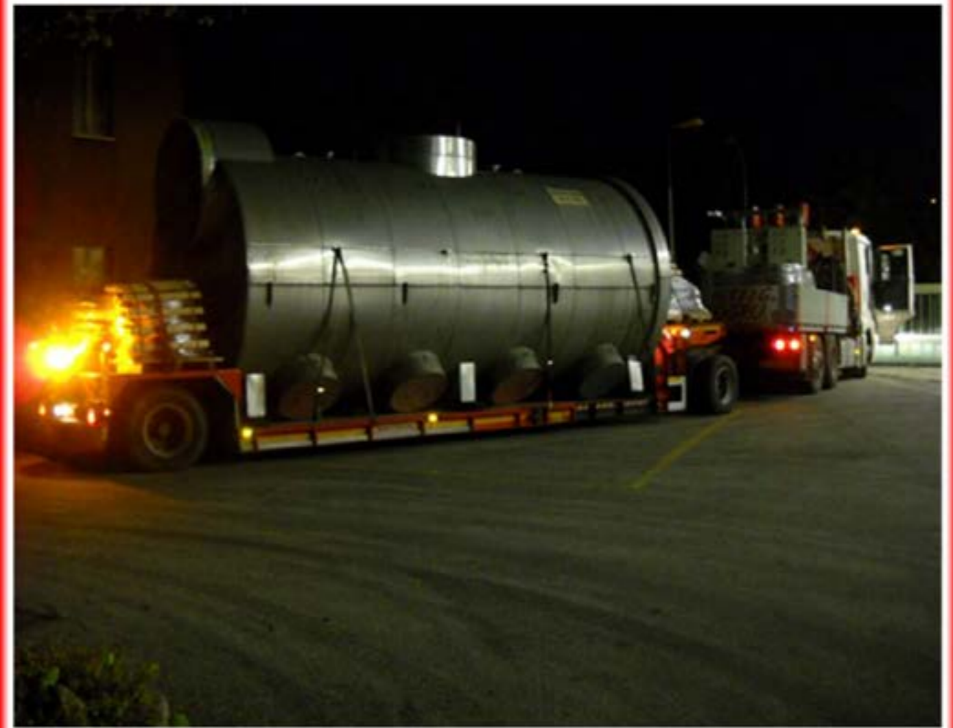
Trasporto Caldaie man con gru e carrellone