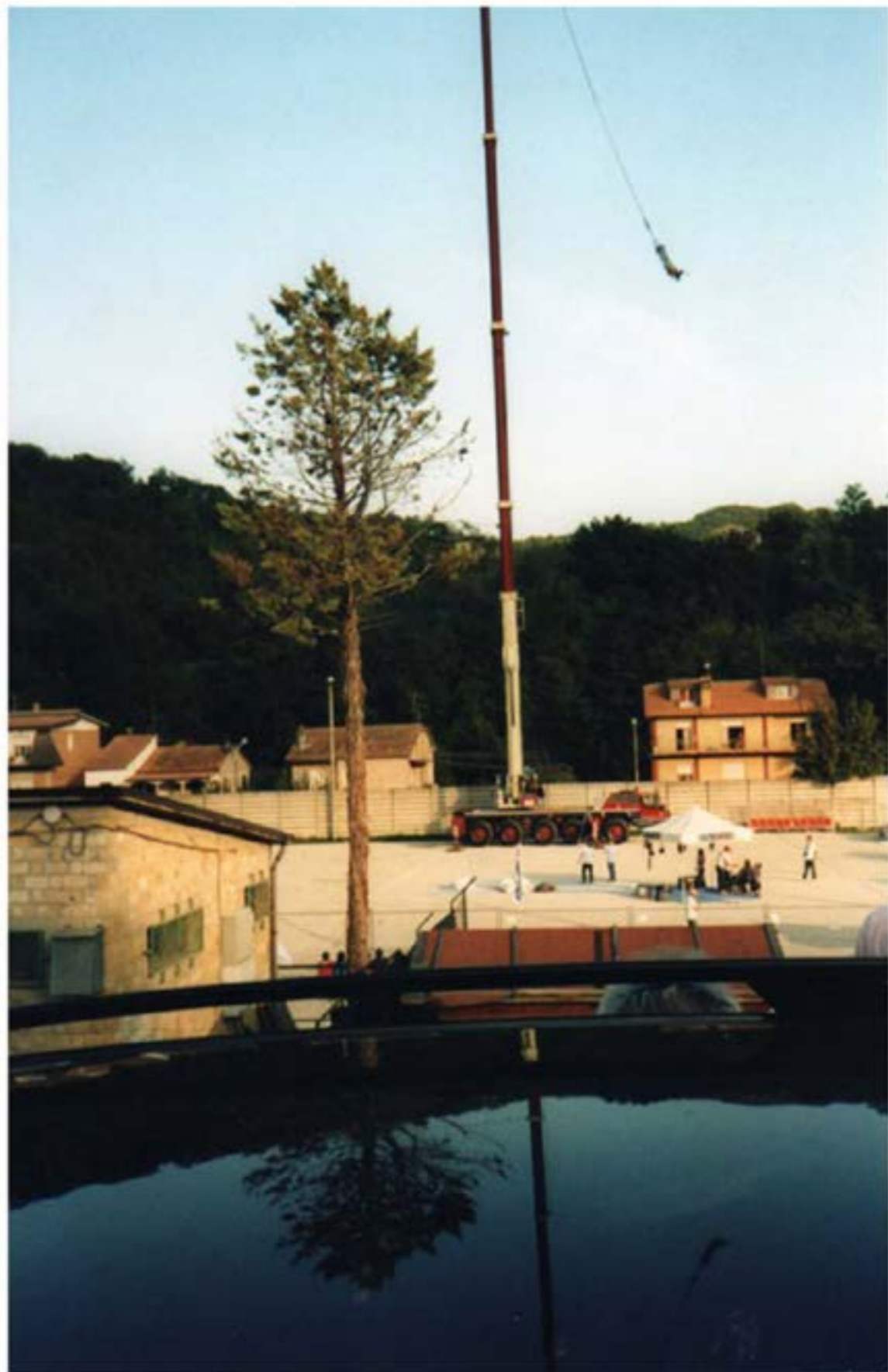
Bungee jumping - Autogru T120