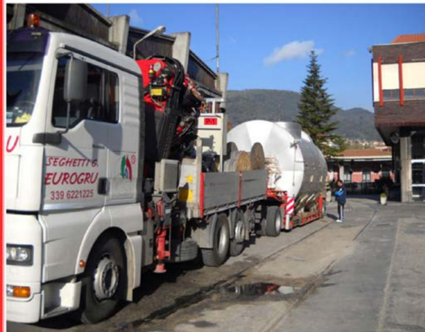
Trasporto Caldaie man con gru e carrellone