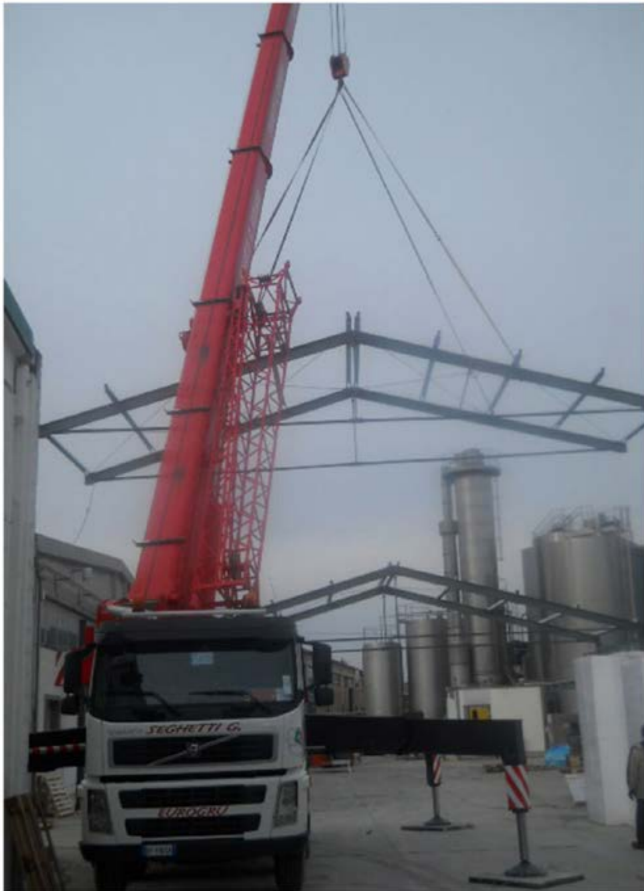
Montaggio carpenteria Autogru T120