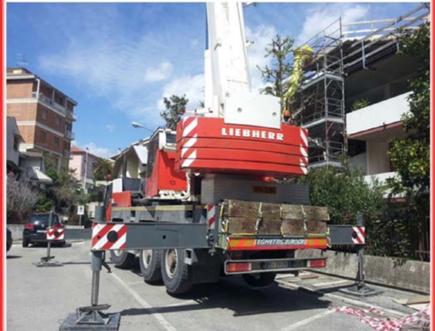
Autogru T.55 - Sollevamento Materiali Edili