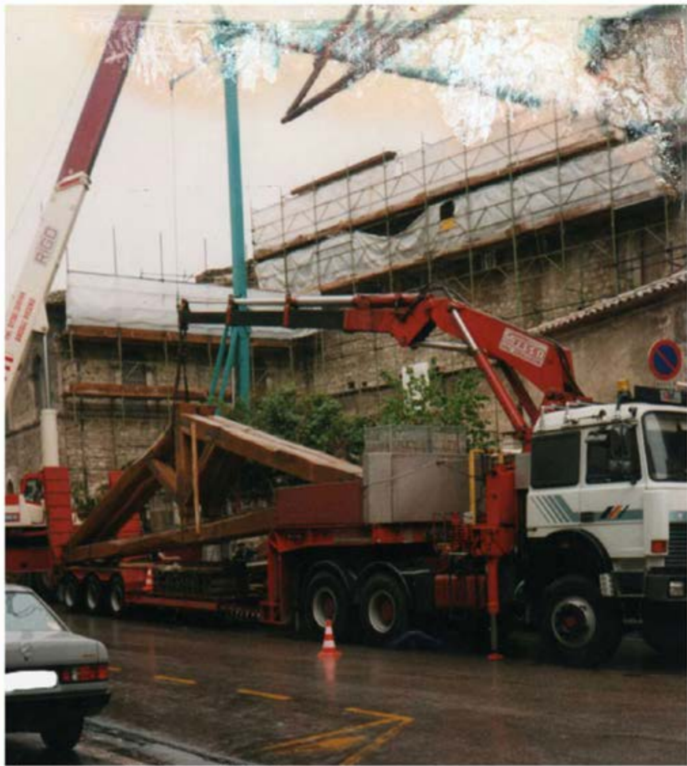
Trasporto travi in legno Fiat 330