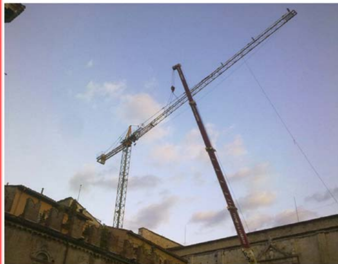
Autogru T.120 - Montaggio Gru Edile