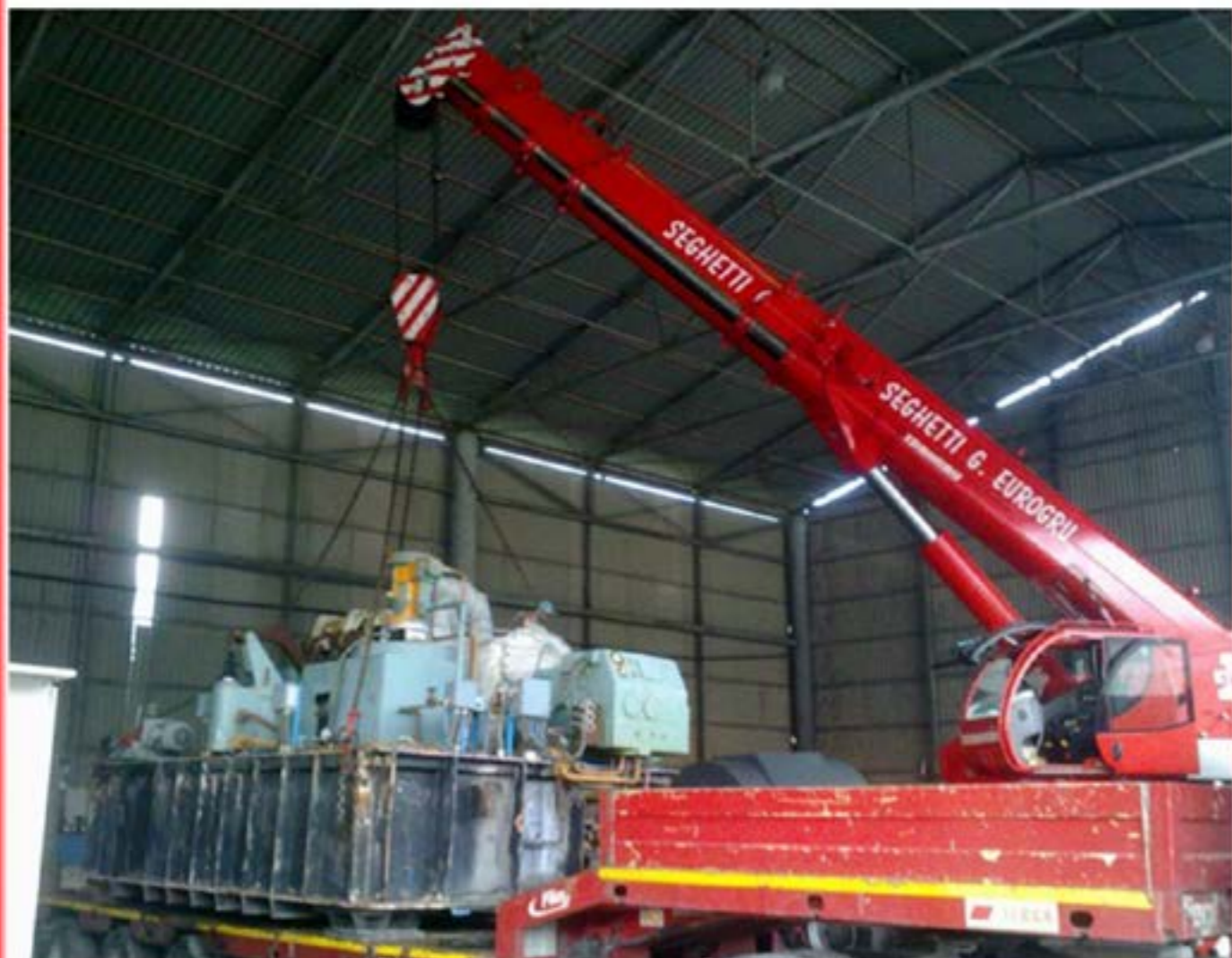
Idrogru T.150 - Scarico Macchinari