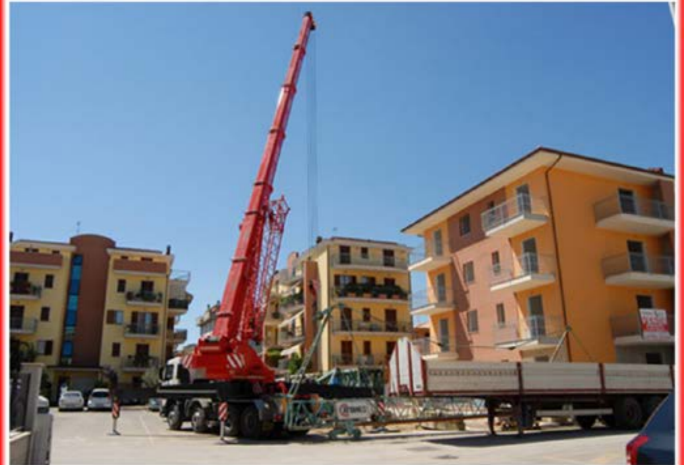
Smontaggio Gru Edile Autogru T150