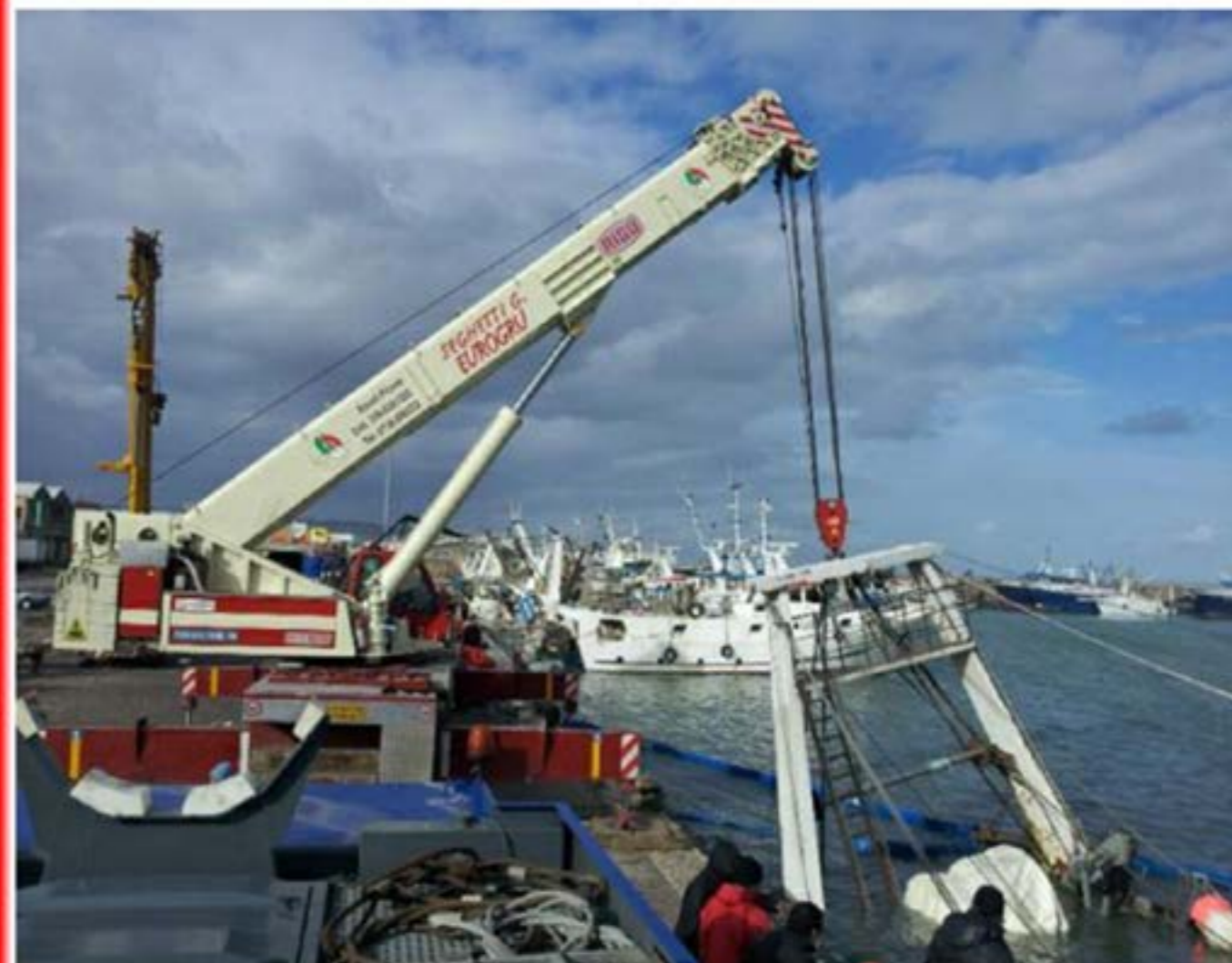
Autogru T.120 - Recupero Peschereggio