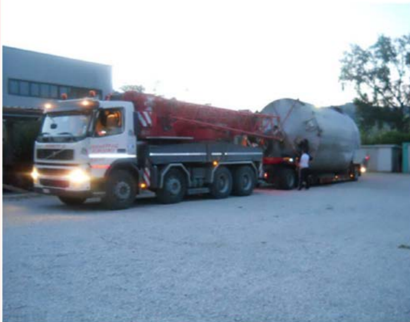
Trasporto cisterna con carrellone