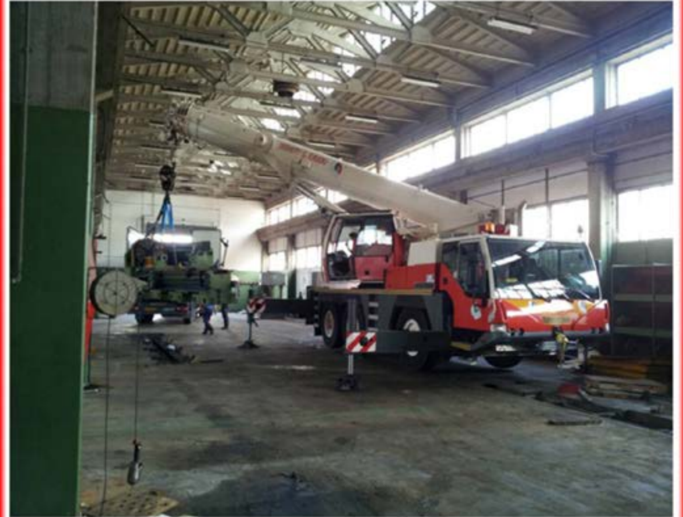
Autogru T.55 - Posizionamento Tornio