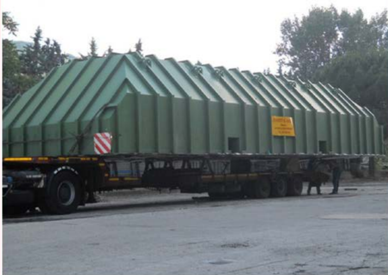
Man con Carrellone - Trasporto Forni