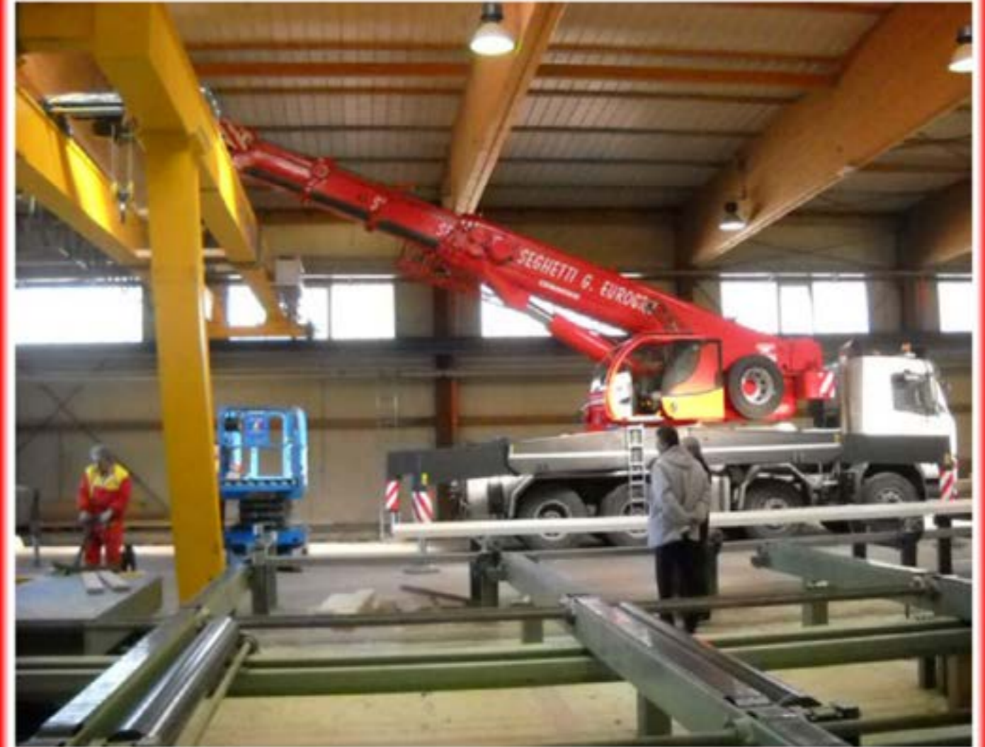
Montaggio carro Ponti Autogru T150