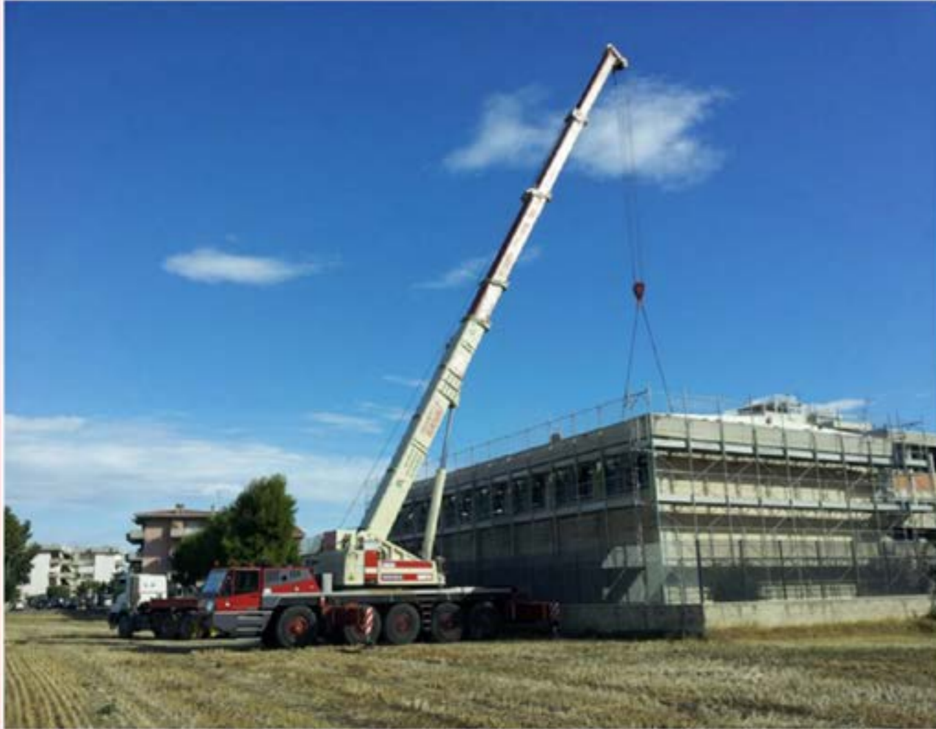
Autogru T.120 - Smontaggio Solaio